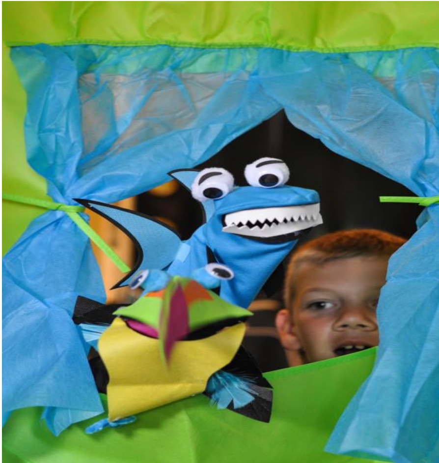
Slika 12. Dijete i lutka, https://www.suburble.com/2014/06/sock-puppet-love-exercising-imaginations.html (pristupljeno 25. 8. 2021.)