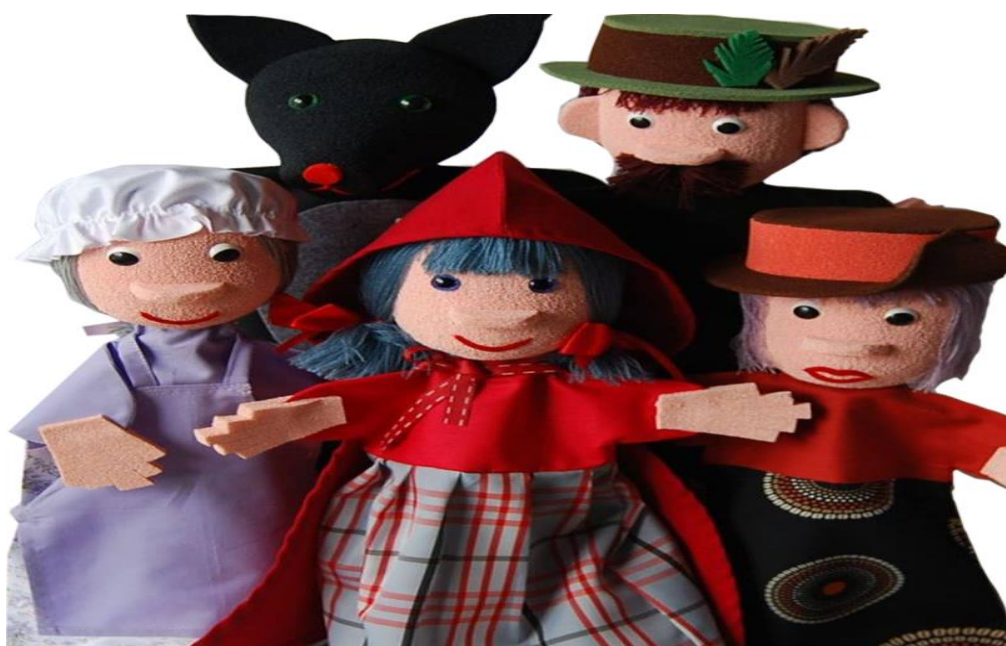
Slika 4. Ginjol-lutke, https://www.astrejaplus.hr/proizvod/lutke-ginjol-crvenkapica-5-likova/ (preuzeto 22.08. 2021.)