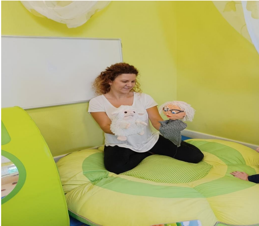
Slika 15. Odgojiteljica s lutkama