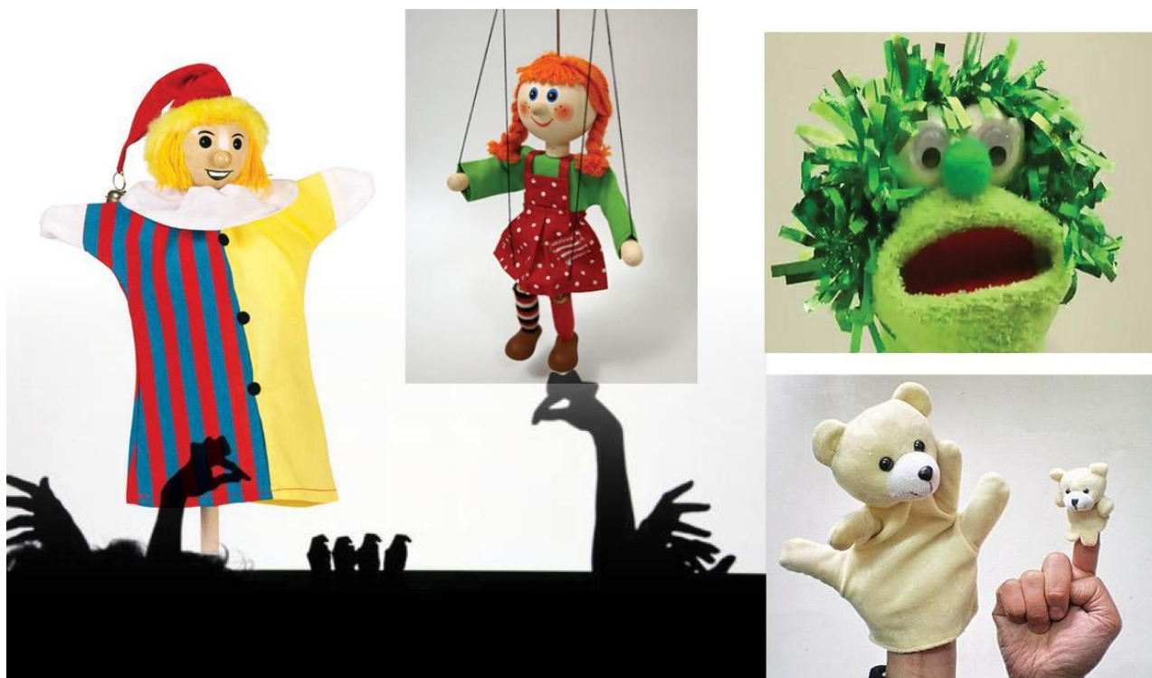
Slika 1. Scenske lutke, https://www.profil-klett.hr/lutka-prijatelj-i-suradnik-u-ucenju (preuzeto 21. 8. 2021.)