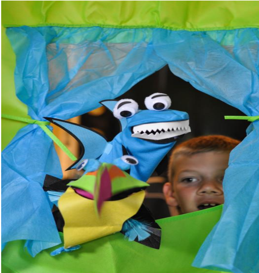
Slika 12. Dijete i lutka, https://www.suburble.com/2014/06/sock-puppet-love-exercising-imaginations.html (pristupljeno 25. 8. 2021.)