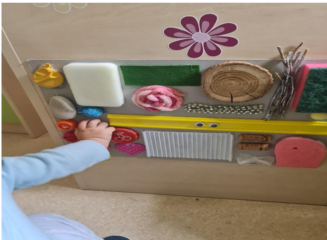
Slika 14. Senzorna ploča