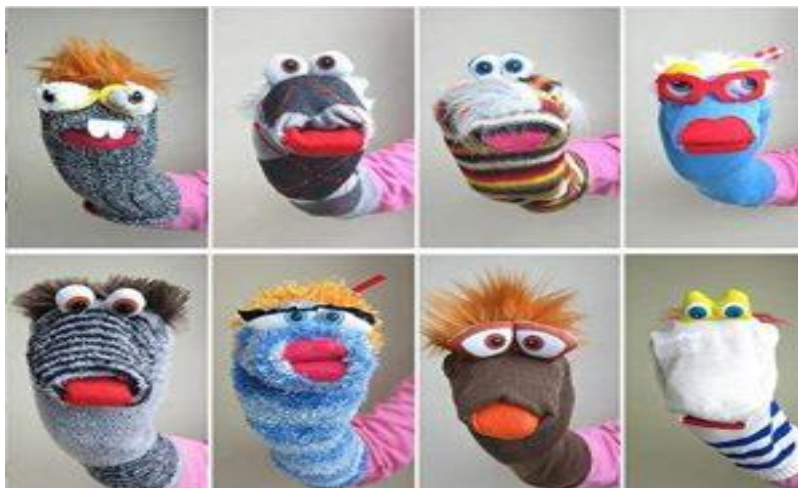
Slika 5. Lutke zijevalice, http://dv-simaslina.com/svjetski-dan-kazalista/ (preuzeto 22. 8. 2021.)