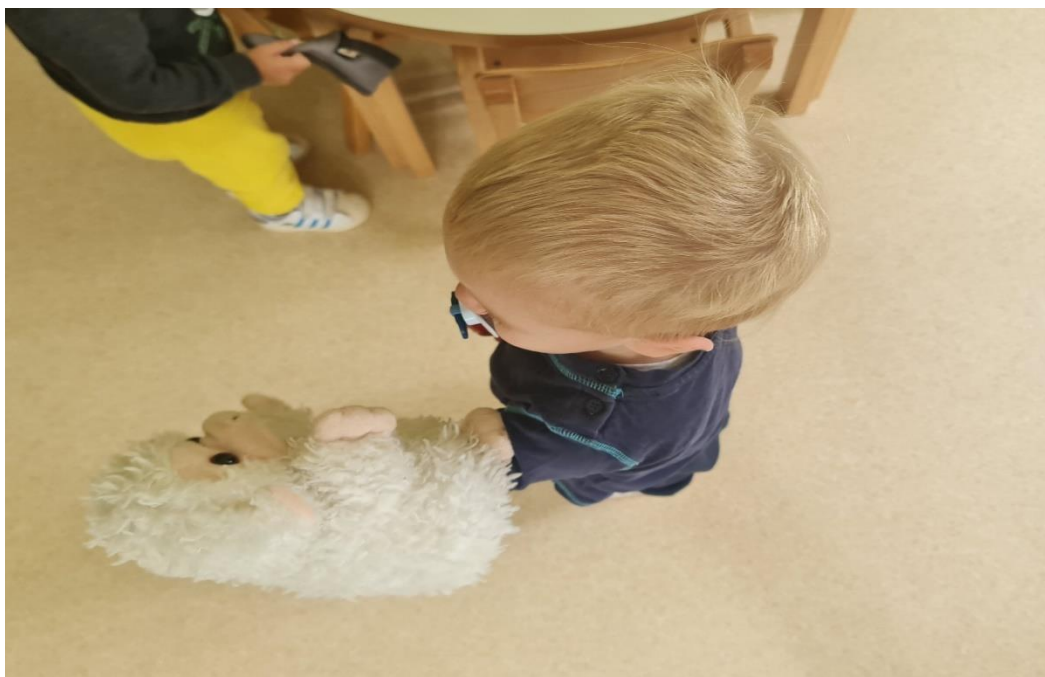
Slika 17. Dječak stavlja lutku na ruku i igra se s njom