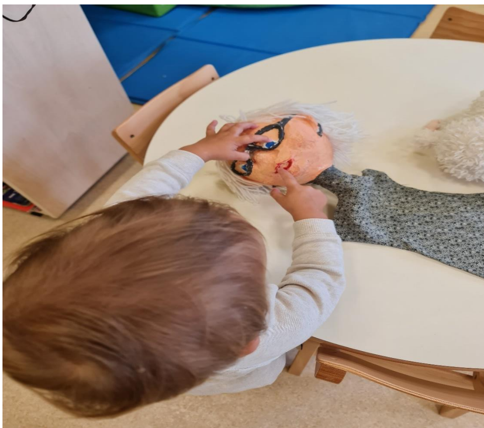
Slika 16. Dječak istražuje teksturu lica i kose lutke