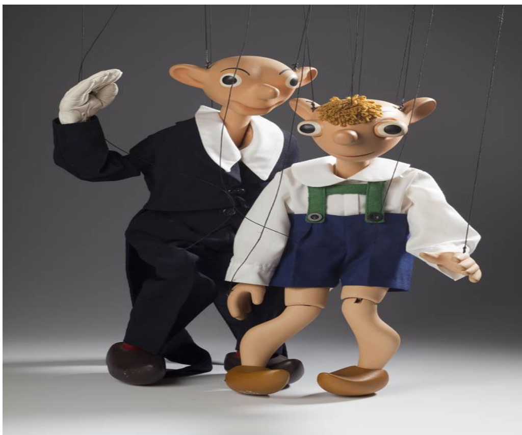
Slika 8. Spejbl i Hurvinek, https://muzeum-loutek.cz/en/73-home/galerie-loutek-na-titulce/254-spejbl-and-hurvinek (preuzeto 22. 8. 2021.)