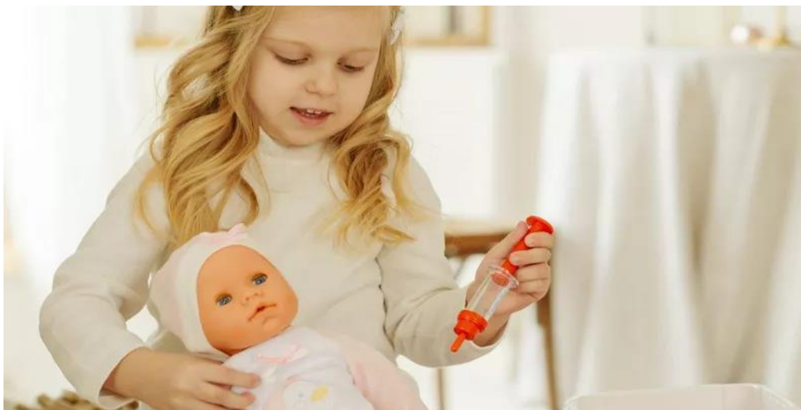
Slika 9. Simbolička igra s bebom, https://hr.pour-femme.org/8880633-symbolic-game-let39s-pretend-that-this-is-why-it-is-important-for-children (preuzeto 23. 8. 2021.)

Sposobnost simboličke igre jedan je od najvažnijih djetetovih razvojnih koraka. Dijete će se igrati onih aktivnosti kojima svakodnevno svjedoči. Između druge i četvrte godine djeca se igraju jednostavnih aktivnosti odraslih osoba koje svakodnevno gledaju (hranjenje, kuhanje, uspavlivanje) te najviše koriste lutke djevojčica, dječaka ili životinja. Od četvrte godine nadalje dječja igra je sve maštovitija i zahtjevnija zahvaljujući većoj tjelesnoj snazi, motoričkoj spretnosti, bogatijoj mašti i razvijenijem govoru. U igri s lutkom djeca govore i nastupaju s likovima lutki upotrebljavajući razne geste, govor ne bi li dočarala ono što zamišljaju.