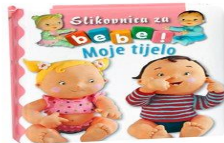
Slika 13. Slikovnica za bebe! Moje tijelo, https://www.hocuknjigu.hr/proizvodi/knjige/knjige-za-djecu/slikovnice/slikovnica-za-bebe-moje-tijelo (pristupljeno 27.8.2021.)