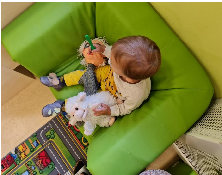
Slika 15. Dječak se igra s lutkama