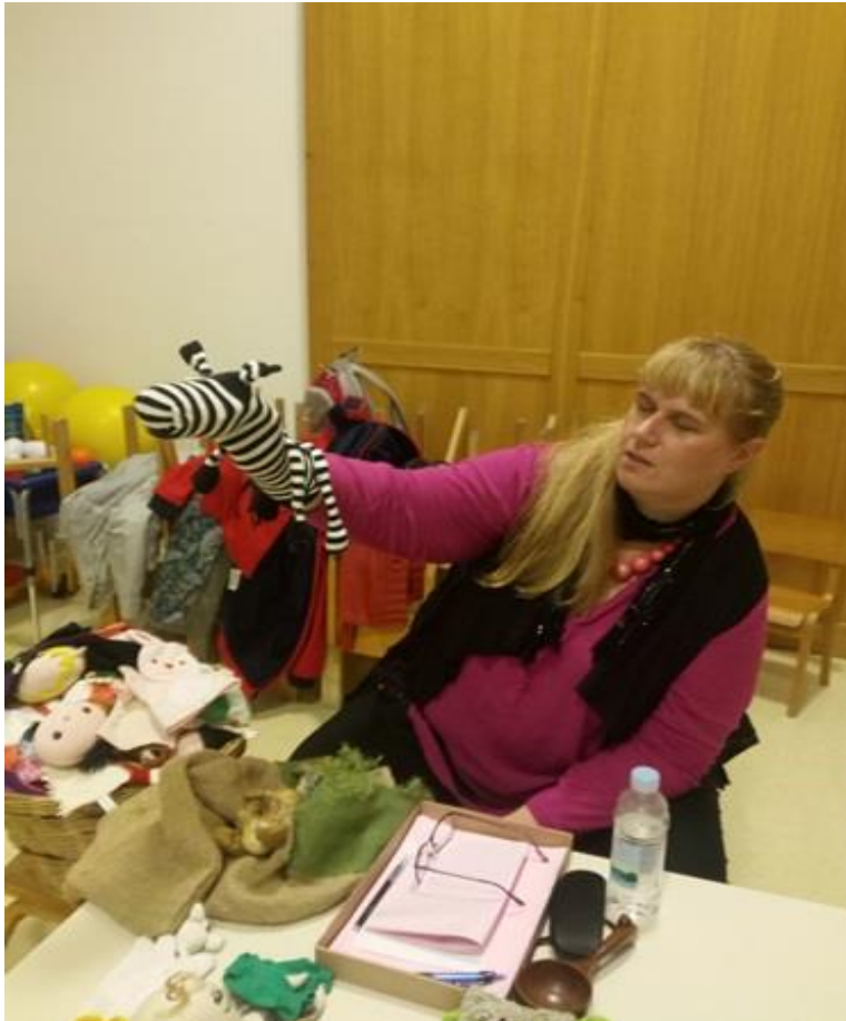
Slika 11. Odgojiteljica i lutka, https://dv-grlica.hr/2019/11/14/lutkarski-studio-kvak-u-dječjem-vrtiu-grlica/ (pristupljeno 24. 8. 2021).