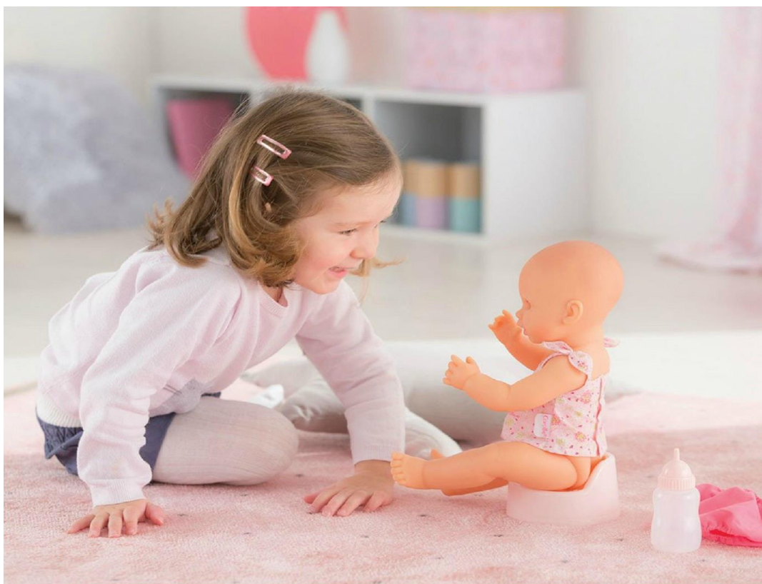
Slika 10. Razgovor djevojčice i lutke bebe, https://lafaboo.com/blog/bebe-lutke-razvoj-djece-175/ (pristupljeno 23. 8. 2021.)