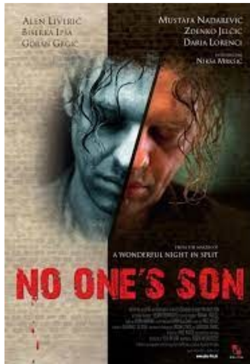
Slika 7. Naslovnica filma Ničiji sin .