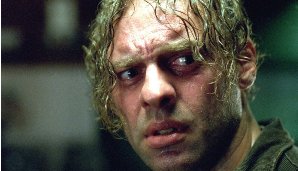
Slika 8. Scena iz filma Ničiji sin .