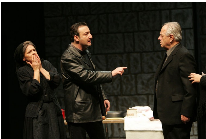
Slika 4. Scena iz kazališne predstave Sinovi umiru prvi .