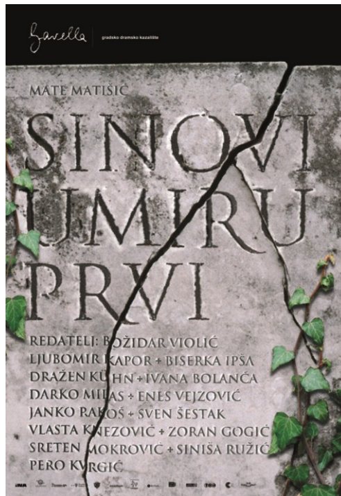
Slika 3. Plakat za predstavu Sinovi umiru prvi u Gavelli.