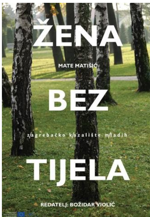
Slika 5. Plakat za kazališnu predstavu Žena bez tijela u ZKM-u.