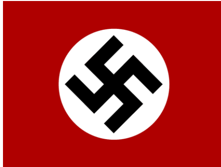
Slika 4. Zastava nacističke Njemačke

Hitler postaje kancelar i postavlja totalitarni režim. Slično kao i Mussolini u Italiji, Hitler u Njemačkoj svojim govorima nastoji uvjeriti ljude kako on i njegova politika imaju rješenje svih kriznih situacija u državi, pod time također navodi kako će osloboditi zemlju od komunista, Židova i drugih pojedinaca koje je smatrao neprijateljima Trećeg Reicha te kako će Njemačka na svjetskoj sceni biti država na vrhu. Kao konačnu odluku u namjeri da pokori Europu, Hitler sa nacistima 1. rujna 1939. napada Poljsku, čime započinje Drugi svjetski rat.