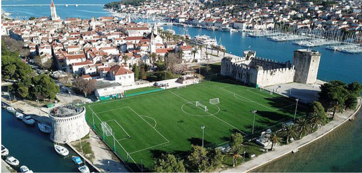
Slika 20. Nogometno igralište Batarija u Trogiru

nogometni klub HNK Trogir. Jedinstvenost Batarije je u tome što je smještena između dva zaštićena kulturna spomenika, odnosno između kule Kamerlengo i kule sv. Marka što ga čini atraktivnim spojem sportskog i kulturnog turizma. 115