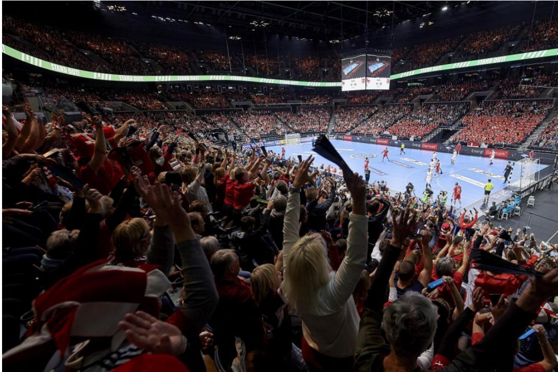
Slika 7. Svjetsko rukometno prvenstvo 2019. godine