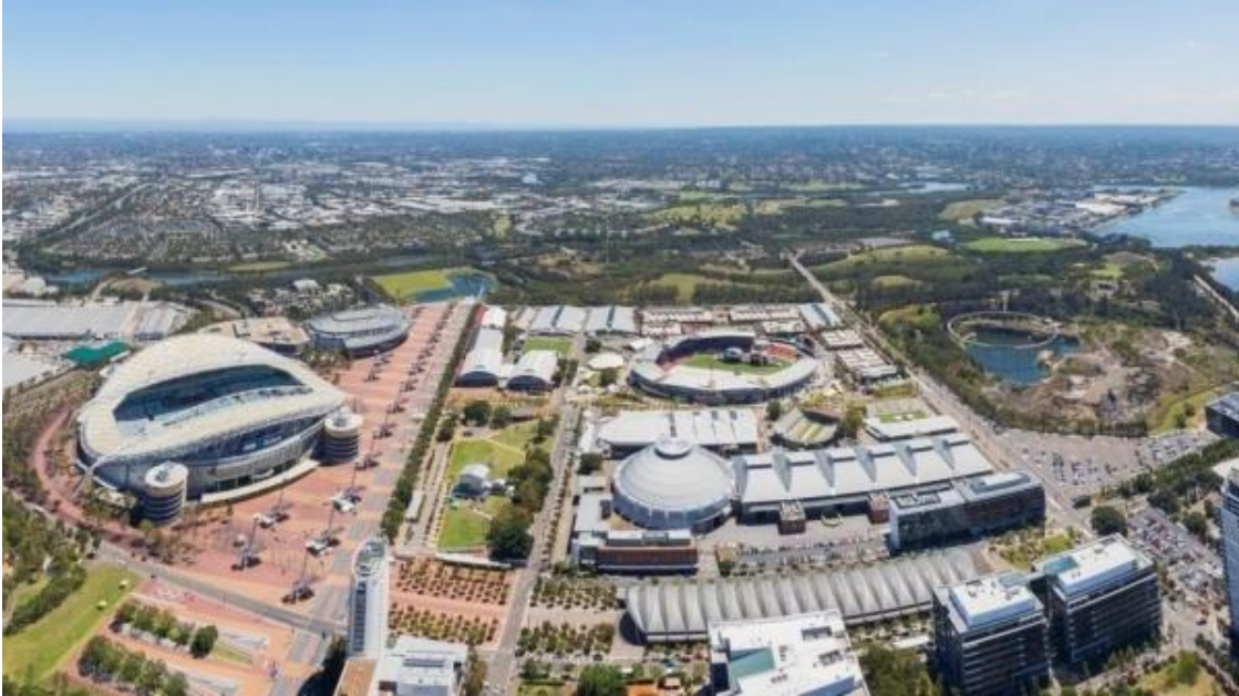
Slika 17. Olimpijski park u Sydneyju

Atrakcije sportskog turizma su i Olimpijski parkovi poput onih u Londonu i Sydneyju. Olimpijski park kraljice Elizabete u Londonu otvoren je za posjetitelje, a uključuje stadion i sportske dvorane korištene za vrijeme Olimpijskih igara 2012., te druge sportske sadržaje, kao i restorane, barove, umjetnička djela, te razne druge atrakcije. 97 Sličan kompleks nalazi se i u Sydneyju u Australiji, a čini ga infrastruktura korištena za Olimpijske igre 2000. godine. 98