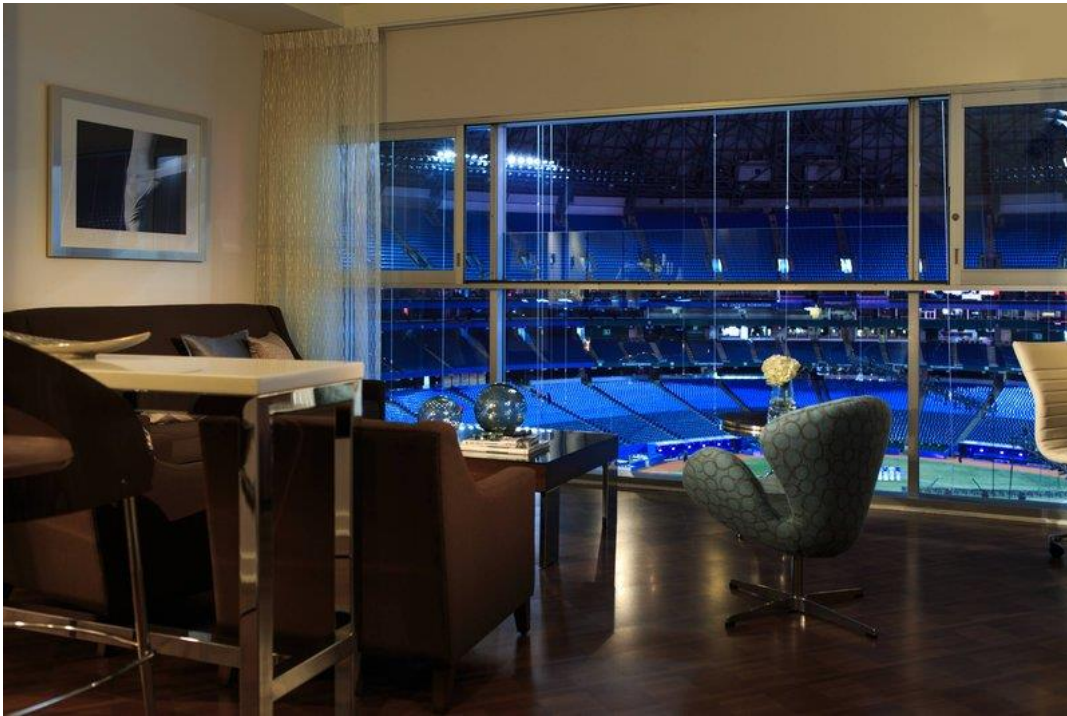
Slika 2. Soba s pogledom na stadion u Renaissance Toronto Downtown hotelu

Center, doma bejzbol ekipe Toronto Blue Jays. Apartmani su, kao i restoran, pozicionirani tako da imaju pogled na unutrašnjost stadiona, pa gosti mogu pratiti utakmicu iz udobnosti vlastitog smještaja, bez dodatnog plaćanja ulaznice. Također, hotel nudi i sportske sadržaje poput bazena u zatvorenom, te teretane.