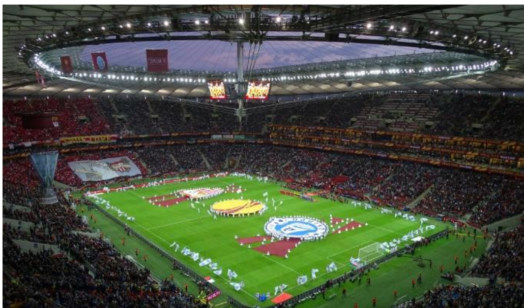
Slika 6. Nacionalni stadion u Varšavi za vrijeme otvorenja Europskog nogometnog prvenstva 2012. godine

Europsko nogometno prvenstvo za muškarce održava se od 1960. godine i uključuje 24 najbolje europske reprezentacije. Natjecanje se organizira svake četiri godine, u razmaku od dvije godine od Svjetskog prvenstva, a traje mjesec dana. Broj domaćina se kroz povijest mijenjao od jednog ili dva, pa sve do najnovijeg formata s 12 država domaćina koji će se prvi put odigrati na ljeto 2021. godine. 57 Pozitivan utjecaj održavanja ovakvog događaja na turističke brojke vidljiv je na primjeru Poljske koja je 2012. godine bila domaćin istog. Poljsku je te godine posjetilo preko milijun turista više nego u godini ranije, a ta se brojka nastavila povećavati u narednim godinama, te je moguće zaključiti da je tome doprinijelo i prvenstvo koje je pomoglo u promociji destinacije. 58