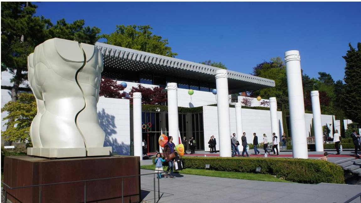
Slika 15. Olimpijski muzej u Luzani

Bitno je spomenuti i neke od brojnih muzeja posvećenih najstarijoj sportskoj manifestacija, odnosno Olimpijskim igrama, kao i Olimpijske parkove. Međunarodni olimpijski odbor, sa sjedištem u Luzani u Švicarskoj, 1993. godine osnovao je službeni muzej, smješten na obali Ženevskog jezera. Olimpijski muzej u Luzani potpuno je obnovljen 2013., te se današnja zbirka prostire na tri kata i uz pomoć preko 150 ekrana i 1500 predmeta prikazuje povijest i porijeklo Igara. U muzeju su, između ostalog, izložene i olimpijske baklje, medalje i oprema sportaša. 90