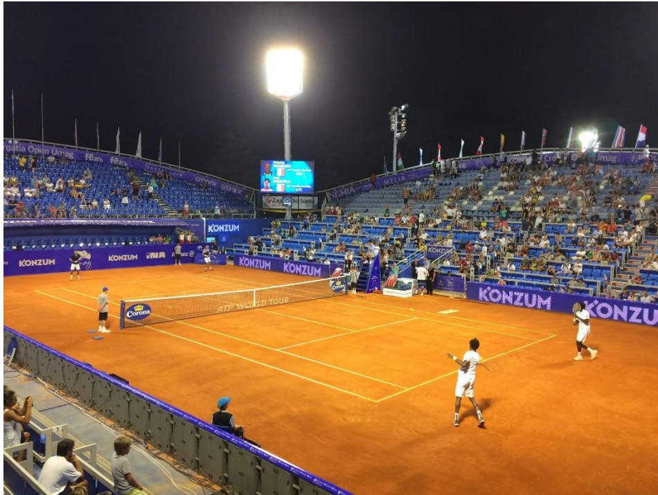
Slika 22. Stadion Goran Ivanišević za vrijeme Croatia Open Umaga

na Braču. Radi se o profesionalnom teniskom turniru za žene koji se od 2016. godine ponovno održava, nakon prekida od 2003. godine, i to početkom lipnja. 143