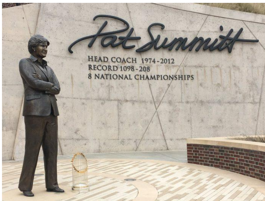
Slika 19. Kip košarkaške trenerice Pat Summitt