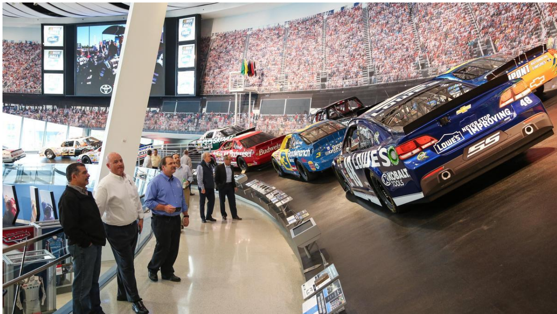
Slika 16. NASCAR kuća slavnih

Također, potrebno je spomenuti i kuće slavnih kao jedan element ponude sportskog turizma. Primjer istog je Međunarodna teniska kuća slavnih smještena u Newportu, Rhode Islandu u SAD-u, koja uključuje i muzej u kojemu je izloženo preko 2000 predmeta. U istu je ove godine ušao i jedan od najpoznatijih hrvatskih tenisača, Goran Ivanišević, što će zasigurno privući turiste iz Hrvatske. 92 Tu je i Kuća slavnih profesionalnog američkog nogometa, odnosno Pro Football Hall of Fame , u gradu Canton u američkoj saveznoj državi Ohio. 93 U australskom je pak gradu Bowralu u Novom Južnom Walesu smještena International Cricket Hall of Fame , međunarodna kuća slavnih posvećena kriketu. 94 Valja još spomenuti i Hokejsku dvoranu slavnih u Torontu, Ontariju u Kanadi 95 , kao i NASCAR kuću slavnih u Charlotteu, Sjevernoj Karolinu u SAD-u posvećena povijesti Nacionalnog udruženja za auto-moto utrke. 96