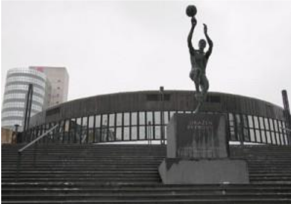
Slika 29. Muzejsko memorijalni centar Dražen Petrović