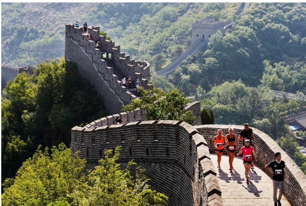
Slika 10. „Great Wall Marathon“

Atenski maraton održava se na istoj ruti koju je prema legendi otrčao Filipid od grada Maratona do Atene kako bi prenio poruku o pobjedi u bitci kod Maratona. S obzirom na to, specifičnost ove utrke je što se temelji na prvom maratону u povijesti, te završava na Olimpijskom stadionu na kojemu su odigrane prve moderne Olimpijske igre. 67 Great Wall Marathon utrka je koja se, kao što joj i samo ime kaže, održava na jednom od sedam svjetskih čuda, odnosno na Kineskom zidu. 68 Iz ovih se primjera može zaključiti kako se trčanje lako može povezati i s drugim elementima turističke ponude, poput kulturno-povijesne baštine, čime se privlače turisti različitih interesa i nude novi načini upoznavanja destinacija i atrakcija. Takav je primjer i Empire State Building Run-Up u kojoj sudionici moraju pretrčati svih 1576 stepenica, odnosno 86 katova te poznate zgrade. 69