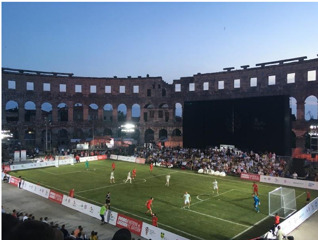
Slika 31. Dvoboj legendi u Areni

Ice Fever, susret hokejaša zagrebačkog Medveščaka s hokejašima austrijskog Vienna Capitals i ljubljanske Olimpije. 203 U pulskoj se Areni trebao održati i trodnevni teniski turnir s legendama tog sporta, poput McEnroea i Beckera, koji je bio najavljen za proljeće 2020. godine, ali je odgođen zbog pandemije koronavirusa. 204 Kao što je ranije u radu i spomenuto, Pula 2009. godine bila i jedan od domaćina Svjetskog rukometnog prvenstva.