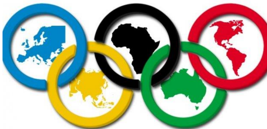
Slika 5. Simbolika olimpijskih krugova

iz svih krajeva svijeta koji se okupljaju na igrama. 46 U nastavku su prikazani olimpijski krugovi, te simbolika koju predstavljaju.