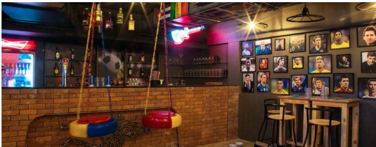
Slika 4. Playoffs Sport Lounge u Puneu

nogometaša, zastavama svijeta, te grbovima i zastavama sportskih klubova 44 , a sličan se restoran nalazi u Fujairahu u Ujedinjenim Arapskim Emiratima. 45