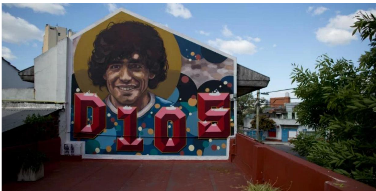
Slika 13. Muzej Diega Maradone „House of God“

Nekada su sportski muzeji posvećeni samo jednoj osobi, odnosno vrlo uspješnom sportašu koji je ostavio snažan trag u svijetu sporta. Primjer istog su muzeji posvećeni Diegu Maradoni i Cristianu Ronaldu. Muzej pod nazivom House of God smješten je u rodnom gradu jednog od najboljih svjetskih nogometaša, Buenos Airesu u Argentini. Isti se nalazi upravo u kući u kojoj je Diego Maradona živio kao tinejđer, a prikazuje više od 2000 osobnih predmeta argentinskog nogometaša uključujući i originalan kuhinjski stol i krevet. 83