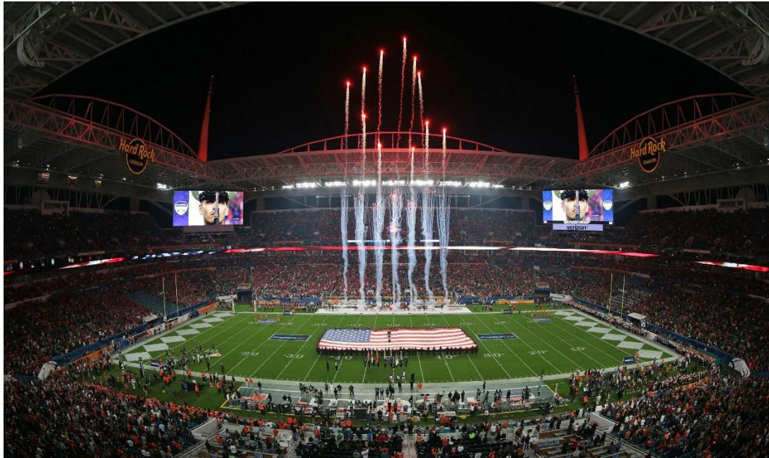
Slika 11. Hard Rock Stadium u Miamiu za vrijeme Super Bowla

godine Minnesota je ugostila Super Bowl LII čiji su posjetitelji dnevno trošili prosječno 608 dolara, dok tipični turist troši svega 124 dolara na dan. 76