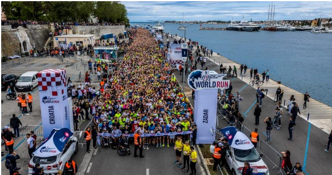
Slika 25. Start utrke Wings for life u Zadru

cilj predstavlja presretačko vozilo koje kreće sa starta 30 minuta nakon posljednjeg trkača, a za svakog je sudionika utrka gotova u onom trenutku kada ga vozilo sustigne. Wings for life u Zadru svake godine okupi do 10 000 sudionika i mnoštvo gledatelja. 149