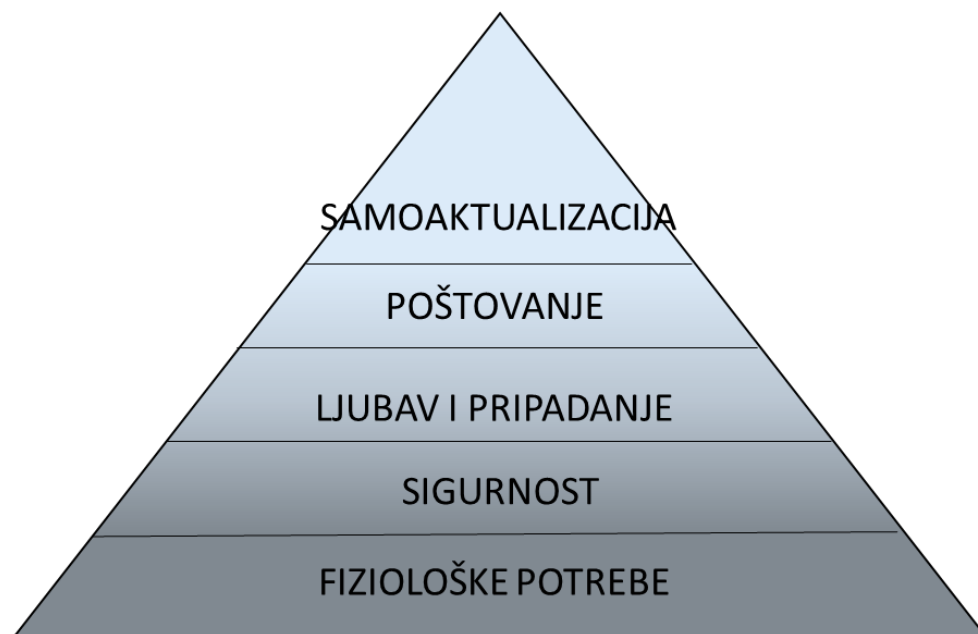
Slika 1. Maslowljeva hijerarhija potreba

Potrebe se mogu definirati kao niz dinamičkih snaga koje uvjetuju ponašanje ljudi, a manifestiraju se kao neugodnost zbog nečeg ili kao želja za nečim. Ranije navedena podjela turističkih motiva temelji se na hijerarhiji, odnosno piramidi potreba koju je kreirao Abraham Maslow 1954. godine. 4 Abraham Maslow bio je psiholog, porijeklom iz rusko-židovske obitelji, a rođen u New Yorku 1908. godine. Autor je brojnih knjiga na temu ljudske psihologije i motivacije, te je vjerojatno najpoznatiji upravo po svojoj hijerarhiji potreba. 5 Maslowljeva je hijerarhija potreba prikazana u obliku piramide podijeljene na pet kategorija: fiziološke potrebe, sigurnost, ljubav i pripadanje, poštovanje i samoaktualizacija. U nastavku je vizualno prikazana hijerarhija potreba u obliku piramide.