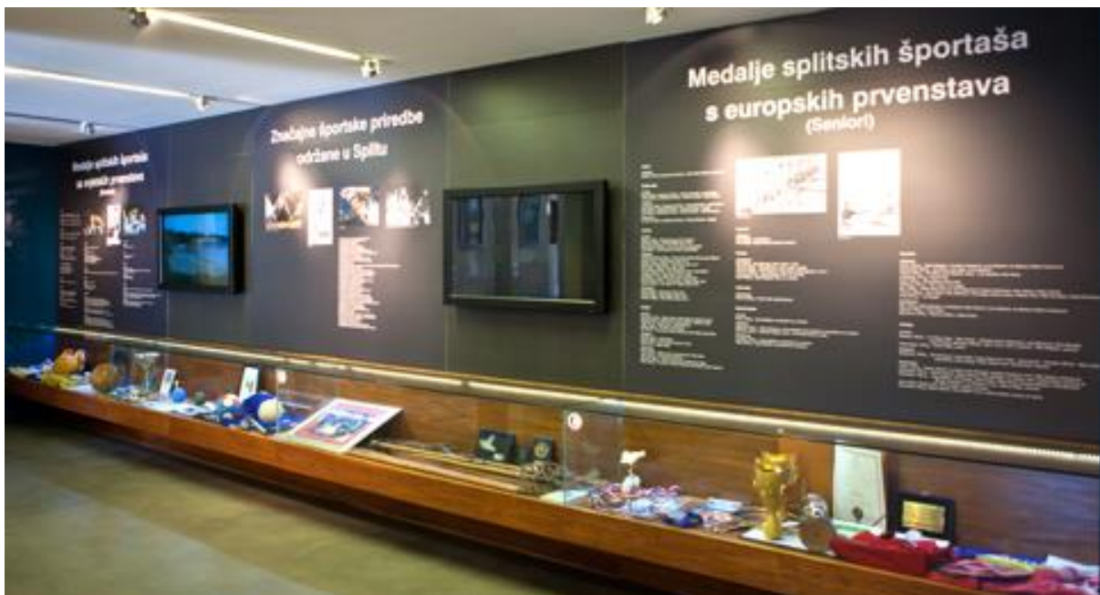
Slika 28. Kuća slave splitskog sporta