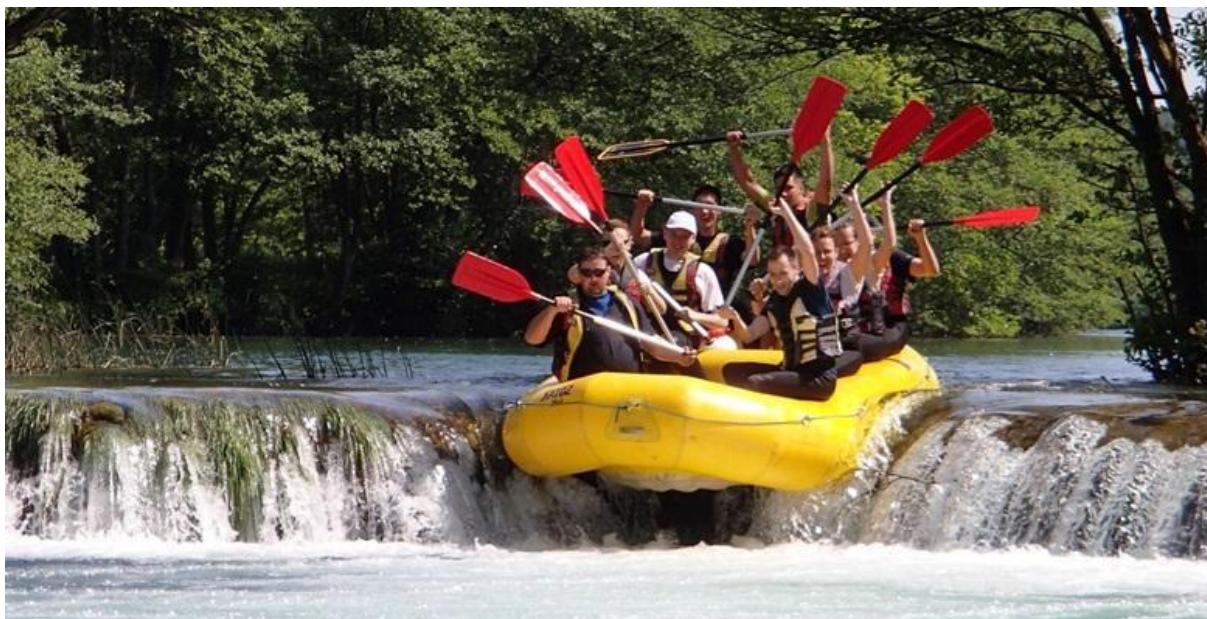
Slika 27. Rafting na Mrežnici

nudi i paintball i streličarstvo 174 , te Glavani park u Bičićima koji uključuje 11 metara visoku ljuljačku, stijenu za penjanje i ljudski katapult. 175