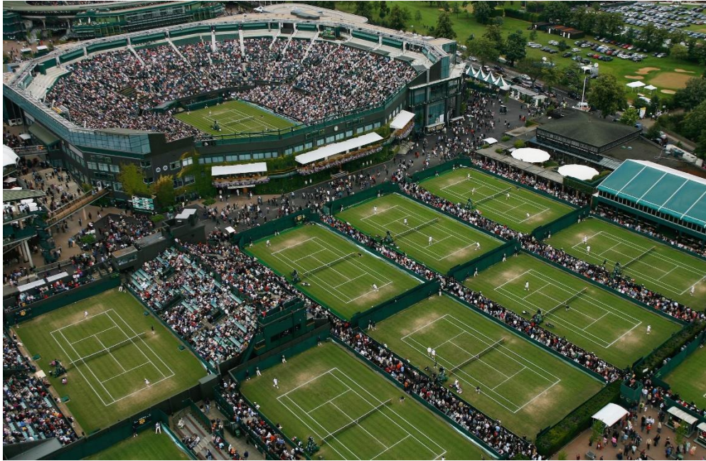
Slika 8. All England Club za vrijeme Wimbledon