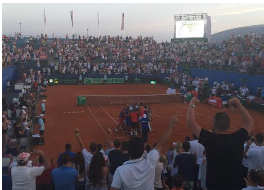
Slika 23. Polufinalni susret Davis Cupa 2018. između Hrvatske i SAD-a u Zadru

sastojao od ukupno pet mečeva, odnosno dva pojedinačna meča koja su se igrala petkom, te nedjeljom, dok se jedan meč parova odigravao subotom. 144 Hrvatska je u više navrata bila domaćin Davis Cup susreta i to u različitim gradovima iz svih krajeva zemlje. Neki od gradova u kojima se održala ova sportska manifestacija su Zagreb, Osijek, Varaždin, Split, Zadar, Dubrovnik i Poreč. Održavanje ovakvog događaja, omogućilo je hrvatskom turizmu da privuče domaće i strane posjetitelje u različite krajeve destinacije, ali i samim gradovima da razvijaju turizam izvan ljetne sezone, odnosno u pred i postsezoni. Samo u posljednje četiri godine, odnosno od rujna 2016., Davis Cup susreti su se u Hrvatskoj održali sedam puta. Godine 2016. održano je polufinale protiv reprezentacije Francuske u Zadru i finale protiv Argentine u Zagrebu, dok je početkom 2017. održan susret prvog kola protiv Španjolske u Osijeku. 2018., kada je Hrvatska osvojila svoj drugi naslov Davis Cup pobjednika, tri od četiri kola održana su upravo ovdje. Prvo je Osijek ugostio reprezentaciju Kanade, zatim se četvrtfinale s Kazahstanom odigralo u Varaždinu, dok je u rujnu Zadar bio domaćin polufinalnog susreta protiv reprezentacije Sjedinjenih Američkih Država. Posljednji ovakav događaj u Hrvatskoj održan je početkom ožujka 2020. godine, a radilo se o kvalifikacijama za novi format Davis Cup natjecanja koje su odigrane protiv Indije u Zagrebu.