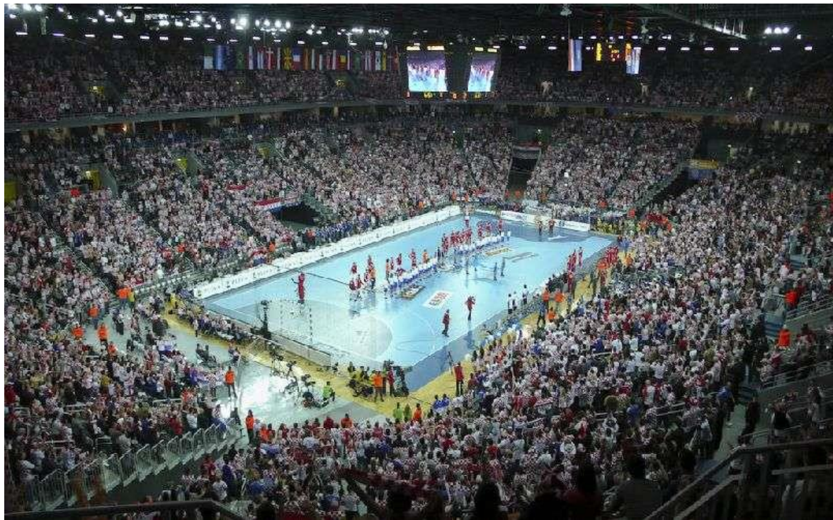
Slika 21. Svjetsko rukometno prvenstvo 2009. u Areni Zagreb

Hrvatska je do sada bila domaćin rukometnih prvenstava muških reprezentacija tri puta. Prvi je put bio 2000. godine kada je ugostila Europsko rukometno prvenstvo, što se ponovilo i 2018. godine, dok je između ta dva natjecanja održano i Svjetsko rukometno prvenstvo 2009.