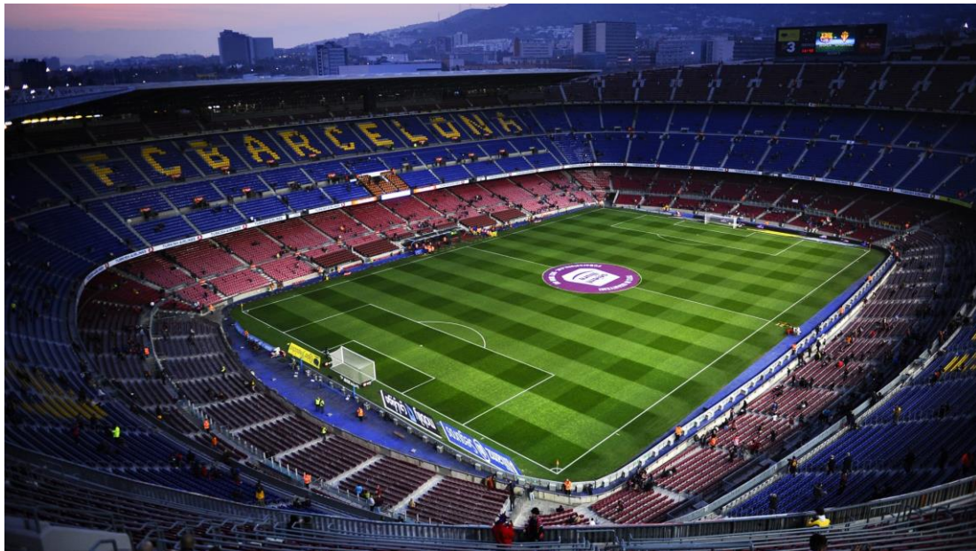
Slika 18. Stadion nogometnog kluba Barcelone Camp Nou