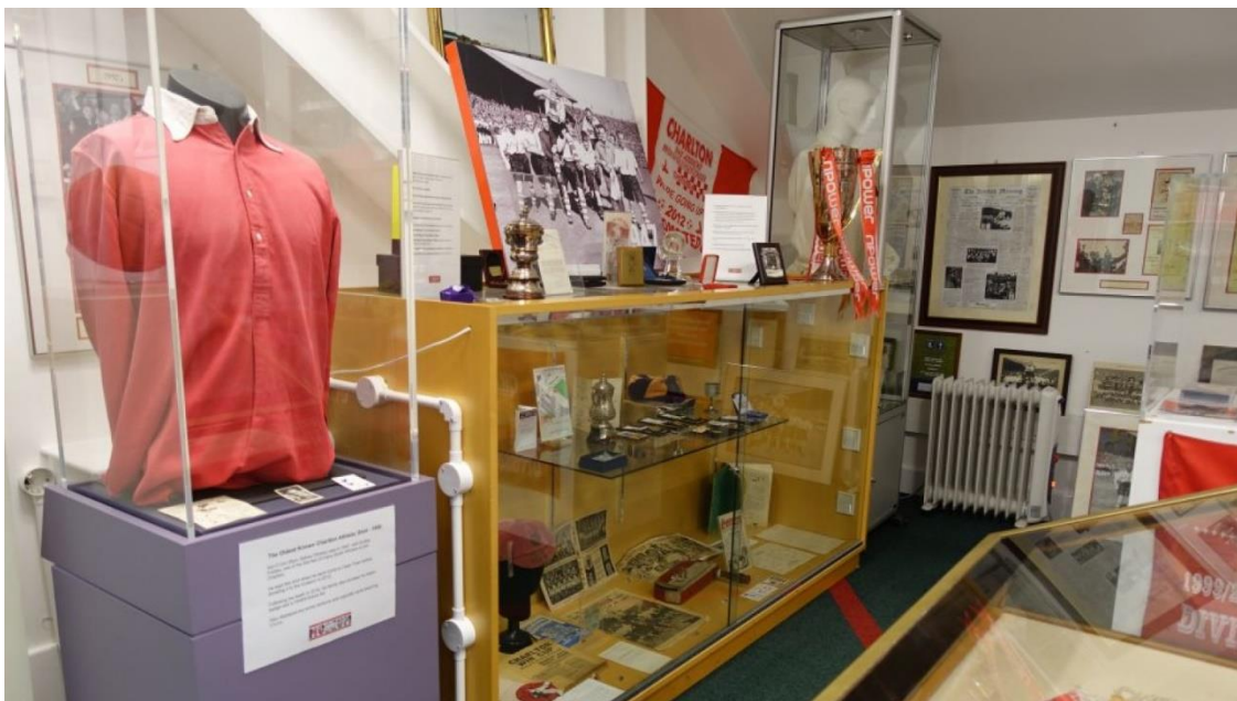
Slika 12. Unutrašnjost Charlton Athletic muzeja

Sportski muzeji mogu biti fokusirani i na određeni klubu što je slučaj sa Charlton Athletic muzejom koji je posvećen istoimenom nogometnom klubu. Muzej je nastao kao inicijativa volontera koji su željeli sačuvati baštinu svojeg omiljenog kluba i predstaviti ju kroz kolekciju razglednica i bedževa, te egzibicije posvećene nogometašu Johnu Hewieu i važnim događajima iz povijesti kluba. 81