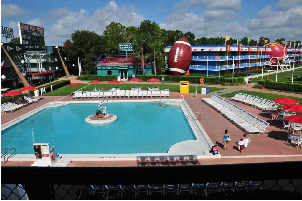
Slika 3. Disney All-Star Sport Resort