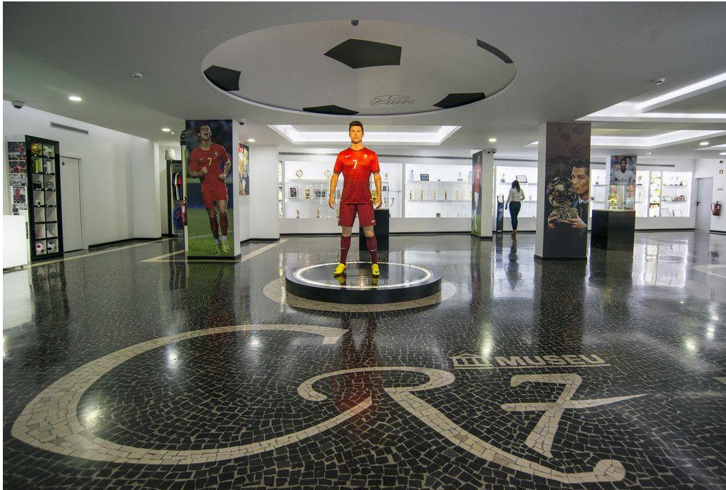
Slika 14. Muzej CR7

nagrade koje je Ronaldo osvojio tijekom dosadašnje karijere, poruke obožavatelja, prikazi najvažnijih uspjeha i golova, te drugi predmeti. 84