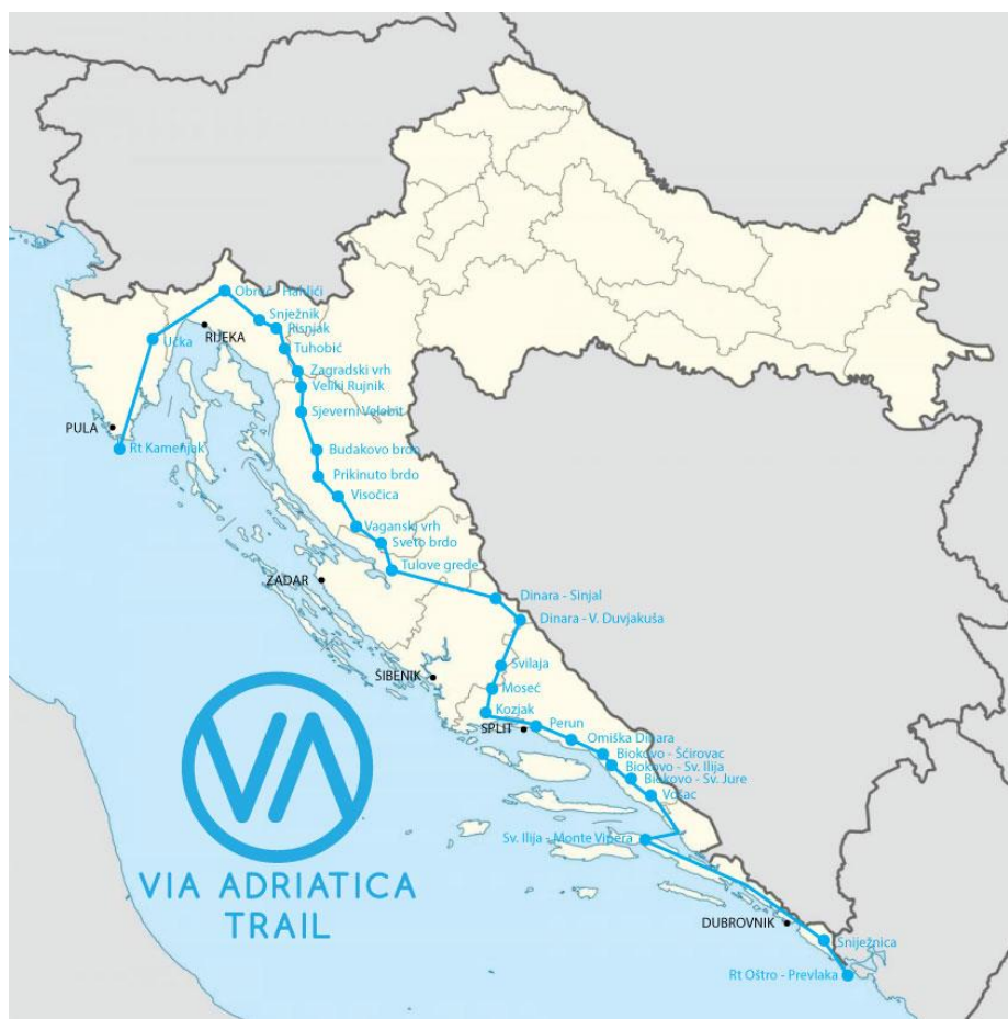
Slika 26. Ruta Vie Adriatice

Kalnička greda na Kalniku. 160 Treba još spomenuti i prvi long distance trail u Hrvatskoj, odnosno stazu koja se proteže od najjužnijeg dijela Istre do najjužnijeg dijela Hrvatske i obuhvaća ukupno 1100 km, a naziva se Via Adriatica. Staza započinje na Rtu Kamenjak, a završava na Rtu Oštro, te obuhvaća brojne planine i brda, devet rijeka, dva jezera, veliki broj zaštićenih područja i 53 općine u šest županija. 161