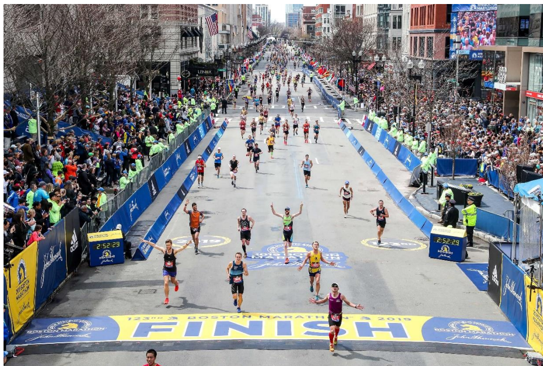
Slika 9. Bostonski maraton

Trčanje je brzorastući trend kojim se bavi oko 50 milijuna stanovnika Europske unije, te troši gotovo 10 milijardi eura na taj hobi. 65 Samim time raste i popularnost trčanja kao turističke aktivnosti. Danas se u svijetu svake godine organizira veliki broj trkačkih utrka. Iste se održavaju na svim dijelovima svijeta, a okupljaju brojne profesionalne i rekreativne trkače različitih uzrasta. Samo neki od njih su Londonski, Bostonski, Newyorški i Atenski maratoni, Color run, Empire State Building Run-Up, Walt Disney World Marathon i Wings for life o kojemu će više biti riječ u sljedećem potpoglavlju. Najveći i najpoznatiji maratoni svakako su oni u Tokiju, Bostonu, Londonu, Berlinu, Chicagu i New Yorku. Svaki od ovih događaja okuplja između 35 i 55 000 sudionika, te od pola milijuna do više od milijun gledatelja, a isti dolaze u destinaciju iz različitih krajeva svijeta. 66