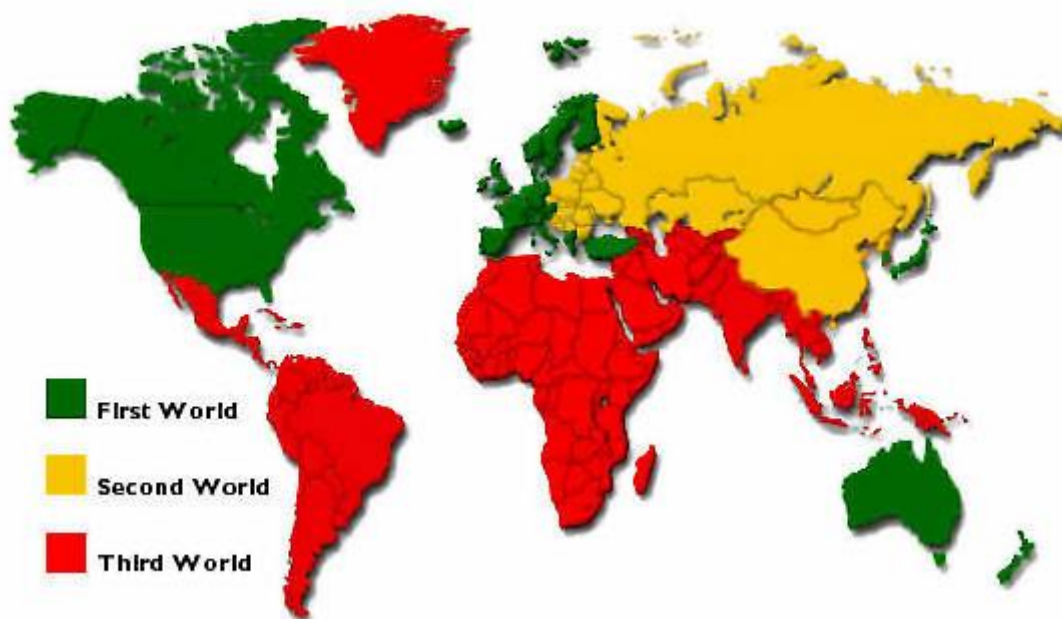
Slika 1. Zemlje trećeg svijeta