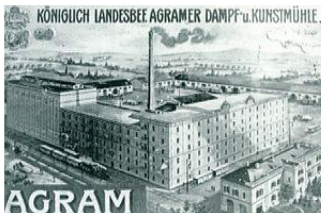
Slika 3 Paromlini kompleks 1914. godine