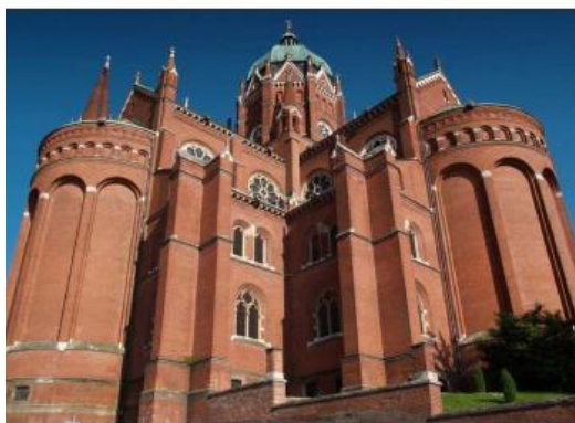
Slika 5 Pogled na katedralu iz ulice Luke Botića