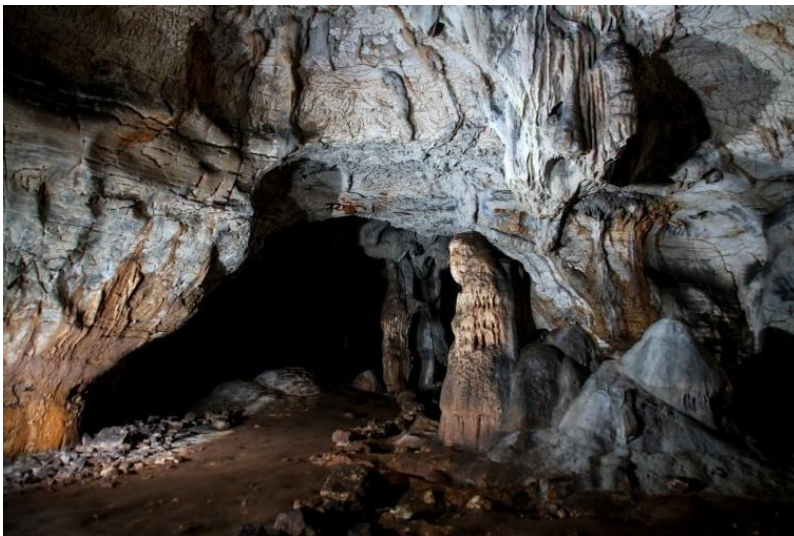
Slika 6. Romualdova pećina

Romualdova pećina ime je dobila po svetom Romualdu, koji je u njoj boravio od 1001. do 1003. On oko 1000. dolazi u Istru, u obližnji samostan Sv. Mihovila. Kako bi se posvetio asketskom i isposničkom životu sklanja se u jednu manju pećinu na sjevernoj strani Limskog kanala, nedaleko od spomenutog samostana. No, pošto je u toj pećini bio često posjećivan od strane okolnog stanovništva, povlači se u izoliranu pećinu – Romualdovu. Posljednjih 10ak godina Romualdova se pećina počela koristiti u turističke svrhe, a svake je godine posjećuje sve veći broj turista. Uređena je pristupna staza od dna Limskog kanala, koja vodi do same pećine. Na početku staze, uz nju te na ulazu nalazi se više info panoa u kojima se nalaze opisi Limskog kanala, Romualdove pećine, njene faune te detalji i zgode iz njene prošlosti, koja seže više od 40 000 godina unatrag. Turiste po pećini vode speleolozi, a posjetitelji mogu vidjeti geomorfološke spiljske ukrase, mjesto na kojem je po predanju obitavao sveti Romauld, brojne šišmiše te arheološke sonde u kojima su vidljivi ostatci proteklih vremena. Novi pristupi, poput obogaćivanja ponude, bolje prezentacija kroz raznovrsne kombinirane arheološko-turističke projekte te naglasak na rijetko prisutnu višeslojnost sadržaja samog lokaliteta mogli bi višestruko povećati broj posjetitelja te unijeti raznolikost u turističku ponudu (Arheološki muzej, 2011;360.).