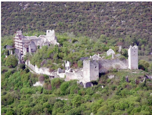
Slika 2. Dvigrad

Dvigrad se počeo istraživati 2001. te su u isto vrijeme istražene dijelove i konzervirali. Riječ je o nekadašnjem utvrđenom srednjovjekovnom naselju, odnosno kaštelu, od kojeg su ostale samo ruševine jer se stanovništvo s vremenom iselilo zbog epidemija i ratnih razaranja. Dvigrad je nastao na jednom od najbitnijih puteva od mora prema unutrašnjosti Istre. U 17. st. u gradu je živjelo tek nekoliko obitelji, a preseljenje župe u obližnji Kanfanar 1714. označilo je kraj Dvigrada. Nalazi keramike govore da je mjesto bilo naseljeno u prehistoriji, a postoji kontinuitet života u antici. Pronađeno je oružje, novac, epigrafski spomenici iz doba kada je Dvigrad bio uključen u sustav obrane sjeverne granice pulskog agera. Oružani sukobi s Venecijom uzrokovali su masovna iseljenja (Heart of Istria, str. 28.)