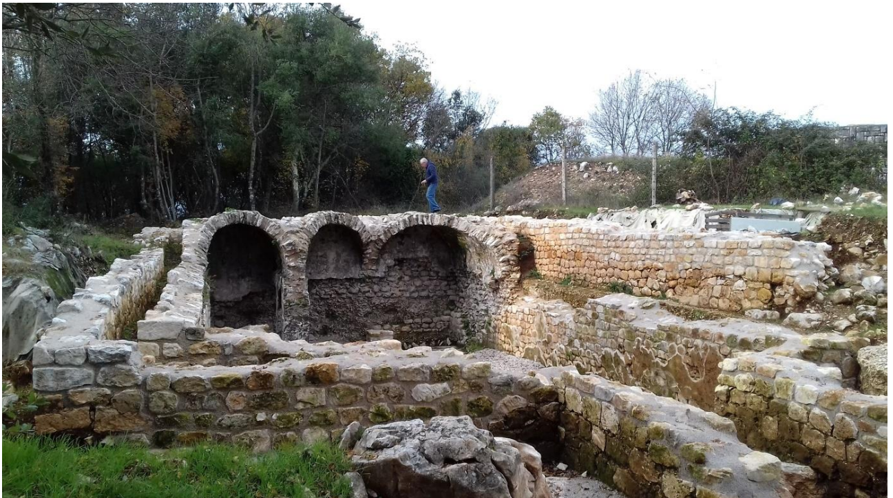
Slika 8. Prapovijesno nalazište Mukaba

Gradina Mukaba nalazi se na vrhu brda Moncalvo na nadmorskoj visini od 115 metara s koje se pruža pogled na otvoreno more na zapadu i gotovo čitav Lirski kanal. Sa zapadne strane brda nalazi se rimsko nalazište nazvano Finida. Gradinu okružuju ruševine dvaju kamenih bedema, a na ovom prostoru nalaze se i dvije velike kamene gomile te treća na najsjevernijem dijelu u neposrednoj blizini. Sjeverozapadnom dijelu platoa relativno je lako prići te je tamo stratigrafija dobro očuvana. Prilikom istraživanja pronađeni su mnogobrojni ostatci keramike; ulomci dvaju plitkih zdjela što će naposljetku omogućiti rekonstrukciju čitavih posuda. Pronađeni su i ulomci s dodanom trakom ukrašenom otiscima prsta, aplikama kružića i obrnutog slova U. Osim brojne keramike, za koju je preliminarnom analizom utvrđeno da pripada srednje brončanom dobu, otkriveni su brojni nalazi životinjskih kostiju (Ibid., https://ffpu.unipu.hr/cirla/projekti/archaeocultour/nalazista , pristupljeno 21.7.2021.).