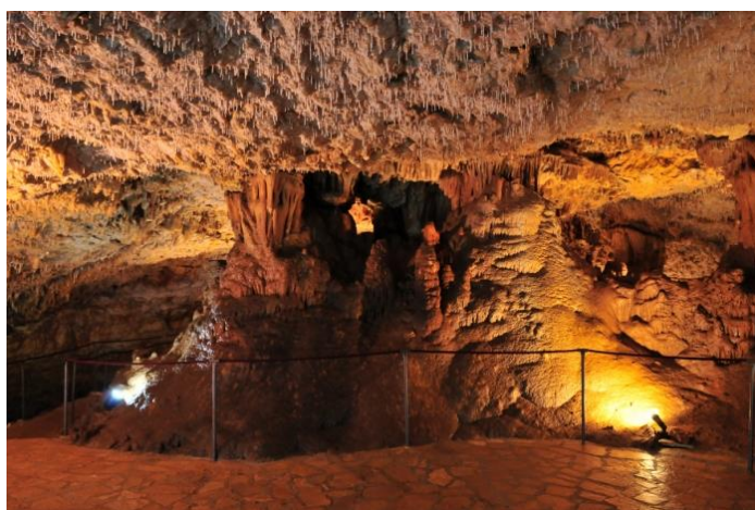
Slika 7. Špilja Mramornica

Špilja Mramornica jedna je od najvećih špilja na području istarskog poluotoka, a smještena je nedaleko od Brtonigle, u sjeverozapadnoj Istri. Mramornice se prvi put spominje još 1770. kada ju je posjetio, a potom i opisao poznati putopisac Alberto Fortis. Dubina špilje na ulazu je 10 metara, a spušta se do 20 metara. Temperatura u špilji je konstantna na 14 °C. Špilju je moguće posjetiti. Špiljske staze su uređene i osigurane pa se s njih mogu vidjeti nedostupni dijelovi Mramornice. Cijene se kreću od 50 kuna za odrasle do 25 kuna za djecu, 40 kuna za studente te 40 kuna za seniore (65+). U špilju se ulazi u pratnji vodiča, a jezici vođenja su hrvatski, talijanski, engleski i njemački (Agroturizam Sterle. http://www.agroturizamsterle.hr/hr/spilja-hr.html , pristupljeno 1.2.2021.).