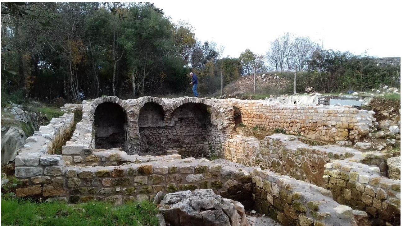
Slika 8. Prapovijesno nalazište Mukaba

Gradina Mukaba nalazi se na vrhu brda Moncalvo na nadmorskoj visini od 115 metara s koje se pruža pogled na otvoreno more na zapadu i gotovo čitav Lirski kanal. Sa zapadne strane brda nalazi se rimsko nalazište nazvano Finida. Gradinu okružuju ruševine dvaju kamenih bedema, a na ovom prostoru nalaze se i dvije velike kamene gomile te treća na najsjevernijem dijelu u neposrednoj blizini. Sjeverozapadnom dijelu platoa relativno je lako prići te je tamo stratigrafija dobro očuvana. Prilikom istraživanja pronađeni su mnogobrojni ostatci keramike; ulomci dvaju plitkih zdjela što će naposljetku omogućiti rekonstrukciju čitavih posuda. Pronađeni su i ulomci s dodanom trakom ukrašenom otiscima prsta, aplikama kružića i obrnutog slova U. Osim brojne keramike, za koju je preliminarnom analizom utvrđeno da pripada srednje brončanom dobu, otkriveni su brojni nalazi životinjskih kostiju (Ibid., https://ffpu.unipu.hr/cirla/projekti/archaeocultour/nalazista , pristupljeno 21.7.2021.).