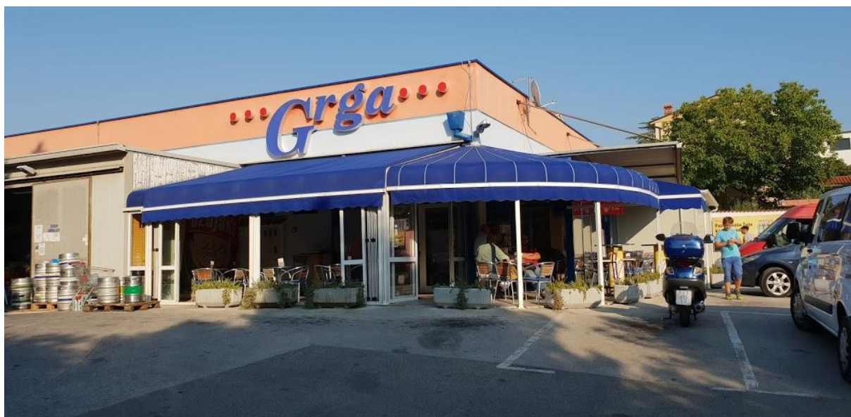
Slika 4. Market „Grga t.p.“