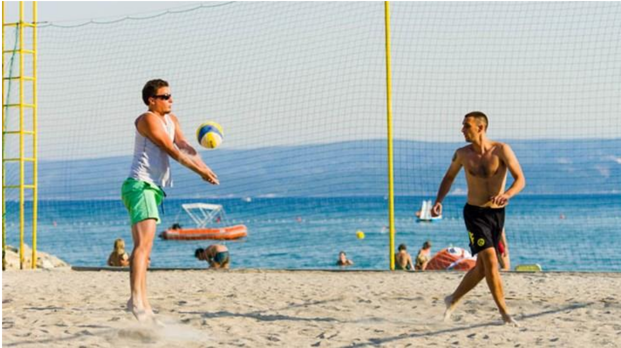
Fotografija 7: Odbojka na pijesku

Odbojka se igra u par grupa, svaka grupa ima po 5 članova. 17 Na kraju grupa koja pobijedi za nagradu im se uručuje simbolična nagrada(nagrade su najčešće kape, naočale i slično sa logom kampa).