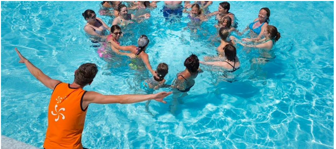
Fotografija 5: Aqua aerobic

Nadalje, sportske aktivnosti koje zahtijevaju još intenzivnije vježbe jesu keep fit, vježba s hula hopom, boks, vježbe za sagorijevanja masti, vježbe uz trampolin. Sve ovakve vježbe se izvode uz profesionalnog animatora koji će dodatno motivirati turiste, zbog toga i postoje animatori koji su samo za sportske aktivnosti. Cilj ovih aktivnosti jest motivirati turiste na vježbanje iako su na odmoru. Također, upotpuniti im dan i isto tako ponuditi nešto novo, nešto što još nisu probali.