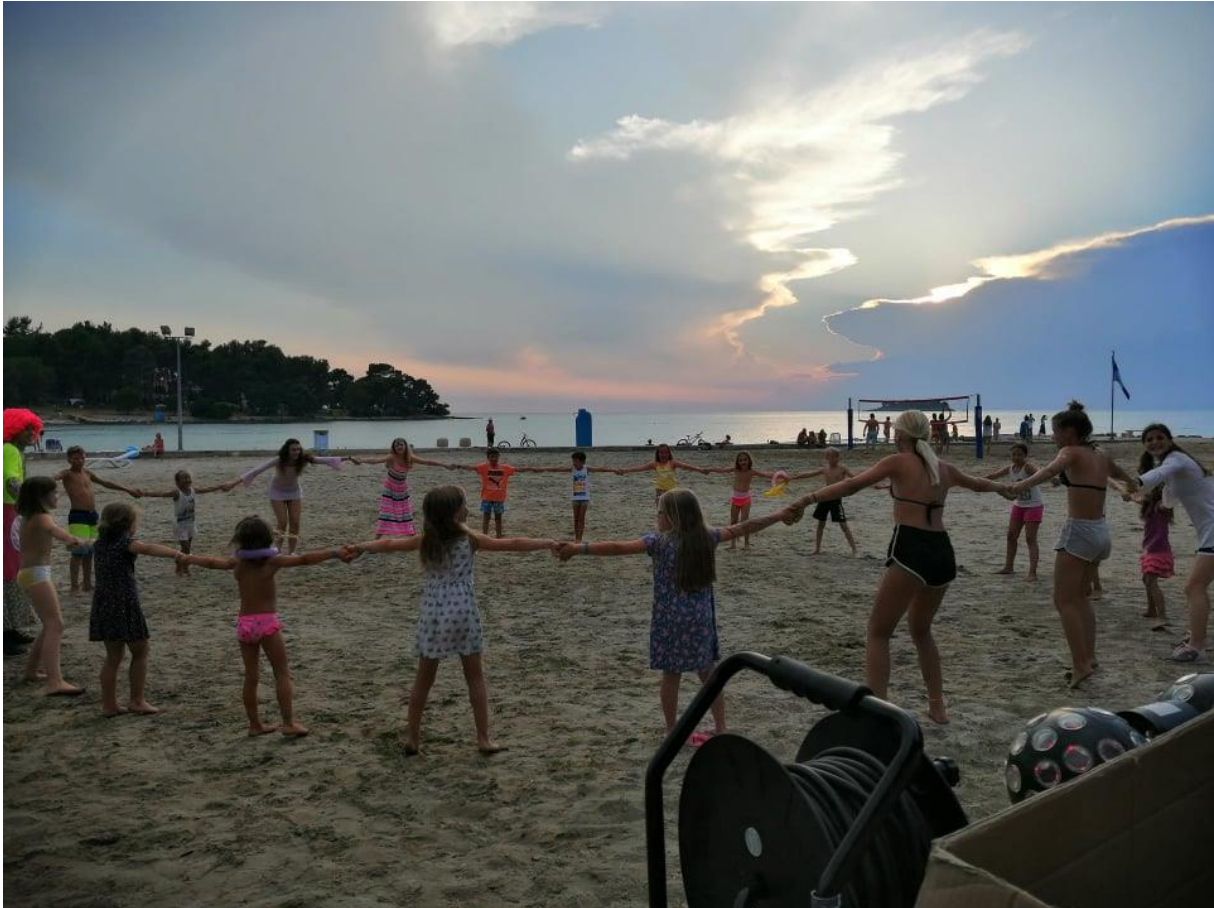
Fotografija 3: Mini disko

disco sadrži poznate dječije pjesme za koje postoje koreografije, uglavnom animatori pokazuju korake, a djeca koja su u krugu ponavljaju za animatorima. Na kraju programa ili između plesa organizira se igra gdje svako dijete dobiva simboličnu nagradu.