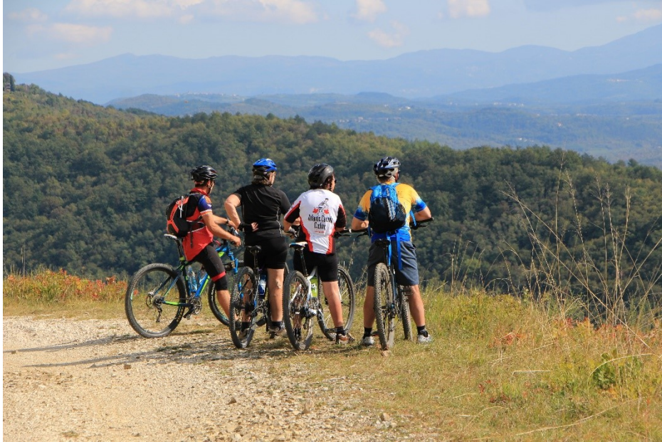
Slika 3.: Dio biciklističke dionice na Parenzani i pogled