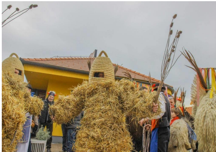
Slika 5. Pikač