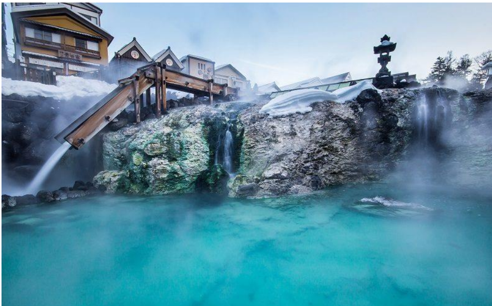
Slika 1. Japanski Onsen - izvor termalne vode