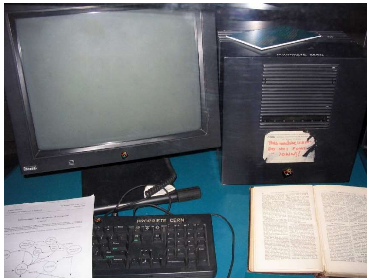
Slika 2.1. Prvi web poslužitelj na svijetu

Slika 2.1. prikazuje prvi web poslužitelj na svijetu, kojeg je Tim Berners-Lee razvio za CERN na NeXT Cube računalu 1990. godine.