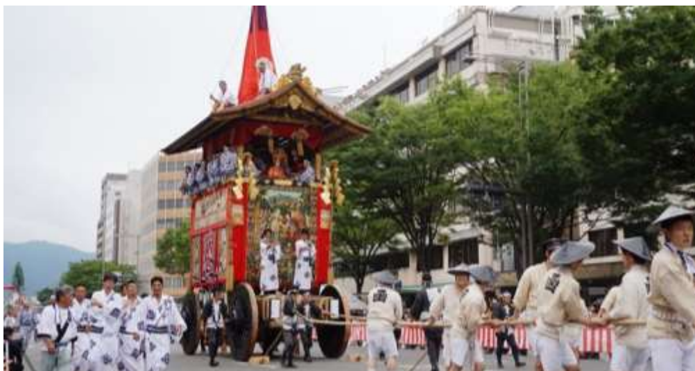
Slika 1: Splav korištena tijekom Gion Matsuria