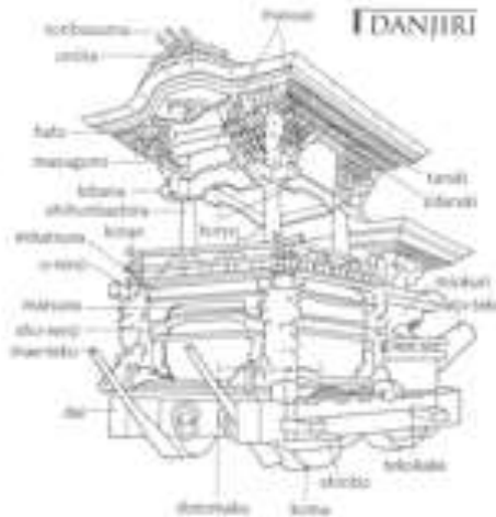
Slika 5: Danjiri

Osim yame i hoko, još jedna splav koja se koristi u matorijima je danjiri . Kishidawa festival je poznat upravo po brojnim danjirijima, odnosno u ovom festivalu, koji čuva svoju tradiciju preko 280 godina, koristi se 32 danjirija te svaki mjeri četiri metra u visinu, dva i pol metra u širinu i teži oko četiri tone, a krasi ih reljefni ukrasi koji opisuju slave epizode iz dobro poznatih borbenih priča prošlosti (Ozawa, 1999: 115).