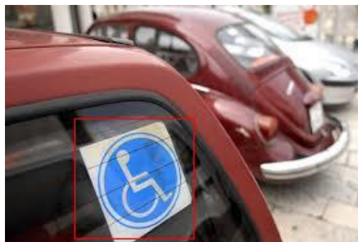
Slika 7: Naljepnica za parkiranje vozila osoba s invaliditetom

Kao primjer toga mogu biti javna parkirališta, gdje bi se nadzirala parkirna mjesta, a posebno ona predviđena za osobe s invaliditetom. Osobe s invaliditetom na vjetrobranu svojih vozila imaju naljepnicu s oznakom koju bi sustav vrlo lako moglo prepoznati. Ukoliko bi se vozilo bez takve oznake parkiralo na invalidsko mjesto, kamerom bi se slikala tablica koju bi strojno učenje pročitalo te bi na osnovu nje sustav poslao kaznu vlasniku nepropisno parkiranog vozila. Isto tako mogu se očitavati parkirne karte, bile one papirnate, kada bi promatrali kokpit automobila ili plaćene drugim metodama, kada bi prepoznajući tablice čitali u sustavu ima li zapisa za njih. S uvođenjem navedenog ne bi bilo potrebe za fizičkim prisustvom zaposlenika na parkiralištima. Slika 7 prikazuje naljepnicu koja označava da je vozilo osobe s invaliditetom.