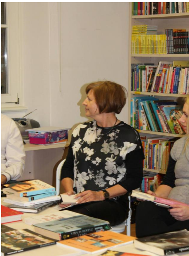
Slika 3. Predstavljanje radionice