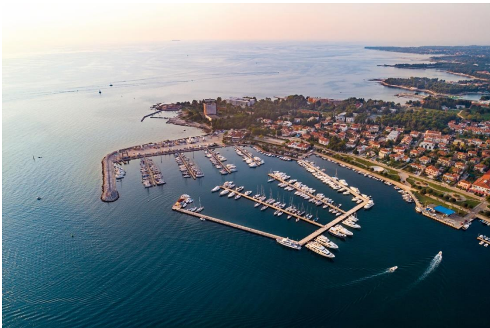
Slika 6. ACI marina Umag