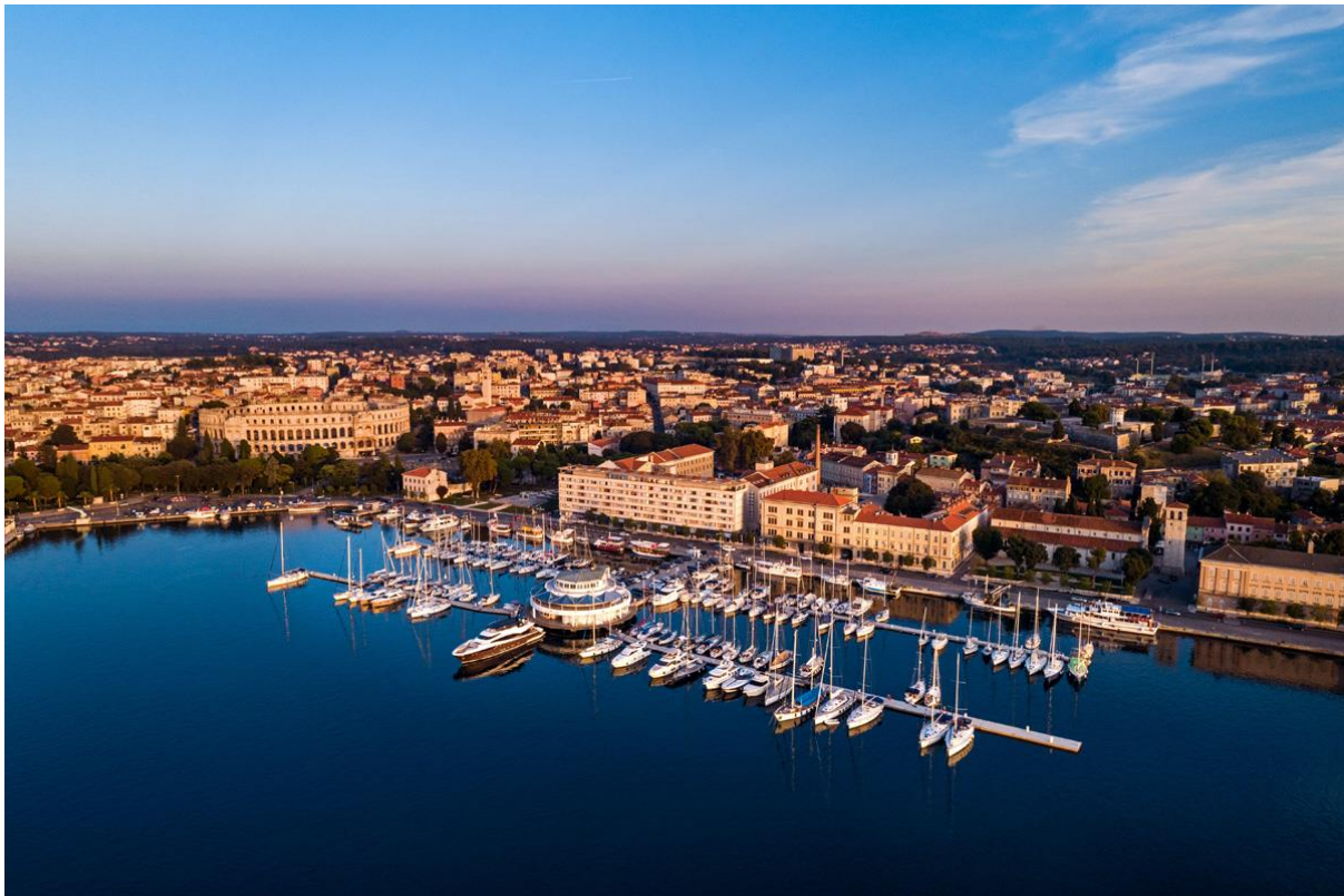
Slika 3. ACI marina Pula