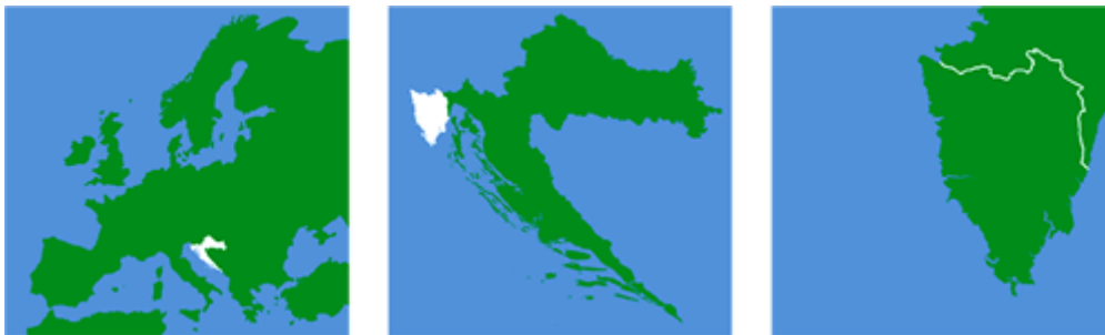
Slika 1: Položaj Hrvatske u Europi, položaj Istre u Hrvatskoj i izgled poluotoka Istre

Slikom 1. prikazan je položaj Hrvatske u Europi, položaj Istre u Hrvatskoj te izgled poluotoka Istre.