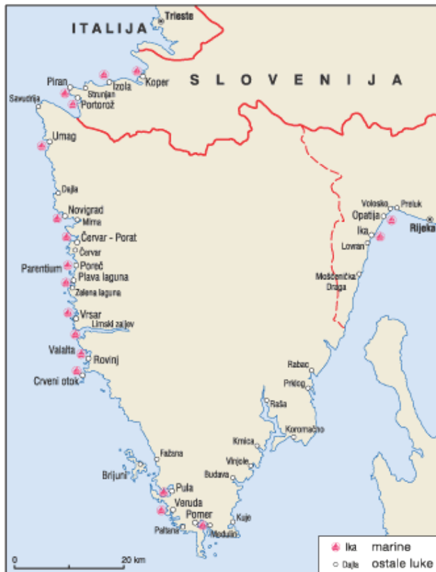
Slika 2. Luke i marine Istre

Na Slici 2. prikazana je karta Istre sa lukama i marinama.