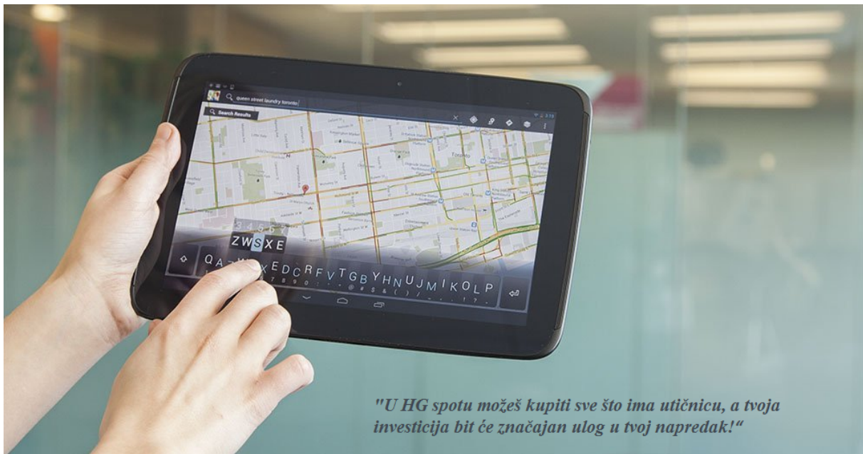
Slika 5. Početak promotivnog storytellinga poduzeća HG SPOT d.o.o.