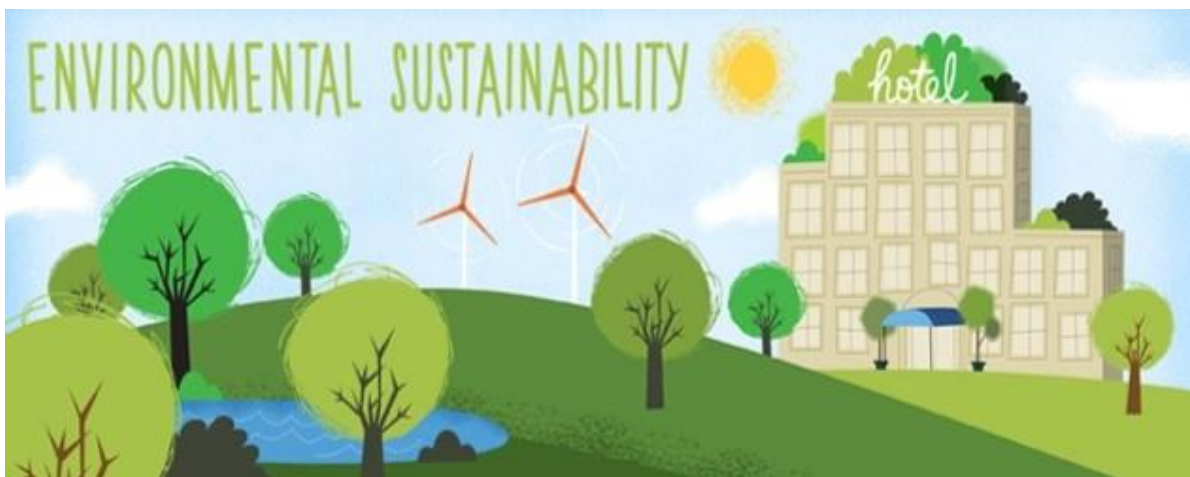
Slika 1: Ilustrativni prikaz održivog hotela

Uvođenje ekološke politike u hotelima obično je motivirano, s jedne strane korišću od zelenog poslovanja, a s druge strane štetama nastalim zbog nespremnosti hotela da u svoju poslovnu politiku uvrsti i ekološke kriterije. Biti zelen je postala top tema kojom se bavi posljednjih nekoliko godina i nastavlja dalje privlačiti pozornost. Nekoliko studija u hotelima je potvrdilo kako se mogu ostvarit ekonomske koristi kroz provedbu okolišnih i društvenih inicijativa. Osim troškova ulaganja, postoje koristi hotela pri odabiru ekološki prihvatljivog poslovanja.