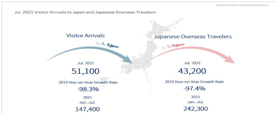
Slika 2. Dolasci posjetitelja u Japan i inozemna putovanja Japanaca