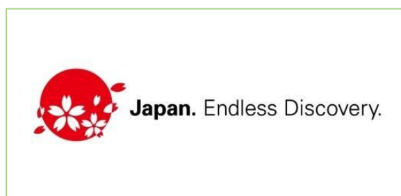
Slika 5. Logo JNTO-a

Bez obzira na veličinu, izgled ili složenost web stranice, svaki posjetitelj mora jasno razumjeti poziciju na tržištu. Jedinstvena izjava o marketinškom pozicioniranju tvrtke, proizvoda ili usluge mora biti jasno vidljiva. Upotreba slogana s nazivom tvrtke ili proizvoda kako bi pomoglo posjetiteljima da odmah utvrde ciljno tržište. Vrlo malo tvrtki ima tako snažan tržišni brend da je samo ime dovoljno za razumijevanje njegovog statusa (Cox i Koelzer, 2005, str. 65). JNTO kao web stranica namijenjena zainteresiranim putnicima prema Japanu ima brend i slogan koji je isključivo namijenjen traženoj publici. Kao jedna od vodećih agencija promidžbe Japana na pretežito međunarodnoj razini, sa svojim sloganom „ Japan. Endless Discovery. “ i popratnim logom crvenog kruga na bijeloj pozadini reprezentirajući zastavu Japana i njegovog statusa zemlje izlazećeg sunca kroz koju lete raspršene latice rascvjetalog trešnjinog cvijeta (slika 5.), također čestog simbola Japana i razlog zbog kojeg mnogi stranci najčešće i putuju u Japan za vrijeme proljeća, JNTO popunjava uvijete za jasno tržišno pozicioniranje brendinga.