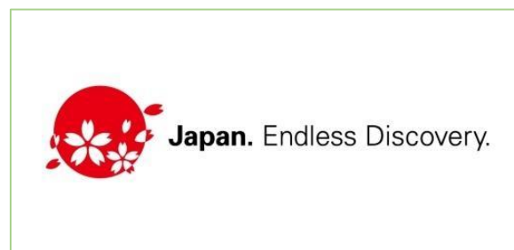
Slika 5. Logo JNTO-a

Bez obzira na veličinu, izgled ili složenost web stranice, svaki posjetitelj mora jasno razumjeti poziciju na tržištu. Jedinstvena izjava o marketinškom pozicioniranju tvrtke, proizvoda ili usluge mora biti jasno vidljiva. Upotreba slogana s nazivom tvrtke ili proizvoda kako bi pomoglo posjetiteljima da odmah utvrde ciljno tržište. Vrlo malo tvrtki ima tako snažan tržišni brend da je samo ime dovoljno za razumijevanje njegovog statusa (Cox i Koelzer, 2005, str. 65). JNTO kao web stranica namijenjena zainteresiranim putnicima prema Japanu ima brend i slogan koji je isključivo namijenjen traženoj publici. Kao jedna od vodećih agencija promidžbe Japana na pretežito međunarodnoj razini, sa svojim sloganom „ Japan. Endless Discovery. “ i popratnim logom crvenog kruga na bijeloj pozadini reprezentirajući zastavu Japana i njegovog statusa zemlje izlazećeg sunca kroz koju lete raspršene latice rascvjetalog trešnjinog cvijeta (slika 5.), također čestog simbola Japana i razlog zbog kojeg mnogi stranci najčešće i putuju u Japan za vrijeme proljeća, JNTO popunjava uvijete za jasno tržišno pozicioniranje brendinga.