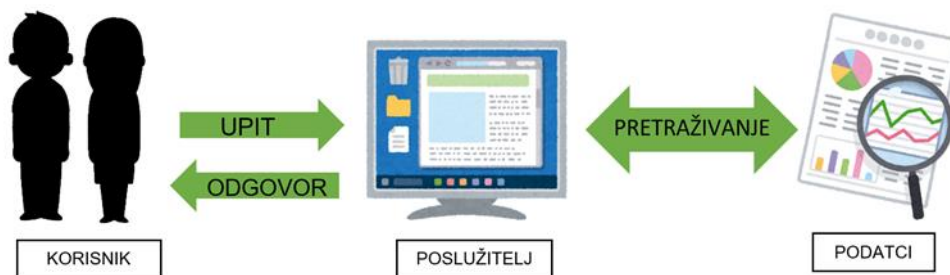
Slika 1. Odnos korisnika i poslužitelja