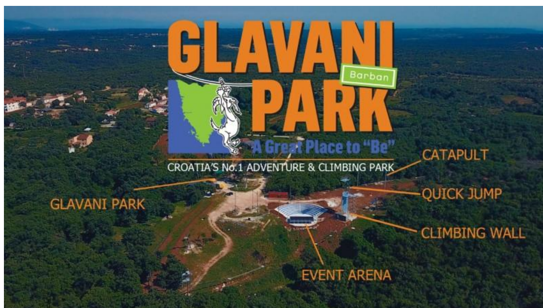
Slika 4. Glavani park