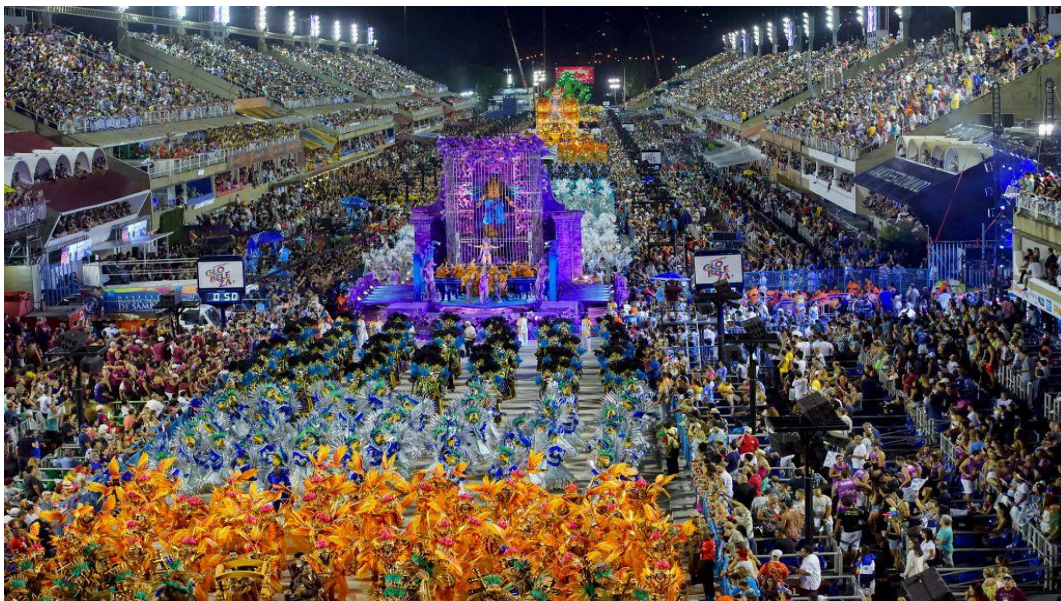
Slika 4. Parada na karnevalu u Rio de Janeiru

Ritam, sudjelovanje i kostimi razlikuju se od regije Brazila do regije. Poznati karneval u Rio de Janeiru održava ogromne organizirane parade kao na Slici 4 . Postoje službene parade koje su namijenjene gledanju javnosti, dok se manje parade, koje omogućuju sudjelovanje javnosti, mogu pronaći u manjim gradovima. To je šestodnevna zabava na kojoj mnoštvo prati tu paradu ulicama grada, plešući i pjevajući.