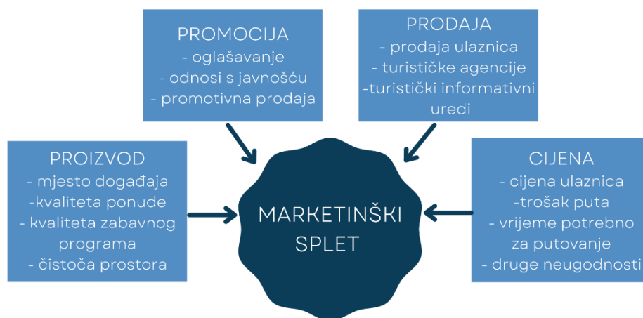
Slika 1. Marketinški splet manifestacija

Izradila autorica, prema izvoru: Čulić, E. (2017): Planiranje događaja sa posebnim osvrtom na marketing , Sveučilište u Puli, str. 16, dostupno na: https://zir.nsk.hr , pristupljeno 19.09.2021.