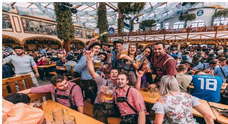
Slika 3. Proslava Oktoberfesta u jednom od pivskih šatora

Iduće godine utrka je kombinirana sa državnim poljoprivrednim sajmom, a 1818. godine uvedeni su štandovi koji poslužuju hranu i piće. Do kraja 20. stoljeća štandovi su se razvili u velike pivnice izrađene od šperploče kao što se može vidjeti na Slici 3 . Danas, svaki od minhenskih pivara podiže jednu od privremenih građevina s kapacitetom od oko 6000 sjedećih mjesta (Brittanica, 2021).