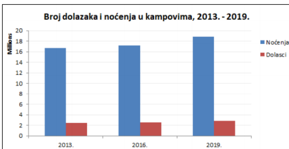
Slika 6. Broj dolazaka i noćenja u kampovima, 2013. - 2019.

Izvor: https://www.htz.hr/sites/default/files/2021-02/Kamping%20turizam%20Hrvatske%20-%20izdanje%202020_0.pdf (preuzeto 03. svibnja 2021.)