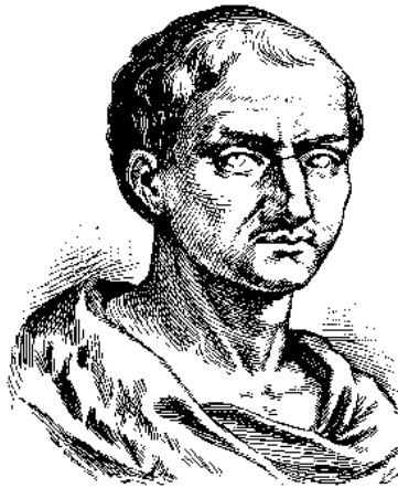
Prilog 2. Boetije (dostupno na: https://hr.wikipedia.org/wiki/Boetije )

Srednjovjekovni Zapad nastao je na ruševinama nekadašnjega rimskoga svijeta kao posljedica susreta i sukoba dvaju svjetova: rimskoga i germanskoga. Zahvaljujući Crkvi, Zapad se uspio podići iz ruševina jer je Crkva znala uspostaviti prilično dobar odnos s novim gospodarima Europe, izuzev Ostrogota, Vizigota i Vandala. S vjerom, Crkva im je donosila grčko-rimsku kulturu. Kršćanska kultura koja je bila pisana morala se nositi s mentalitetom novoga naroda – Germana. Njihova se kultura nije temeljila na pismu nego je bila usmena. Ti novi narodi ni filozofiju ni retoriku nisu doživljavali najvišim kulturnim vrednotama, nego samo etnos, krvno srodstvo i ratničku hrabrost. 9 Četvorica kršćanskih intelektualaca: Boetije, Kasiodor, Izidor Seviljski i Beda Venerabilis, kako ih literatura naziva ‘utemeljiteljima srednjega vijeka’, imali su potrebu stvarati novo ozračje i nove vrijednosti. Sva četvorica živjela su u prijelaznom razdoblju između antike, u čijim su školama stekli naobrazbu, te srednjega vijeka. Boetija je (480. - 526.), nakon što je u ranom djetinjstvu ostao bez oca, odgajao senator Aurelije Memije Simak. S 25 godina postao je senator, a pet godina kasnije i konzul. Namjeravao je na latinski jezik prevesti važnija djela grčkih filozofa, prije svega Platona i Aristotela, kako bi latinskoj mladeži učinio dostupnom kulturnu baštinu starih Grka. Njegovo djelo O utjesi filozofije kojega je napisao oko 523. smatra se glavnim filozofskim djelom. 10