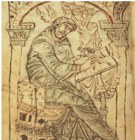
Prilog 5. Beda Venerabilis (dostupno na:

Beda Venerabilis (672. - 735.) govorio je sve važne jezike u ono vrijeme: grčki, latinski i hebrejski. Njegovo najvažnije djelo smatra se Engleska crkvena povijest koja osobito govori o procesu pokrštavanja otočnih naroda. Beda je odgojio nekoliko vrsnih učenika od koji se najviše ističe Bonifacije. 13