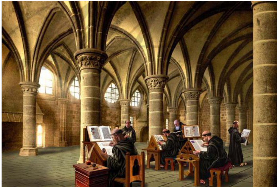
Prilog 11. Skriptorij (dostupno na: https://hr.erch2014.com/obrazovanje/88236-cto-takoe-skriptorij-istoriya-i-fakty.html )