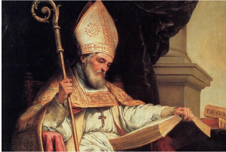
Prilog 4. Izidor Seviljski (dostupno na:

https://www.bitno.net/vjera/svetac-dana/sv-izidor-seviljski-zastitnik-korisnika-interneta/ )