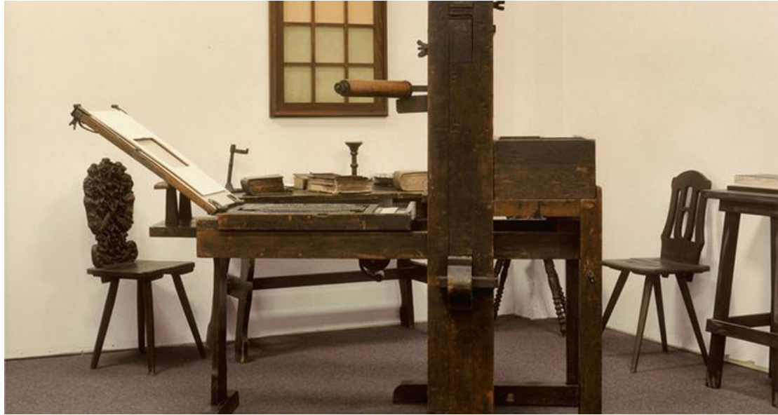
Prilog 12. Gutenbergov tisak (dostupno na: https://www.dw.com/hr/kolijevka-svjetske-pismenosti/a-15956951 )

grubljim slovima tiskao i neka manja djela: Fragmenat o sudu svijeta , Astronomski kalendar za 1448 , ali to se nije moglo dokazati. 60 Do Gutenbergova vremena samo su povlašteni mogli imati knjigu. Vrijednost knjige bila je velika, a primjer tomu je da je za rukom pisanu knjigu na pergameni trebalo izbrojati mnogo zlatnika ili se plaćala velikom količinom životinjske kože.