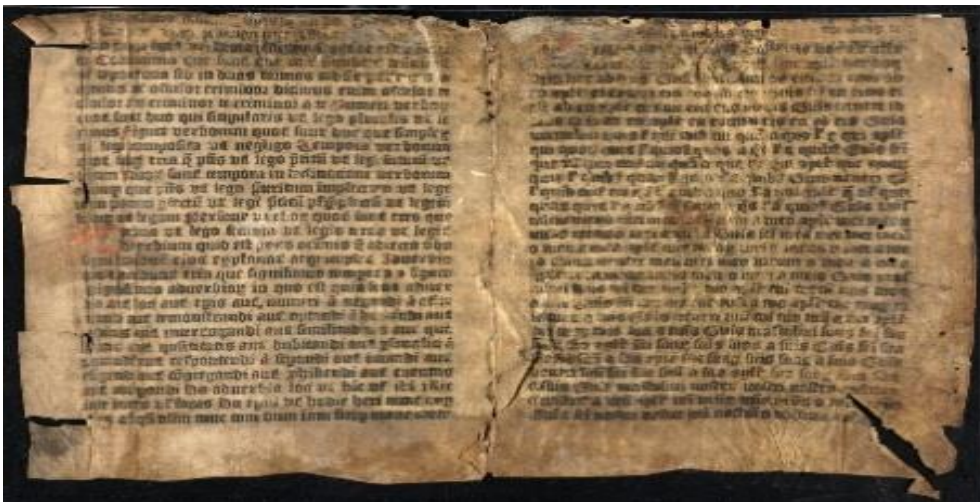
Prilog 7. Ars minor (dostupno na:

Ars minor napisan je u svega dvanaest stranica u suvremenom tiskanom izdanju te se sastoji od jednostavnih pitanja i odgovora te nekih konjugacija i deklinacija. U ranom srednjem vijeku bio je vrlo cijenjen te se upotrebljavao dugo vremena. Ars maior je analizirao morfologiju, sintaksu te stilistiku. 21