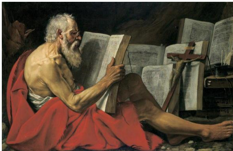
Prilog 6. Sveti Jeronim

Posebno mjesto u razvoju obrazovanja pripada i svetom Jeronimu (341./347 – 420.) koji pripada najznačajnijim autorima europske književnosti i kulture. Preveo je Bibliju na latinski (Vulgata) kao i brojne crkvene knjige na slavenski jezik. Pisao je pustinjačke hagiografije te brojne homilije i komentare, književna djela s autobiografskim podacima, zapise o ondašnjim događajima i ljudima, polemike i razmišljanja. 15