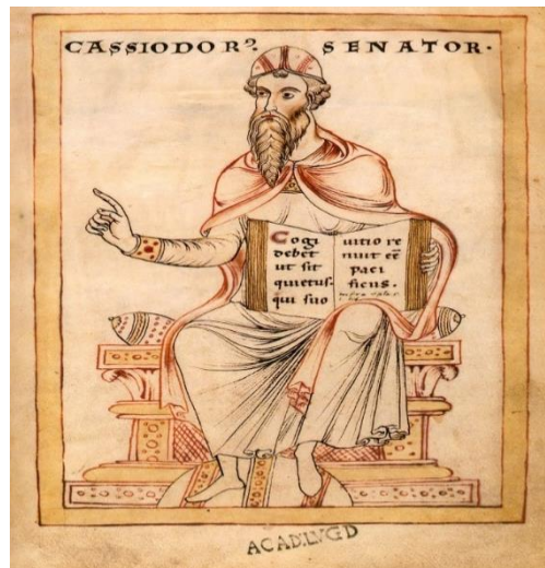
Prilog 3. Kasiodor (dostupno na: https://hr.wikipedia.org/wiki/Kasiodor )

samostan postao je pravi 'hram kulture' u kojemu je želio uskladiti antičku kulturu s kršćanskom. Kao opat izradio je Redovničko pravilo. Jedno od temeljnih stavki njegova Pravila sadržavalo je, između ostaloga, obvezu prepisivanja starih rukopisa. Bio je svjestan da ne živi u vremenu velikih misli i teorija te da iz antike treba spasiti sve što se može spasiti. U tu svrhu za svoje redovnike sastavio je priručnik latinskog pravopisa De orthographia u kojem navodi kako se ispravno prepisuju stari rukopisi. Njegova osobita zasluga je ta što je sustav sedam slobodnih umijeća postao temelj crkvenih i samostanskih škola. 11