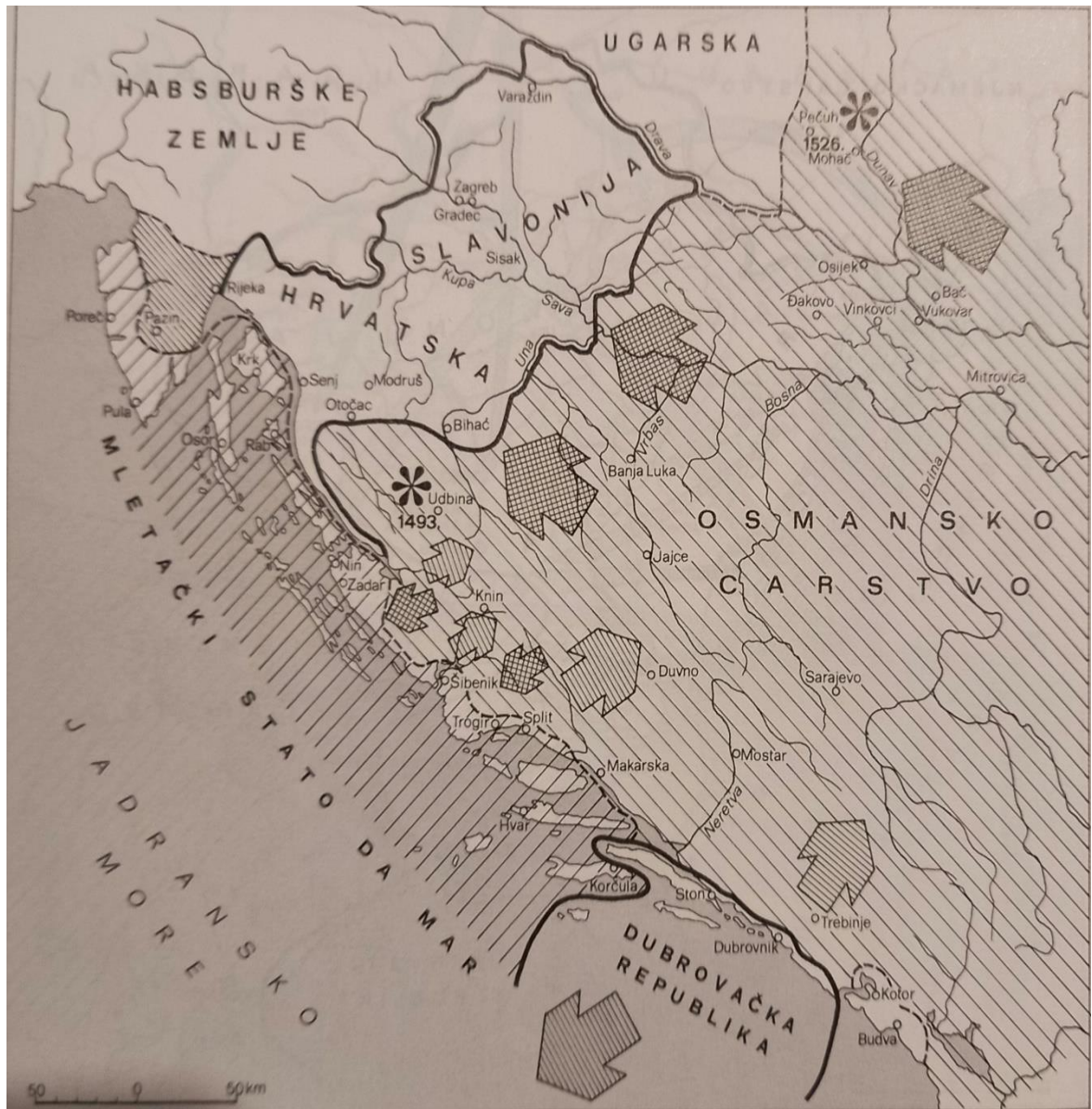
Prilog 6. Hrvatska nakon bitke na Mohačkom polju 1526.

kršćanstva ( Antemurale Christianitatis ). Knez Bernardin Frankapan je bio jedini plemić visokog ranga koji je uspio i preživjeti i izbjegnuti osmanlijsko sužanjstvo te je postao vrlo popularan i slavljen u Europi kao veliki kršćanski borac iz Hrvatske. 45