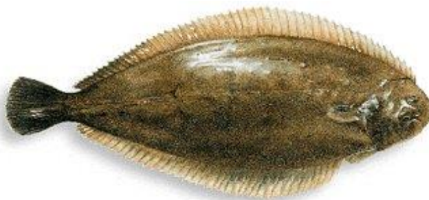
Slika 13. : List 13

List živi u jatima, ali raspršeno na morskom dnu te zato spada u životnu zajednicu bentosa. Najviše se seli noću za južnih olujnih vremena ili nakon njih. Aktivan je većinom noću, a danju se ukopava. Mrijesti se tijekom kasne jeseni i prve polovice zime kad s tri godine postigne spolnu zrelost tako što se iz obalnih krajeva seli na pučinu. Hrani se svim sitnim životinjama koje pronađe na morskom dnu. Ima dug životni vijek – od 12 do 15 godina. (Milišić, 2007.)