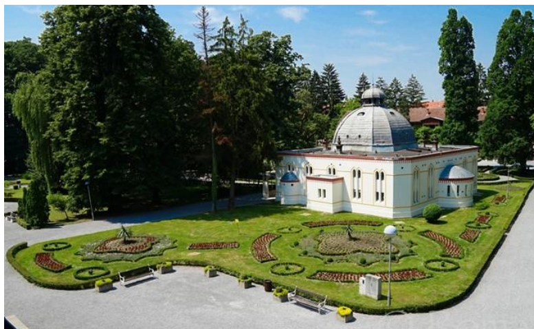
Slika 2: Antunova kupelj