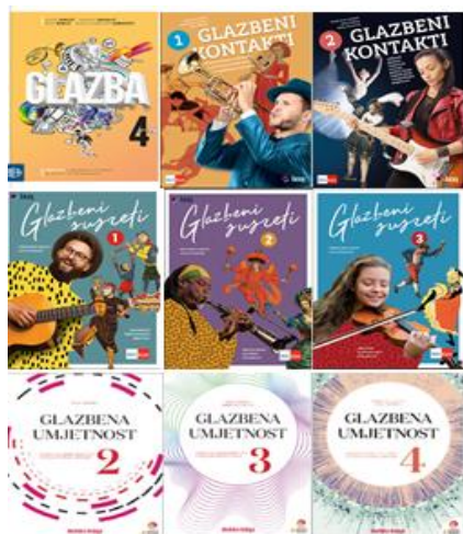
Slika br.4, Udžbenici za Glazbenu umjetnost 17