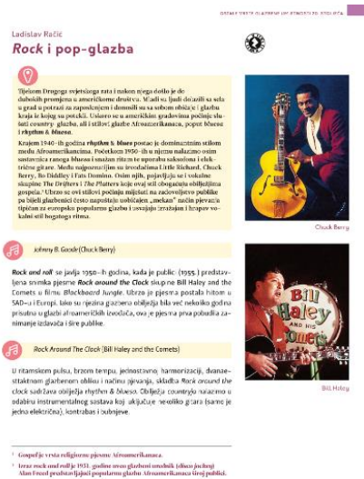
Slika br.3, Poglavlje iz udžbenika Glazbena umjetnost 4 (Školska knjiga) 16

Udžbenici za Glazbenu umjetnost (u četvrtom razredu) sadrže poglavlja posvećena popularnoj glazbi. Osim povijesnog presjeka popularne glazbe, udžbenici sadrže prijedloge za slušanje te osmišljena pitanja, zadatke i dodatne aktivnosti. Svojevrсна problematika su gimnazijski programi, po kojima je obrada popularne glazbe predviđena za kraj četvrtog razreda, koje za učenike maturante predstavlja stresno razdoblje pred maturu.