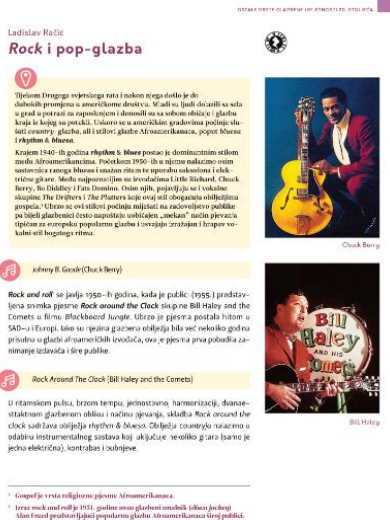
Slika br.3, Poglavlje iz udžbenika Glazbena umjetnost 4 (Školska knjiga) 16

Udžbenici za Glazbenu umjetnost (u četvrtom razredu) sadrže poglavlja posvećena popularnoj glazbi. Osim povijesnog presjeka popularne glazbe, udžbenici sadrže prijedloge za slušanje te osmišljena pitanja, zadatke i dodatne aktivnosti. Svojevrсна problematika su gimnazijski programi, po kojima je obrada popularne glazbe predviđena za kraj četvrtog razreda, koje za učenike maturante predstavlja stresno razdoblje pred maturu.