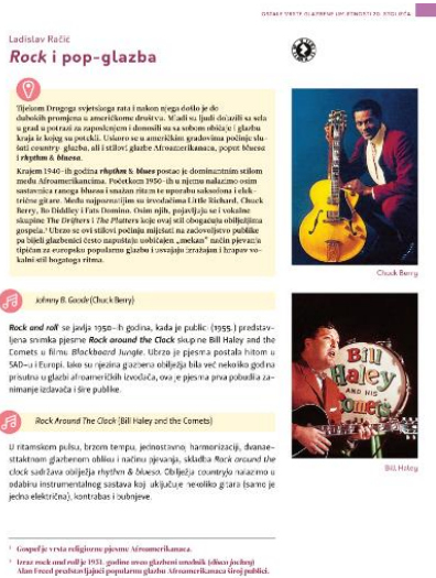
Slika br.3, Poglavlje iz udžbenika Glazbena umjetnost 4 (Školska knjiga) 16

Udžbenici za Glazbenu umjetnost (u četvrtom razredu) sadrže poglavlja posvećena popularnoj glazbi. Osim povijesnog presjeka popularne glazbe, udžbenici sadrže prijedloge za slušanje te osmišljena pitanja, zadatke i dodatne aktivnosti. Svojevrsna problematika su gimnazijski programi, po kojima je obrada popularne glazbe predviđena za kraj četvrtog razreda, koje za učenike maturante predstavlja stresno razdoblje pred maturu.