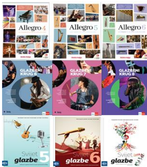
Slika br.2, Udžbenici za Glazbenu kulturu 15