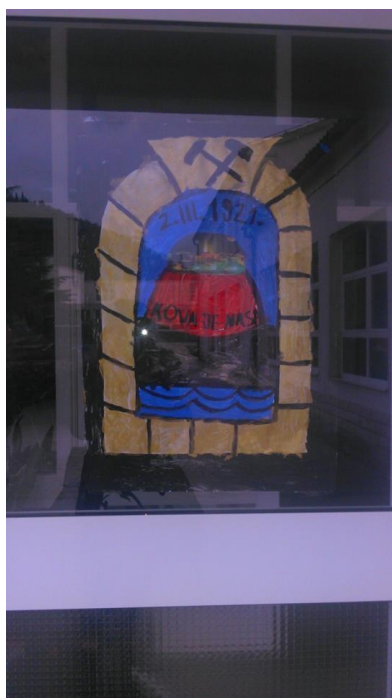
Izvor: Autorica rada, fotografirano u travnju 2016.

Slika 1. Plakat s radionice „Rudarstvo“ Slika 2. Posjet glavnom rudarskom „šohu“