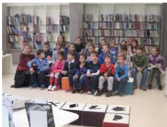
Slika 6: Djeca u posjetu gradskoj knjižnici