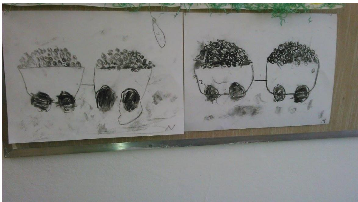
Autorica rada, fotografirano u travnju 2016.