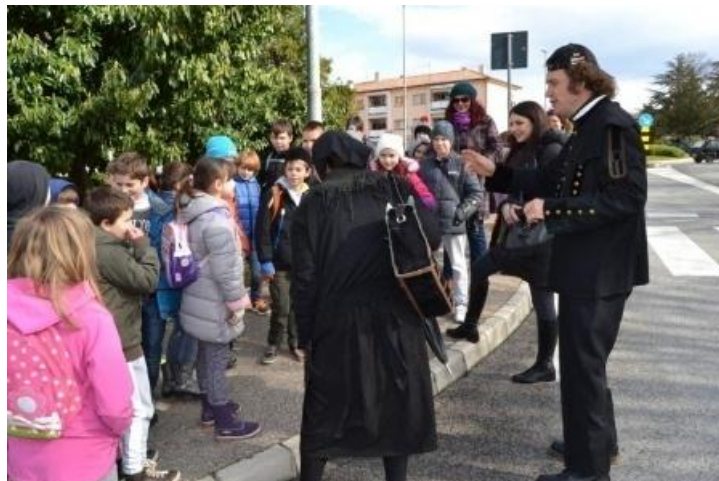
Slika 5: Dramska predstava za najmlađe

Osim vrtića, u razne aktivnosti uključuju se i učenici nižih razreda labinskih osnovnih škola. 2. ožujka 2016. godine, povodom 95. obljetnice Labinske republike, učenici trećeg razreda dvaju labinskih osnovnih škola (OŠ „Ivo Lola Ribar“ i OŠ „Matije Vlačića“) u sklopu zavičajne nastave, posjetili su Gradski muzej u kojemu je smješten dio adaptiranog rudnika. I oni su, poput vrtićke djece, posjetili Lamparnu, međutim Labinom su ih na zanimljiv i uzbudljiv način kroz razne priče i legende vodili članovi udruge „Istria inspirit“, odnosno dvoje glumaca koji su na zanimljiv i zabavan način ispričali razne zanimljivosti iz labinske povijesti. Glumci „Istria inspirit“, utjelovili su likove none Ane i njezina unuka Alena koji je bio odjeven u rudarsku uniformu te su djeca „iz prve ruke“ mogla vidjeti i upoznati se sa rudarskom uniformom te rudarskim alatom koji je nosio glumac glumivši rudara Alena. Organizator ove zanimljive zavičajne nastave bio je Grad Labin. (Osnovna škola „Ivo Lola Ribar“ Labin, 2016: nije paginirano, 20. 03. 2016. )