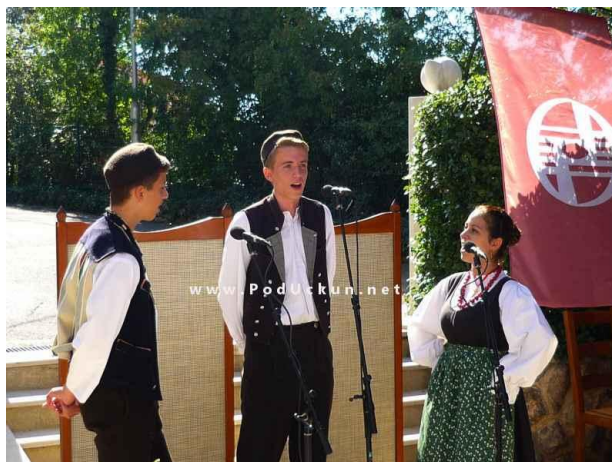
Slika 8: Pjevanje na „tonko i debelo“