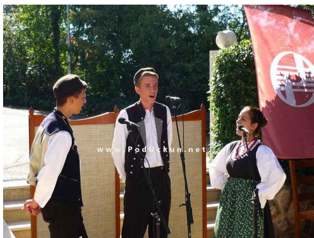
Slika 8: Pjevanje na „tonko i debelo“