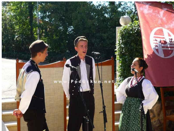
Slika 8: Pjevanje na „tonko i debelo“