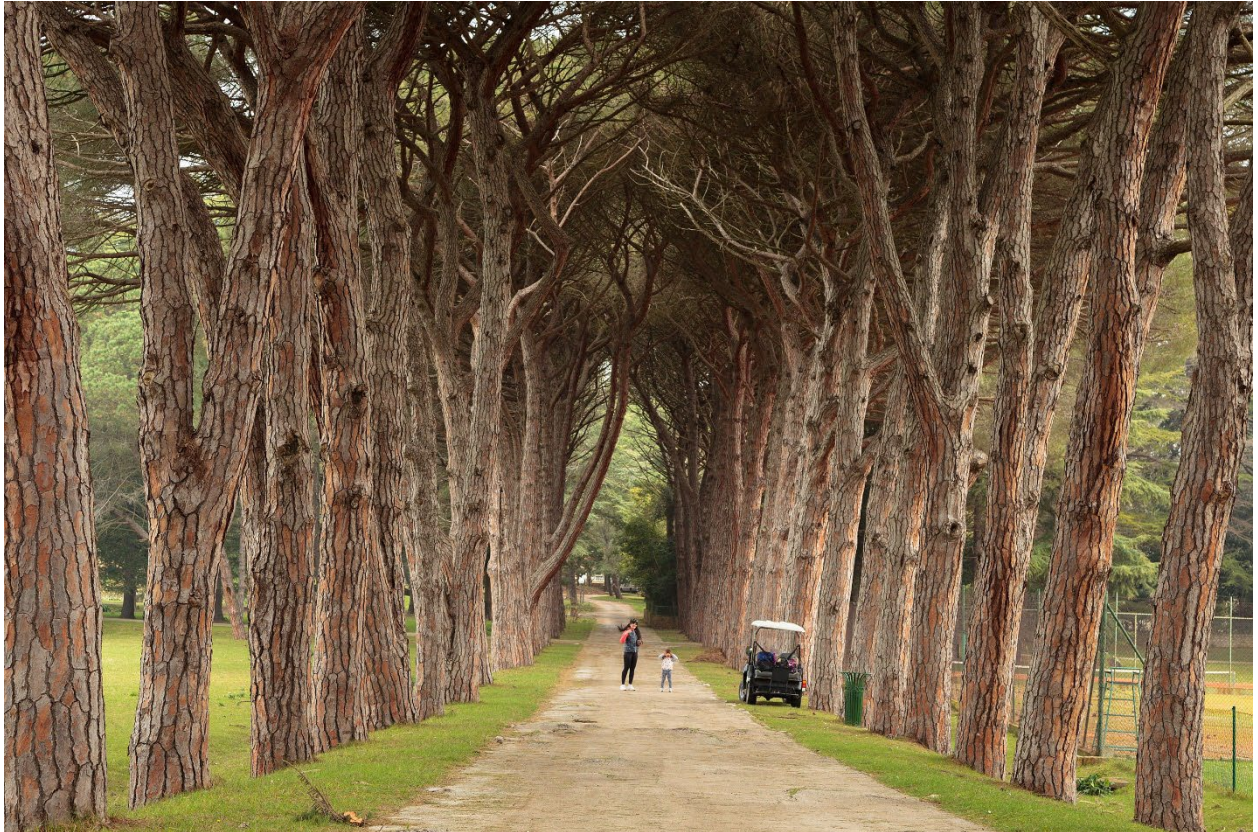
Slika 4.: Drvored borova na Brijunima