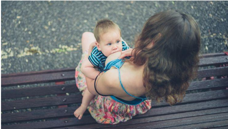
Slika 9. Dojenje u uspravnom položaju

Uspravan položaj koristi se prilikom snažnog refleksa otpuštanja mlijeka, kod upale nosa, uha te kod rascjepa usne i /ili nepca.