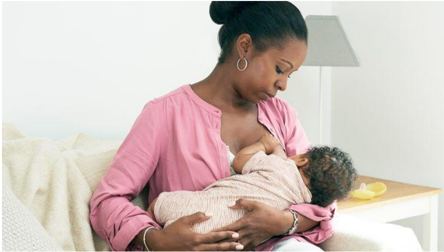
Slika 7. Dojenje u položaju koljevke

Položaj koljevke najčešće je korišten položaj prilikom dojenja. Najbolje je položaj koljevke koristiti u širokom naslonjaču, koristeći potporu jastucima.