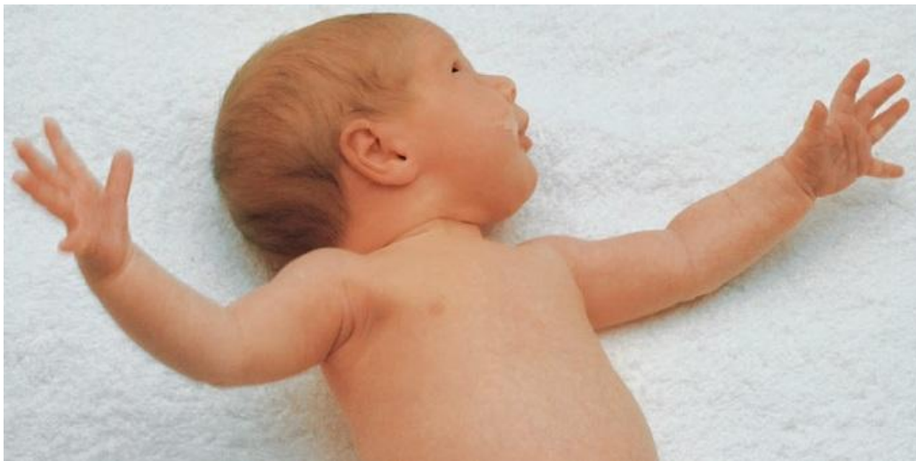
Slika 1. Moroov refleks

Refleks obuhvaćanja ili Moroov refleks karakterizira kontrakcija mišića cijelog tijela. Refleks nastaje pri nagloj promjeni položaja djeteta ili kao reakcija na jaki podražaj poput zvuka, svjetla, udarca o podlogu na kojoj leži. Refleks možemo ispitati da se dijete položi na leđa, primi za ručice, malo podigne i spusti. Tada dijete napravi ekstenziju i fleksiju (Močenić, 2017). Novorođenče naglo i simetrično raširi ruke, a glavu lagano zabaci prema natrag. Refleks nestaje nakon trećeg ili četvrtog mjeseca. Ukoliko nije moguće tijekom prvih nekoliko dana izazvati refleks obuhvaćanja moguće je intrakranijalno oštećenje. Izostanak refleksa na jednoj strani može uputiti na frakturu ključne kosti, iščašenja ili ozljede perifernih živaca ili ozljede mozga na suprotnoj strani (Ilić, Ivasić i Malčić, 2014).