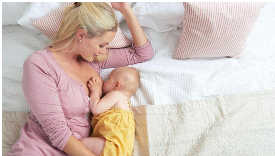
Slika 6. Dojenje u ležećem položaju

Ležeći položaj preporučuje se u prvim danima nakon poroda, iza carskog reza, kod bolnog reza međice, te prilikom noćnih podoja.