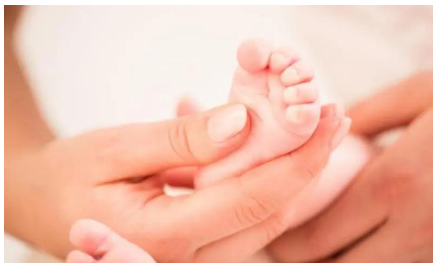
Slika 3. Robinsonov refleks podraživanja stopala