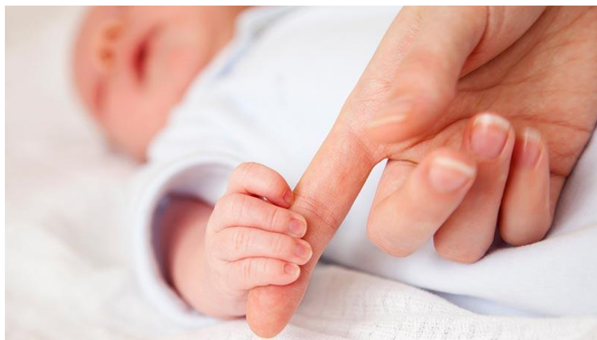
Slika 2. Robinsonov refleks podraživanja dlana

Robinsonov refleks možemo izazvati podraživanjem dlana ili stopala novorođenčeta. Nakon podraživanja dlana, novorođenče zatvara šaku i hvata predmet. Nakon drugog do četvrtog mjeseca refleks nestaje. Do izazivanja refleksa hvatanja tabanima dolazi prislanjanjem predmeta na taban, što izaziva plantarnu fleksiju nožnih prstiju. Refleks hvatanja tabanima traje do prve godine (Močenić, 2017).