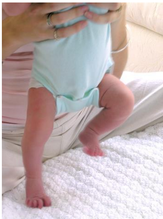
Slika 5. Refleks automatskog hoda