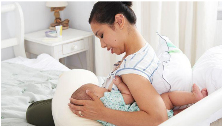
Slika 8. Dojenje u položaju nogometne lopte

Hvat „nogometne“ lopte pogodan je za dojenje blizanaca, kod prijevremeno rođenih male tjelesne težine, kod neuroloških poteškoća (hipotonija), kod učenja tehnike dojenja, kod zastoje dojke, bolnih i oštećenih bradavica.