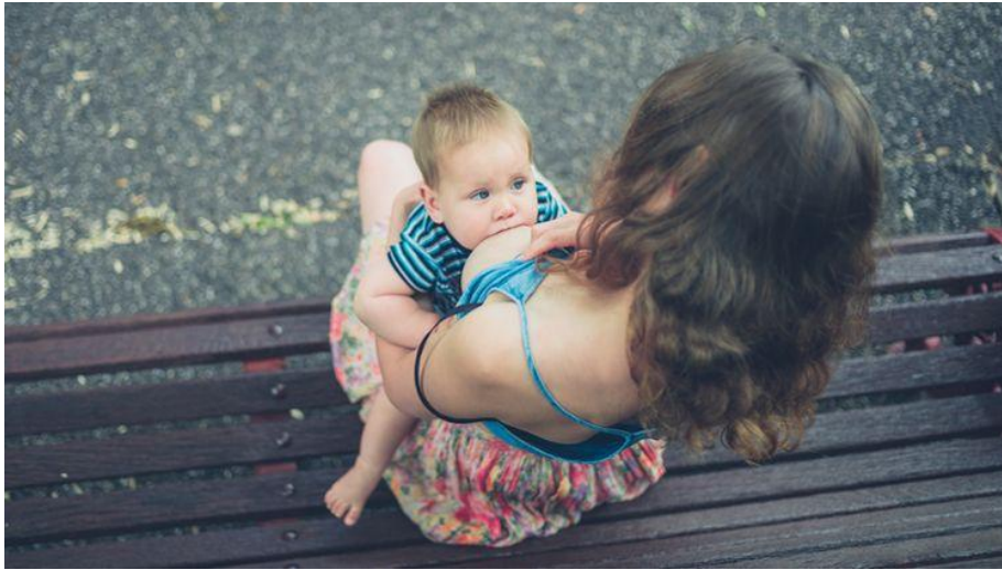
Slika 9. Dojenje u uspravnom položaju

Uspravan položaj koristi se prilikom snažnog refleksa otpuštanja mlijeka, kod upale nosa, uha te kod rascjepa usne i /ili nepca.