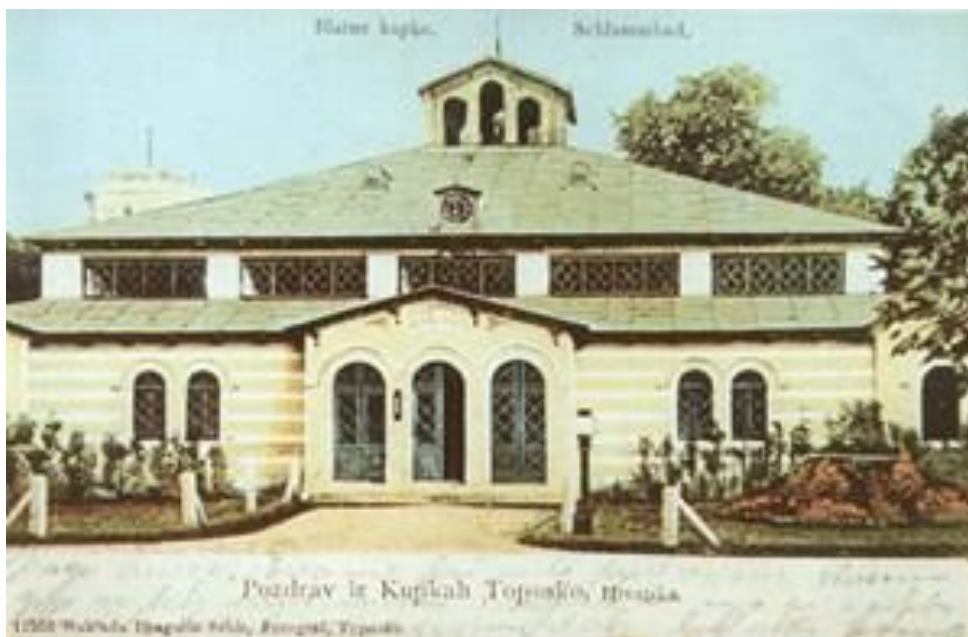
Slika 5. Razglednica iz Topuskog