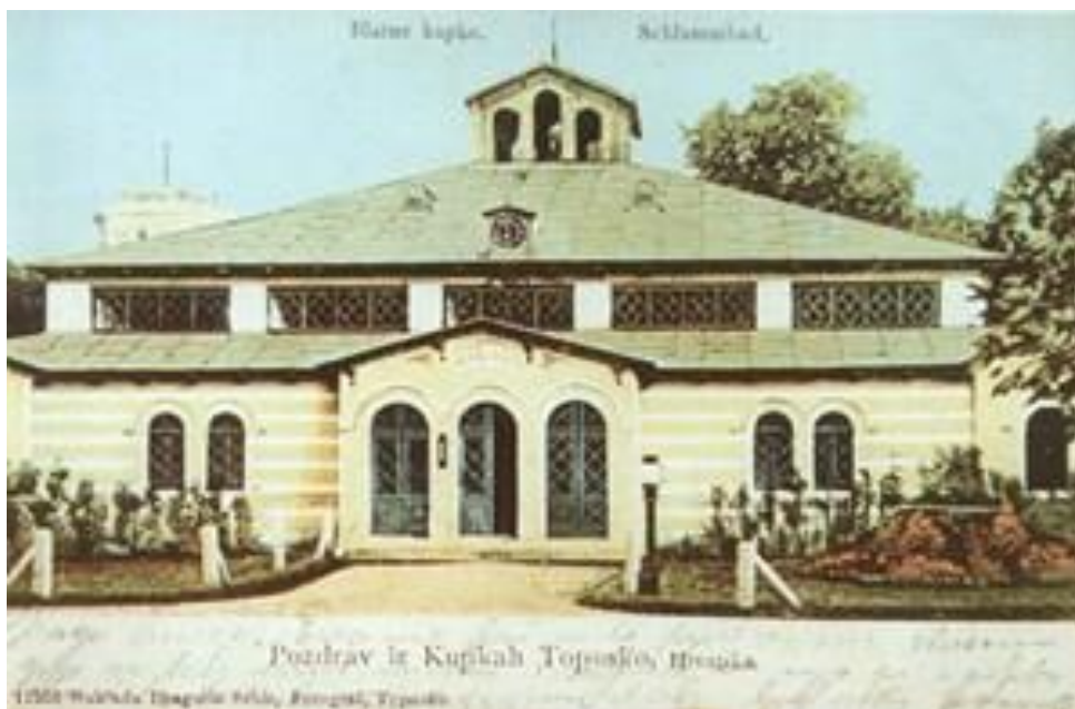
Slika 5. Razglednica iz Topuskog