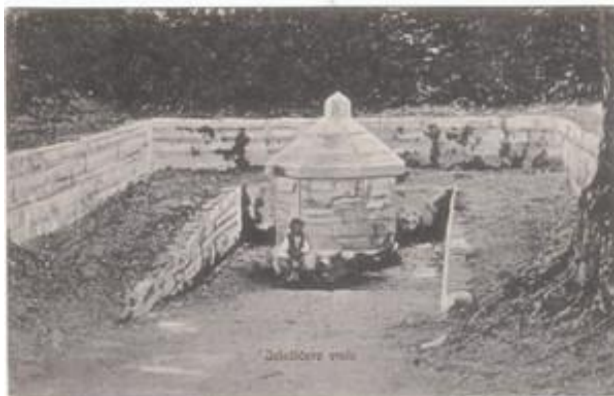
Slika 3. Jelačićevo vrelo

novi razvoj naselja temeljenog na korištenju termalne vode u medicinske svrhe. 32 Francuzi su za kratkog vremena svoje vladavine od 1809. do 1813. nastavili s uređenjem kupki. Franjo I., austrijski i rimsko-njemački car 24. lipnja 1818. posjećuje Topusko i daje lječilištu glavni poticaj odnosno sredstva bečkog dvora iz blagajne Državnog ratnog vijeća u Beču za izgradnju lječilišta te sredinom 19. stoljeća Topusko postaje jedno od najpoznatijih lječilišnih destinacija u Habsburškoj Monarhiji. 33 Medicinska akademija u Beču 1826. potvrđuje ljekovita svojstva vode u Topuskom te mu daju status ljekovitih voda. Koristili su se bazeni i kaptaže iz rimskih vremena, a kupalište se počelo razvijati oko izvora u Spiegelbadu. Sredinom 19. stoljeća raste interes za blatne kupke pa se središte mjesta seli na današnji položaj te se ondje razvijaju novi i veći kapaciteti. Topusko je svoj procvat doživio tijekom Vojne krajine kada je lječilište dobilo novoizgrađene zgrade za smještaj gostiju. Izgrađen je dom I., dom II., blatne kupke, vojne kupke, bistre kupke i lječilišna restauracija. Paralelno s ovom izgradnjom uređene su parkovi, šetnice i vrela. Uređen je park Opatovina s portalom crkve Blažene Djevice Marije te Jelačić vrelo u Velikoj Vranovini, Benkovo vrelo u Hrvatskom selu i Mollinaryjevo vrelo u Topuskom. 34 Jelačićevo vrelo prikazano je na slici broj 3.