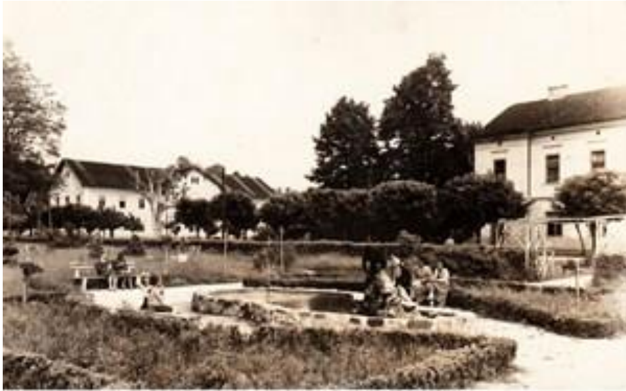
Slika 4. Lječilište Topusko početkom 20. stoljeća

Na prijelazu u 20. stoljeće lječilište Topusko doseže svoj najkvalitetniji urbanistički izgled koji možemo vidjeti na slici broj 4.