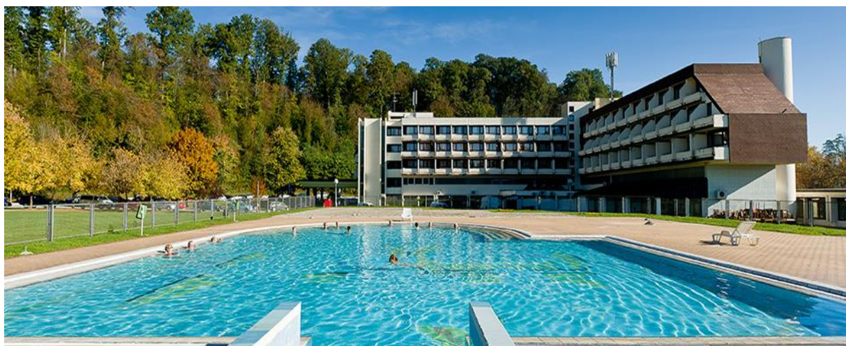
Slika 2. Lječilište Topusko

Lječilište Topusko smješteno je u Sisačko-moslavačkoj županiji. To je lječilište i termalno kupalište koje ima više izvora hipertermalne, mineralne (magnezij, kalcij, hidrokarbonat, sulfat) i slabo radioaktivne vode. Topusko je posebno zanimljivo jer ima cretne naslage treseta-ljekovitog blata koje se primjenjuje u blatnim kupkama. Lječilište u Topuskome je jedino cretno lječilište u Republici Hrvatskoj i jedno od rijetkih u Europi. U bistrom izvoru je prilikom čišćenja kaptaze pronađena veća količina rimskog novca koji je tu vjerojatno dospio kao dar božanstvima u znak zahvalnosti za ozdravljenje. 31 Nalazi iz eneolitika i željeznog doba potvrđuju ranu nastanjenost područja Lječilišta Topusko, o tome će biti više riječi u sljedećem poglavlju. Na slici broj 2 prikazano je Lječilište Topusko.