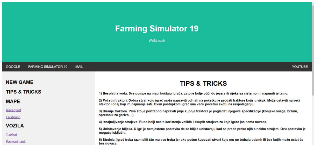
Slika 10. Početna stranica