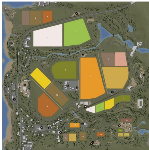
Slika 12. Prikaz mape Ravenport

Mapa je napravljena prema američkom stilu gradnje. Smještena je u jugozapadni dio Sjedinjenih Američkih Država u južnu Kaliforniju. Ravenport se nalazi na ravnici te sadrži nekoliko velikih polja i nekoliko malih. Mapu možemo vidjeti na Slici 12. ispod.