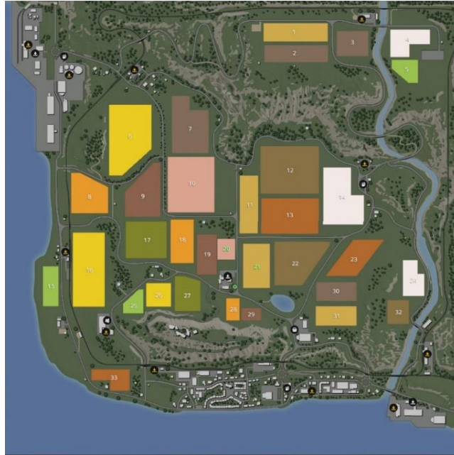
Slika 11. Prikaz mape Felsbrunn