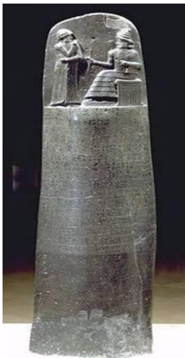
Slika 2. Hamurabijev zakonik.