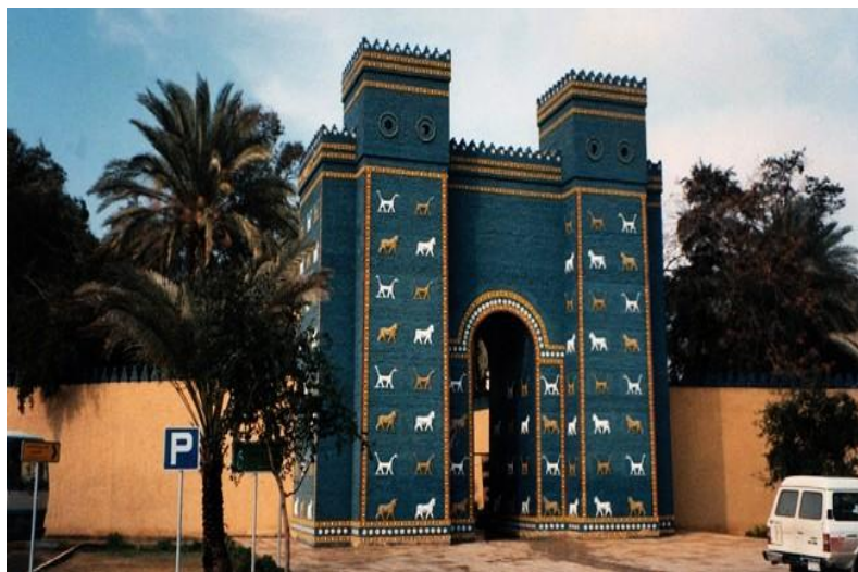
Slika 5. Ištarina vrata.

Osim figura bikova i zmajeva, vrata su u svojoj posljednjoj fazi imale ukrasne trake s motivom bijelih rozeta i po dva reda žuto obojanih i jedni redom crnih bijelih i žutih opeka iznad i ispod njih. U ruševinama Ištarinih vrata nađeno je 15 fragmenata glinenih valjaka sa zapisima o njihovoj gradnji i obnovi i to četrnaest Nebukadnezarovih i jedan Nabonidov. Krovni vijenac Ištarinih vrata sastojao se od zupčasto poredanih caklinskih opeka. 48