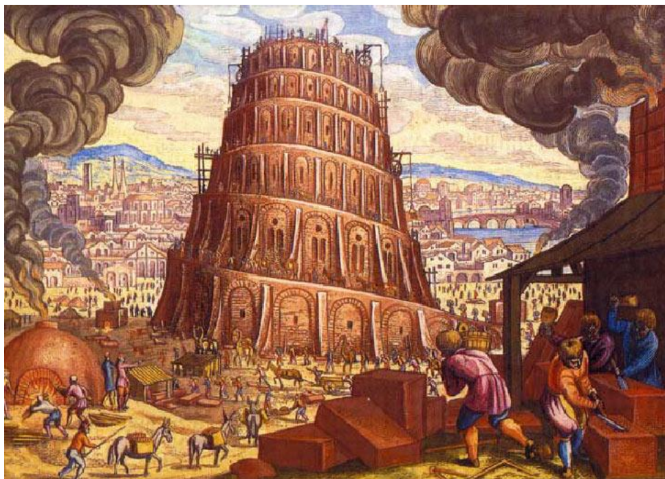
Slika 6. Babilonska kula.