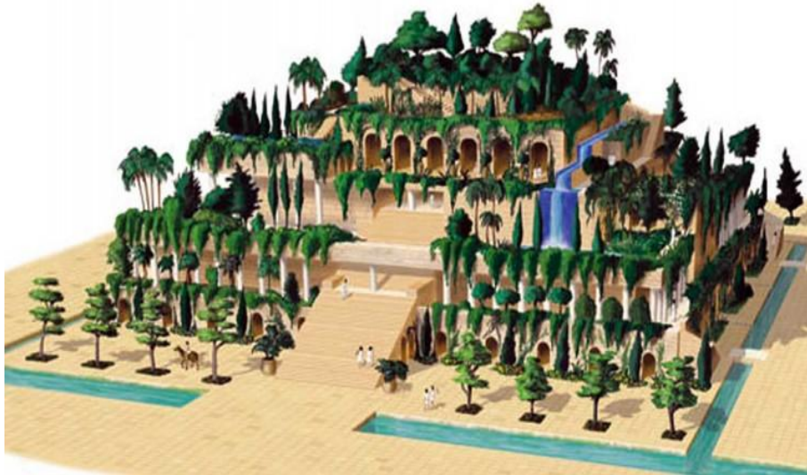
Slika 3. Babilonski viseći vrtovi.

Nakon Nebukadnezarove smrti, perzijski kralj Kir je zauzeo Malu Aziju i opkolio babilonsku državu sa svih strana. Na Iranskom visočju se uzdigla perzijska država. Kralj Kir je uništio babilonsku vojsku. Naime, Babilonci su bili svjesni da je Perzija jaka država i da im je bolje da budu s njome u dobrim odnosima zbog trgovine. Jedne večeri babilonska je vojska bila pozvana na svečanost i u gradu su ostali samo svećenici i trgovci. Kralj Kir je bez problema ušao na otvorena vrata kroz gradske zidine u Babilon i zbog vlastitih interesa svećenici su mu ga predali bez ikakve borbe. 26