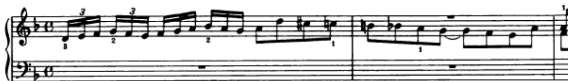
Slika 4.1.1. Tema u altu

Fuga započinje izlaganjem teme u altu. Tema traje dva takta te se sastoji od dva motiva. Najprije kreće uzlaznim motivom u triolama, a zatim slijedi skok od kvarte koji „razdvaja“ temu na dva dijela, nakon čega slijedi silazna melodijska linija koja se kreće u kromatskim pomacima (Slika 4.1.1.). Ova tema sama po sebi iziskuje određenu dinamiku, a ona podrazumijeva crescendo u prvom dijelu teme kod triola, sve do d2 što je svakako vrhunac ove teme kako u melodijskom, tako i u tematskom pogledu. Nakon toga slijedi decrescendo prema kraju teme. Što se tiče artikulacije, šesnaestinke u triolama se izvode quasi legato , mala interpretativna stanka kod skoka kvarte a1-d2, a zatim se osminke u silaznoj melodijskoj liniji sviraju legato . Naravno, tema se svira na ovaj način prilikom svakog njenog nastupa te treba paziti da svaki put bude jasno uočljiva, precizno izvedena i u prvom planu.