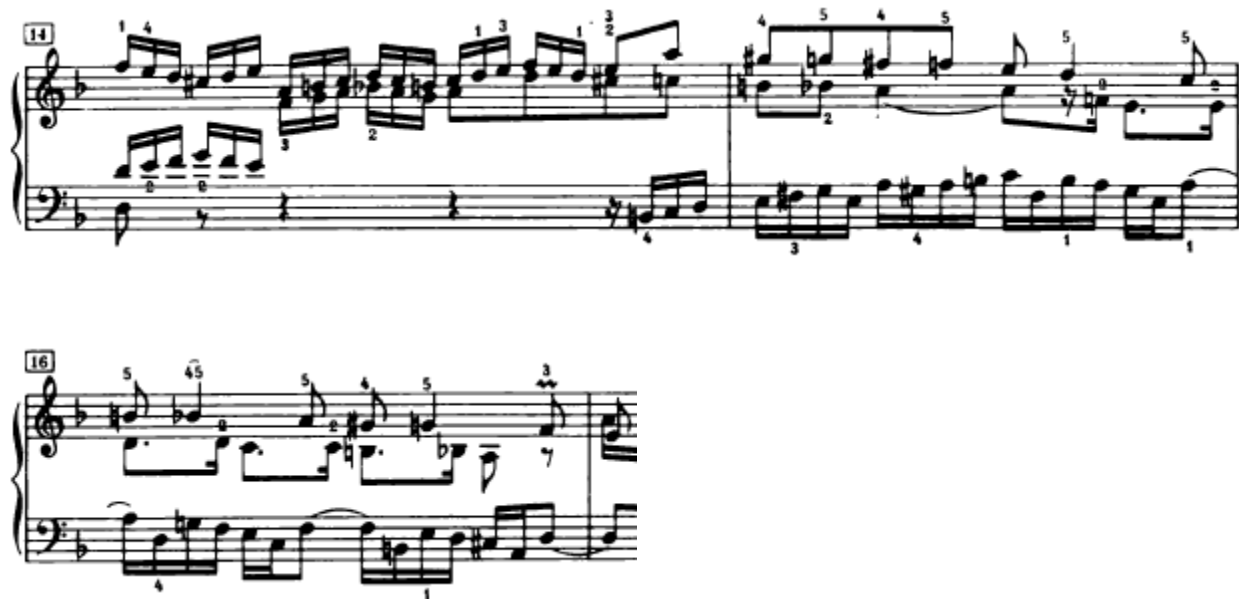
Slika 4.1.9. Tema i odgovor u streti

Nakon ovog međustavka slijedi tema u altu, u osnovnom tonalitetu (14. takt). Odmah na drugoj dobi istog takta slijedi odgovor u streti u sopranu, u a-molu (Slika 4.1.9.). Ova streta je dosta jasnija od one prve, iako su i ovdje teme nepotpune. Za ovo vrijeme u tenoru se javlja kontrastsubjekt (14. – 16. takt). U codetti (16. – 17. takt) se odvija modulacija iz a-mola u d-mol (Slika 4.1.9.).