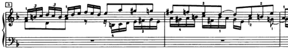
Slika 4.1.2. Realni odgovor u sopranu

Nakon izlaganja teme u altu slijedi realni odgovor u sopranu, u 3. taktu (Slika 4.1.2.). Za to vrijeme u altu se javlja kontrasubjekt, koji će se ponavljati i u daljnjem tijeku fuge, ali najčešće u nepotpunom ili promijenjenom obliku. Ovdje treba obratiti pozornost na početak dionice soprana u desnoj ruci. Prvi ton je a 1 , koji je ujedno i posljednji ton na kraju drugog takta, u lijevoj ruci. Od velike je važnosti da ovdje ne dođe do prekida odnosno pauze u melodijskoj liniji. Ovo će se postići na način da se zadnji ton u lijevoj ruci izdrži do zadnjeg trenutka, a prvi ton u desnoj ruci odsvira odmah nakon završetka trajanja prethodnog tona.