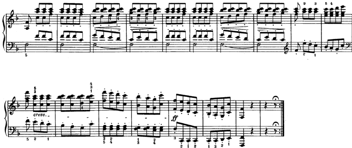
Slika 4.2.12. Završetak stavka

Slijedi ponavljanje druge teme u variranom i proširenom obliku, što u ovom slučaju čini kratku codu na završetku stavka (F-dur) (Slika 4.2.12.).