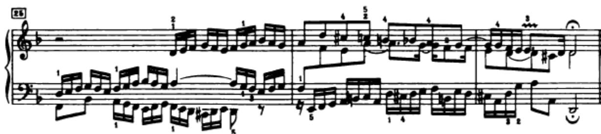
Slika 4.1.16. Završni dio fuge

Završni dio fuge traje samo tri takta (Slika 4.1.16.). Ovaj završni dio započinje izlaganjem teme u altu u osnovnom tonalitetu (d-mol). I ovdje je tema nepotpuna odnosno javlja se samo prvi dio teme, a za to vrijeme se u tenoru javlja taj isti prvi dio teme ali u inverziji. I u ovom završnom dijelu fuge javlja se tema u streti . Nakon što je alt donio ovaj prvi dio teme, slijedi nastup teme u sopranu, iako se tako zvučno ne čini – također u nepotpunom obliku. Za ovo vrijeme tenor ima liniju kontrasubjekta, također izmijenjenu (26. – 27. takt). Triler u zadnjem taktu nerijetko se javlja u završetcima Bachovih skladbi. Izvodi se od gornje note, a šesnaestinka nakon trilera se svira kraće od same njene vrijednosti, odvojeno od trilera koji joj prethodi.