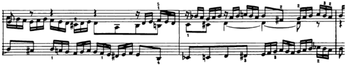
Slika 4.1.13. Inverzirana tema u stretti

Slijedi vrlo zanimljiv nastup teme u streti (17. – 18. takt). U 17. taktu u altu se javlja odgovor u inverziji, a zatim opet odmah s početkom na drugoj dobi imamo stretu , gdje tenor donosi temu također u inverziji (Slika 4.1.13.). Ovdje se odvija modulacija iz d-mola u g-mol.