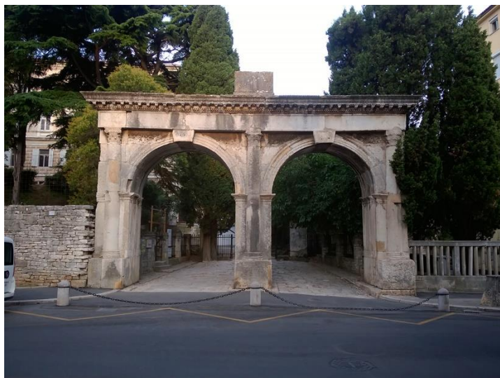
Slika 2: Dvojna vrata