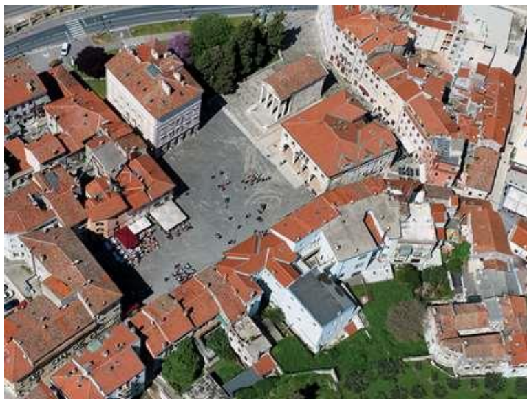
Slika 1: Augustov hram i forum