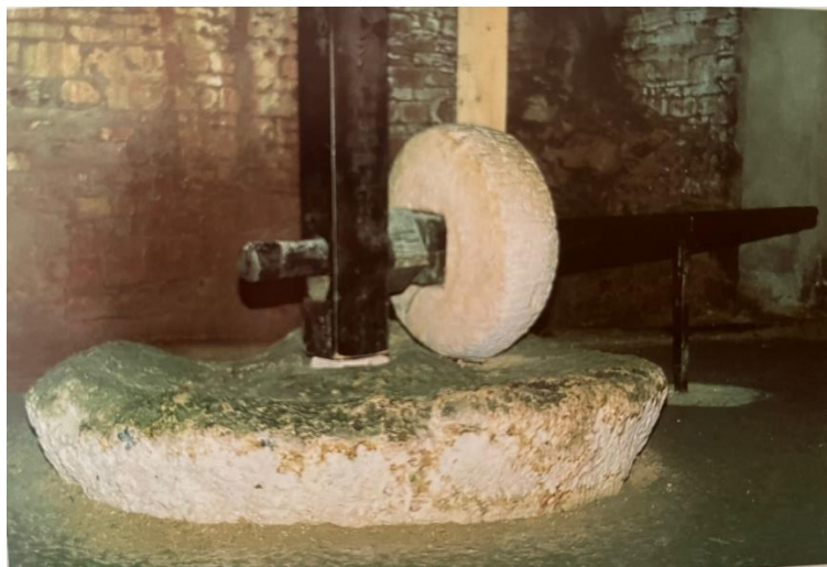
Slika 6: Rekonstrukcija antičkih mlinova na izložbi u Areni