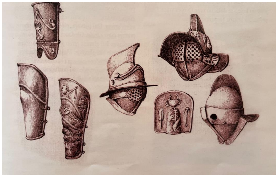
Slika 4: Dio opreme rimskih gladijatora

Izvor: Spomenici pričaju , str. 29. (fotografirao autor rada 20. srpnja 2022., ilustrirali učenici škole primijenjene umjetnosti Pula)