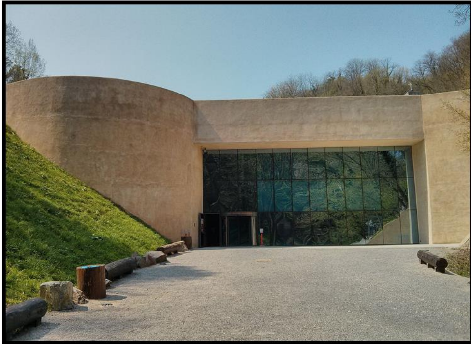
Slika 4. Muzej krapinskih neandertalaca „Kraneamus“

prošloga stoljeća u zgradi nekadašnjeg Kneippovog lječilišta osnovan je Muzej evolucije čiji je stalni postav osmislio M. Malez. Onodobni muzej, prema mišljenju Jakova Radovčića i Željka Kovačića, nikad nije pružao dovoljan uvid u širi kontekst i pravo značenje toga svjetskog lokaliteta. 49