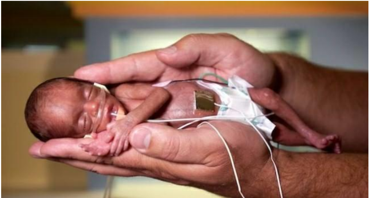
Slika 1. Nedonošče