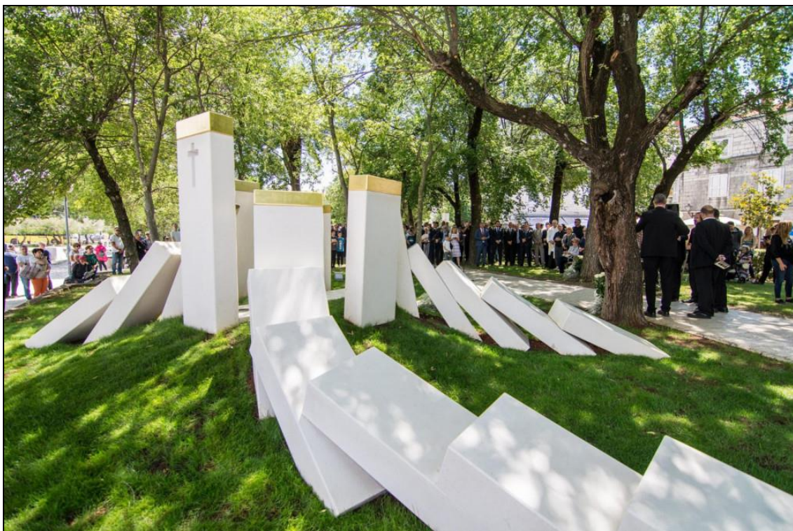
Slika 12. Spomen-obilježje Trogirska kruna