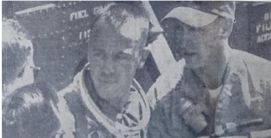
Slika 10 Fotografija Alana Shepada nakon leta

kojeg je na gornjem djelu stranice nastavljeno s informiranjem čitatelja o letu. Urednik u tekstu citira Washington koji tvrdi da je to povijesna prekretnica u „američkim naporima za istraživanje svemira“. 181 Ovdje je veći fokus na mišljenjima samih Amerikanaca o letu, radije nego o mišljenjima stranih novina kao što je to u slučaju Vostoka 1.