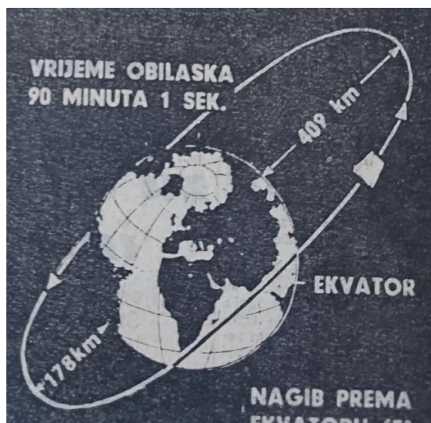
Slika 7 Prikaz obilaska Zemlje (Vjesnik, 1964)

Skepticizam koji je postojao oko leta Sputnika 2 u potpunosti je ovoga puta zamijenjen euforijom i slavom sovjetskog svemirskog programa. Ako je i postojalo različitih razmišlja, ovdje ona nisu objavljena. Osim što hvale program, imaju i izrazito optimističnu viziju budućnosti unatoč tome što su detaljne informacije Sovjeti uvijek zadržavali za sebe.