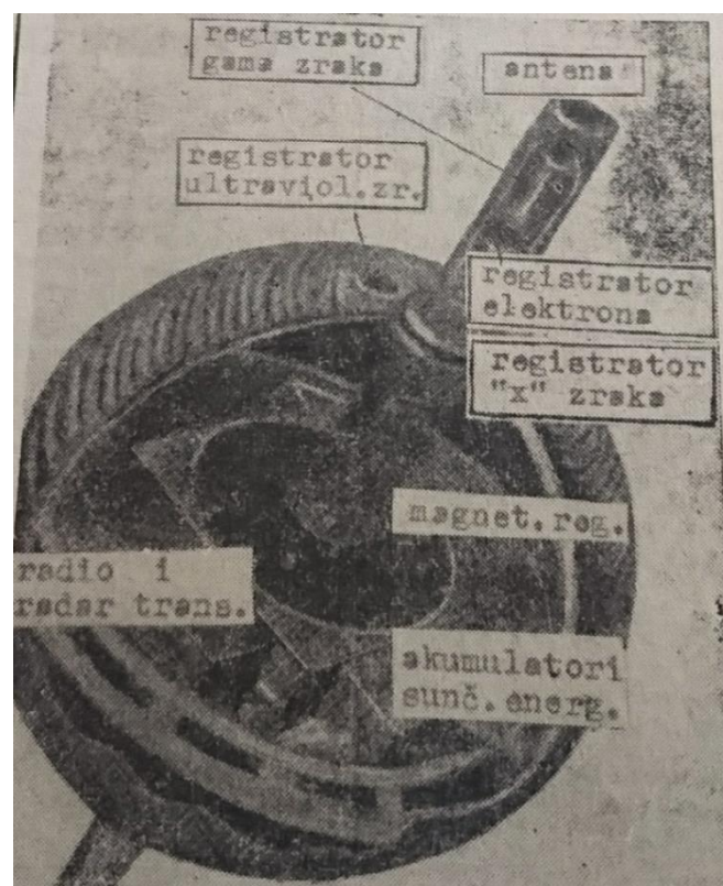
Slika 2 Presjek umjetnog Zemljinog satelita ( Slobodna Dalmacija , 1957)

usmjerili na tehnički aspekt satelita, navodeći njegove karakteristike. Sputnika nazivaju samo riječima „umjetni satelit“. Može se primijetiti kako su novine neutralne oko svojih stajališta, no zato navode što strani mediji govore. Pažnju urednika najviše je odvušla reakcija Sjedinjenih Država, gdje je bilo različitih mišljenja vezanih uz lansiranje Sputnika. Tako je Slobodna Dalmacija obavijestila čitatelje o kritikama na račun američke vlade upućene od strane novina u New Yorku i Washingtonu. Mediji u SAD-u, prije svega New York Herald Tribune , kritizirali su vladu zbog poraza u utrci izbacivanja prvog satelita. 86 Praćenje novosti oko Sputnika nastavilo se i tijekom sljedećih dana, dodajući neke nove informacije o satelitu. Isto tako nastavljeno je prenošenje američkih komentara, pa je tako dan nakon prve objave o satelitu naslov Slobodne Dalmacije nosio izreku „To je trijumf čovjeka nad prostorom“, citirajući time New York Herald Tribune . 87 Skice dijelova satelita priložene su u novinama.