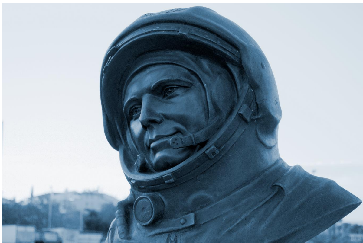
Slika 5 Kip Jurija Gagarina u Puli, slikano 2021. godine

Medijska pozornost ubrzo će biti usmjerena na prvu ženu astronautkinju, odnosno „kozmonautkinju“. Datuma 30. prosinca 1961. Centralni komitet odobrio je program u kojem bi se tadašnjem timu pridružilo 60 novih astronauta, uključujući i pet žena. U potrazi za najboljim kandidatkinjama prednosti su imale žene s iskustvom u zrakoplovstvu ili padobranstvu. Među njima je izabrana Valentina Tereškova koja je tada imala 24 godine. Iako Tereškova nije imala akademske uspjehe poput drugih žena, ipak se isticala po drugim karakteristikama. Naime, bila je aktivni član lokalnog Saveza mladih komunista u svom mjestu. 114 Treninge koje su astronautkinje obavljale u Zvezdanom gradu opisala je Tereškova u svojoj knjizi. Vježbe su uključivale razne sportove koji bi im mogli pomoći u razvoju ravnoteže, treniranju vida i sl. Ona je osobno preferirala skijanje, klizanje, vožnje čamcem, plivanje i ronjenje. Također su kandidatkinje morale učiti o avionima i njihovoj složenoj opremi, ali i naučiti ih voziti. Nedugo nakon leta Vostoka 3 i 4, za novi je let izabran Valerij Fjodorovič Bikovski