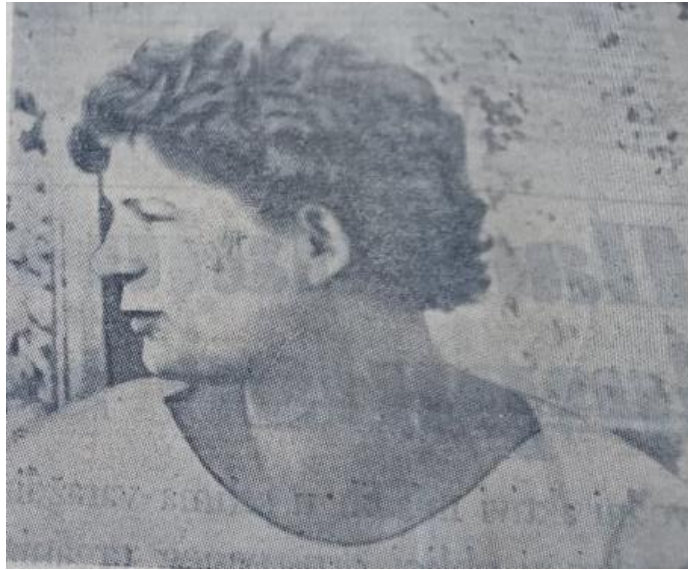
Slika 6 Fotografija Valentine Tereškove, (Novi list, 1963)

Godine 1964. odlučeno je da će se lansirati tri astronauta u jednoj letjelici. Ovom novom misijom testirana je sposobnost tročlane posade da djeluju unutar uskog prostora. Iako su Sovjeti mogli izgraditi veću letjelicu nego što je to bio Vostok, umjesto toga ugrađena su tri sjedala i ograničeno je kretanje astronauta. Za razliku od prethodnih misija, ovoga je puta bilo pet puta manje prostora i zraka po članu. 127 Novi je projekt nazvan Voskhod (hrv. Izlazak sunca). Zadatak medija sada je bio uvjeriti javnost kako se radi o sasvim novoj letjelici, a ne o modificiranom Vostoku. Za novu misiju izabrana su tri muškarca iz različitih područja: Vladimir Komarov kao pilot, Konstantin Feoktistov kao inženjeri i Boris Yegorov kao prvi doktor. Lansiranje rakete s posadom dogodilo se 12. listopada 1964. te je ova kratka misija od jednog dana prošla bez većih incidenata. Dan nakon povratka na Zemlju osim što su astronauti trebali dati izvješće o svome letu, također su se trebali i obratiti novom vođi Sovjetskog Saveza, Leonidu Brežnjevju. 128