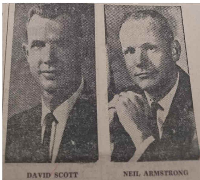
Slika 11 Fotografije Davida Scotta i Neila Armstronga ( Novi list , 1966)

U nastavku komentira izjave američkih reportera koji su rekli kako se u glasu Armstronga osjetila panika. On ga potom brani i tvrdi kako se našao u novoj situaciji koju astronaut još nikad nije prije iskusio. Zato je, prema riječima novinara, to bila „izvanredna prisutnost duha i visok nivo lične hrabrosti“. Iako je zbog problema s vozilom došlo do ranijeg spuštanja na Zemlju, urednik je ispunjen optimizmom u vezi leta. Tvrdi da unatoč tome što to nije u formalnom smislu bila uspješna misija, snalažljivost astronauta u opasnoj situaciji pokazala je kako je njegov let bio dvostruko značajan. 203 Novi List isto je tako izvijestio na naslovnici o događaju, dajući joj podosta prostora. Uz osnovne informacije i sliku astronauta može se uočiti i skroz na vrhu stranice naslov „Johnson: čovjek na mjesecu prije 1970“. Ovdje, u par rečenica, se prenosi mišljenje američkog predsjednika kako će upravo Amerikanac biti prvi čovjek na Mjesecu i to prije nego što desetljeće završi. 204