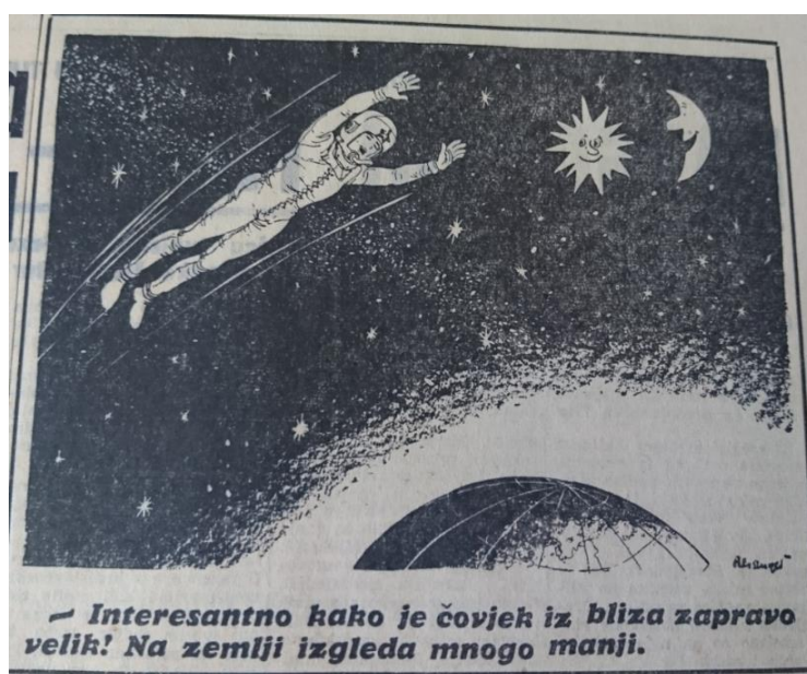
Slika 4 Crtež čovjeka u svemiru inspiriran letom Jurija Gagarina ( Vjesnik , 1961)

Gagarin je potaknuo kreativnost u ljudima, pa tako novine sadrže i razne crteže.