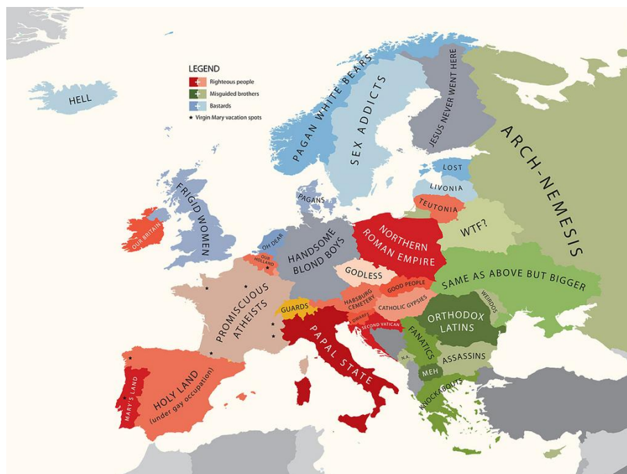
Slika 1. Yanko Tsvetkov, Atlas of Prejudice: The Complete Stereotype Map Collection 47