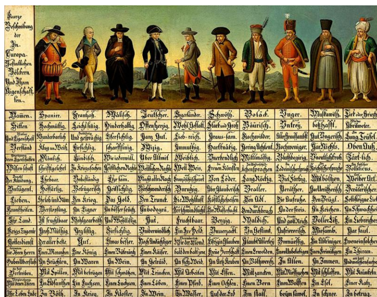
Slika 2. Völkertafel 49