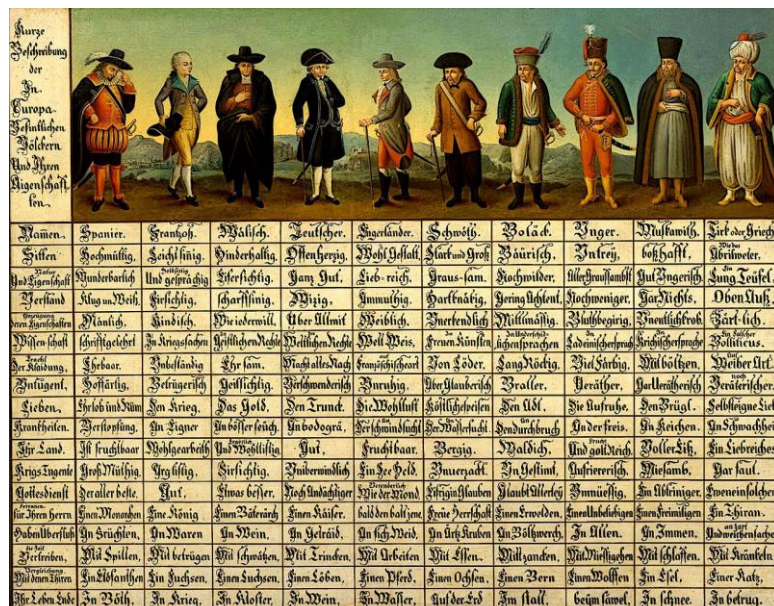
Slika 2. Völkertafel 49