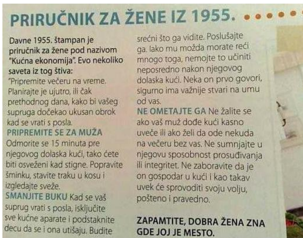
Slika 3. Kućna ekonomija , priručnik za žene iz 1955. 63

ne mogu aktivno sudjelovati u političkim procesima, ne mogu javno glasati, baviti se umjetnošću, znanostu, filozofijom. Ukratko, ne mogu sudjelovati u djelatnostima javnoga života i u tom smislu pridonositi zajednici. Patrijarhalna dominacija izbacila je ženu iz kulturnih, religijskih i društvenih običaja. Možda je upravo takav tijek povijesti rezultirao današnjim mnogobrojnim rodnim stereotipima. Stereotipi se naravno kreću u oba smjera, međutim brojniji su oni vezani uz ženski rod, premda je danas pitanje roda diskutabilno. Gledano s feminističke pozicije, rod je kulturalna interpretacija spola. 62 Osnovni je stereotip da su žene inferiorne muškarcima. Iz toga proizlazi da su žene manje pametne, manje sposobne, slabije fizički i mentalno. Uz bok tome žena mora biti dobra majka, kuharica, domaćica, ljubavnica i mora slušati muža.