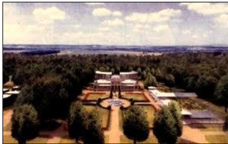
Slika 6. Zdravstveno-rekreacijski centar Lipik

Godine 1983. nakon četverogodišnje gradnje Lipik je dobio hotelski kompleks s pratećim sadržajima nazvan Zdravstveno-rekreacijski centar Lipik kojim je mogao konkurirati na domaćem i europskom tržištu. Napisano potvrđuju i statistički podatci prema kojima se broj domaćih turista udvostručio, dok je broj stranih turista porastao za 85% u odnosu na 1982. godinu. 80 Novosagrađeni hotel Lipik upotpunjen je zabavno-trgovačkim centrom, kuglanom, školom jahanja, novim kompleksom bazena, teniskim igralištima te mogućnostima lova i ribolova što je dostatno za privlačenje tisuća turista. Lipik je postao konkurentna destinacija, a ponovno su se vratili inozemni gosti, među kojima i Šveđani i Izraelci (Slika 6.). 81