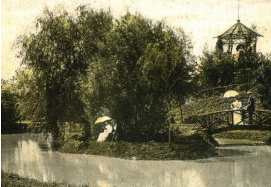
Slika 1. Jelkin brijeg s jezercem i otočićem početkom 20. stoljeća