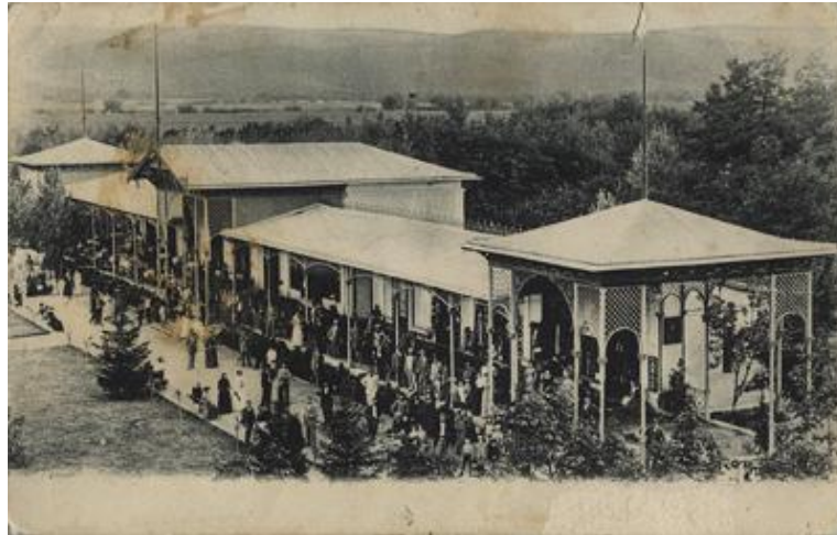
Slika 2. Wandelbahn početkom 20. stoljeća

Godine 1893. po nacrtu mađarskog arhitekta Gustava Ratha gradi se Kursalon s kavanom i plesnom dvoranom prepoznatljiv po monumentalnoj kupoli. Objekt je građen u stilu visoke renesanse s ostakljenim krilima koja mu daju lakoću i prozračnost, a kopija je, u nešto manjim dimenzijama, građevine podignute u bečkom Gradskom parku. Kursalon je dodatno obogatio turističku ponudu pružajući posjetiteljima mogućnost uživanja u dodatnim sadržajima poput kasina s ruletom, salonom s klavirom s ulazom iz parka rezerviranim samo za dame, plesnom i koncertnom dvoranom, kavanom i restauracijom (Slika 3.). 62