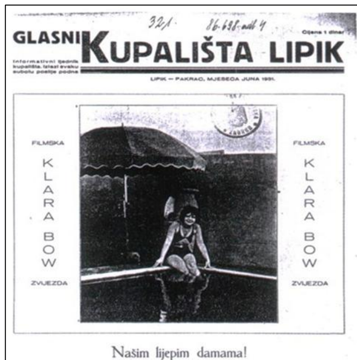
Slika 5. Prvi i posljednji broj Glasnika kupališta Lipik

O etabliranosti Lipika govori i činjenica da su 1931. u Lipiku izlazile dvoje novine: Compas i novi informativni tjednik Glasnik kupališta Lipik , koji je iz tiska izlazio svake subote poslije podne. 75 Turistički sjaj predratnog razdoblja Lipik ponovno doživljava krajem 1930-ih godina, kada po broju gostiju postaje druga najposjećenija destinacija u tadašnjoj Jugoslaviji (Slika 5.). 76