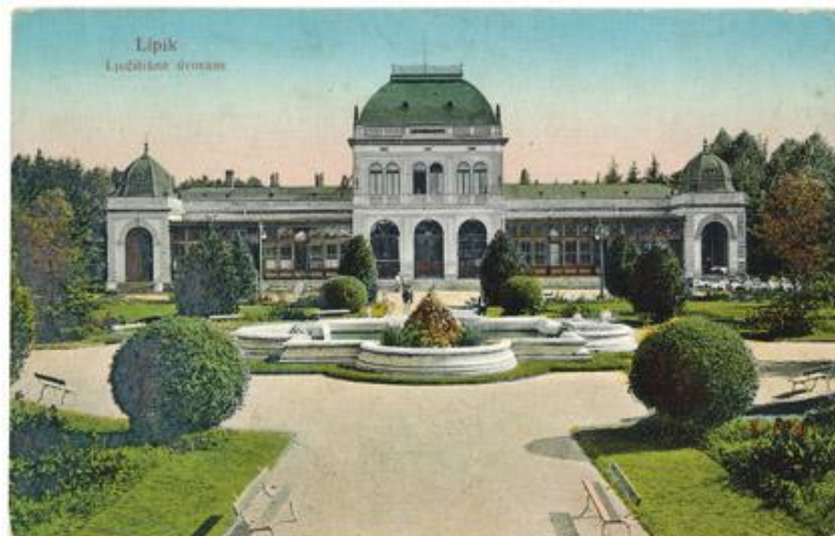
Slika 3. Kursalon krajem 19. stoljeća

Godine 1893. po nacrtu mađarskog arhitekta Gustava Ratha gradi se Kursalon s kavanom i plesnom dvoranom prepoznatljiv po monumentalnoj kupoli. Objekt je građen u stilu visoke renesanse s ostakljenim krilima koja mu daju lakoću i prozračnost, a kopija je, u nešto manjim dimenzijama, građevine podignute u bečkom Gradskom parku. Kursalon je dodatno obogatio turističku ponudu pružajući posjetiteljima mogućnost uživanja u dodatnim sadržajima poput kasina s ruletom, salonom s klavirom s ulazom iz parka rezerviranim samo za dame, plesnom i koncertnom dvoranom, kavanom i restauracijom (Slika 3.). 62