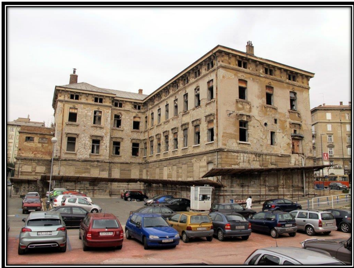
Slika 2 Bivša tvornica Rikard Benčić

trajne baštine, od kojih se ističu jedanaest stalnih umjetničkih instalacija i skulptura na otvorenom, na obali i na otocima na području Kvarnera. 95