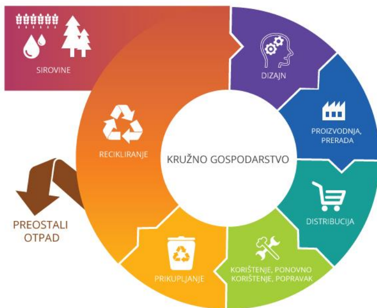
Slika 5: Kružna ekonomija