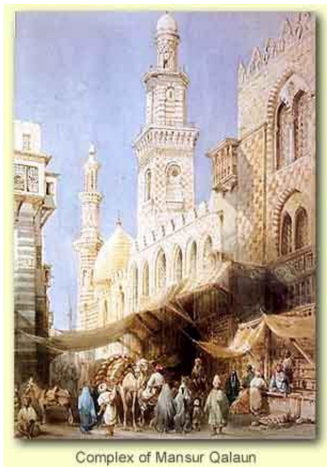
Slika 1. Bolnica Mansuri u Kairu

u Japanu i Indiji. U Indiji se popularizirala yoga i tzv. ayurvedska medicina koja kroz tradicionalni sistem liječenja polako razvija Indiju u stalnu destinaciju dolazaka duhovnih učenika i medicinskih putnika. S druge strane u Japanu su se razvijala odredišta poput Onsen , odnosno vrućih mineralnih izvora čija su se svojstva vode smatrala vrlo ljekovitima. Ovu vrstu izvora primijetili su klanovi ratnika koji su ih koristili kako bi ublažili bol i izliječili rane te se što prije oporavili od bitaka koje su vodili. Islamske kulture počele su u velikom broju uspostavljati sustave zdravstvene skrbi, koji su služili i strancima. Primjerice, u Kairu je 1248. godine izgrađena bolnica Mansuri (slika 1) koja se smatrala najnaprednijom i najvećom bolnicom u svijetu tog doba. Imala je kapacitet za smještaj 8 000 osoba te je postala glavno zdravstveno odredište za strance, neovisno o vjeri ili rasi. 12