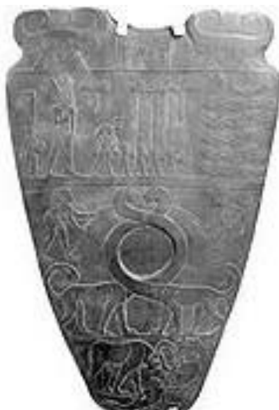
Primjer 1. Olovna ploča korištena u starom Egiptu