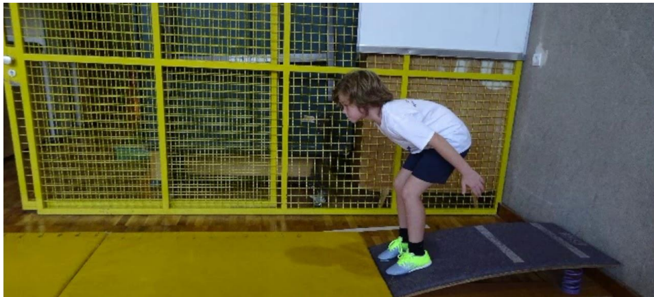
Slika5. Prikaz pravilnog izvođenja skoka u dalj

Za mjerenje eksplozivne snage koristi se test skoka u dalj. Za uspješne rezultate potrebne su dvije spojene strunjače dužine 3,5 metra, metalna metarska traka, ravnalo u obliku slova t te odskočna daska. Ispitanik sunožno skače s kraja odskočne daske pri čemu mu je dozvoljeno zamahivanje ruku. Učenik skače bos, tri puta zaredom, a mjeriteljev zadatak je zabilježiti najdulji trag ispitanika kojeg je napravio u tri pokušaja. Rezultat skoka se upisuje u centimetrima.