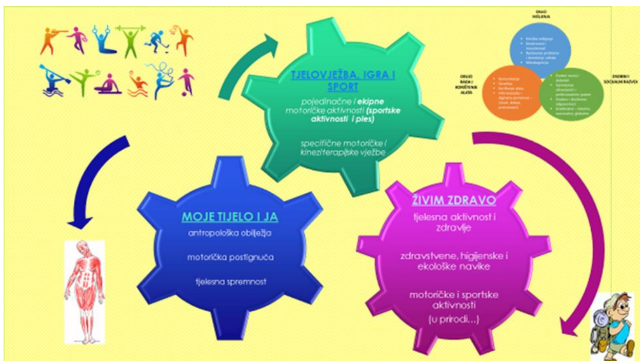
Slika 1. Grafički prikaz predmeta Tjelesne i zdravstvene kulture – domene

( https://www.google.com/search?q=domene+tjelesnog&sxsrf=ALeKk005Y6cM4XrdXUyLzrj2Yi-AN1ezqQ:1599923231516&source=lnms&tbn=isch&sa=X&ved=2ahUKEwi5nle_8uPrAhWuk4sKHX-tCAMQ_AUoAXoECAwQAw#imgrc=zBq5IA8aivFx0M )