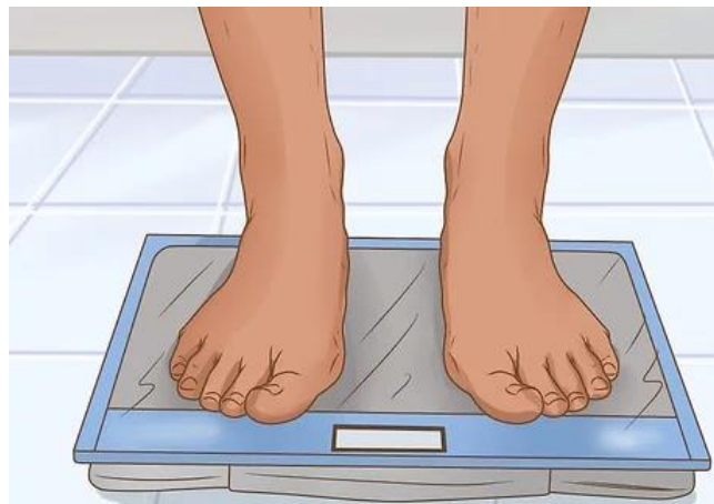
Slika 2. Mjerenje mase tijela

Tjelesna težina ili masa tijela mjeri se vagom. Preporučuje se korištenje digitalne ili medicinske vage, ali ukoliko mjeritelj nije u mogućnosti pribaviti neku od tih vrsta vagi, koristi se vaga na pero. Prije samog početka mjerenja treba provjeriti je li vaga postavljena na nulti položaj te nalazi li se u vodoravnom položaju na odnosu podloge. Ispitanike se uputi da stanu na vagu bez obuće, punim stopalima te u uspravnom stavu s rukama opuštenim uz tijelo. Nakon što se pero zaustavi na određenoj vrijednosti, vrijednost se bilježi.