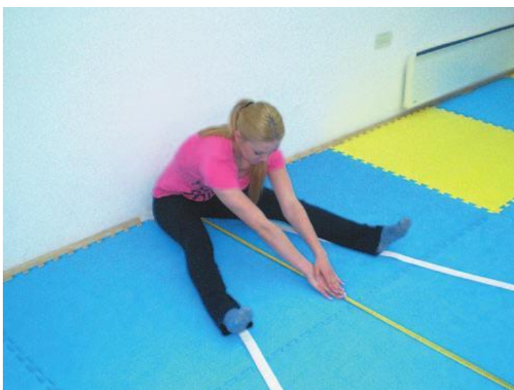
Slika 9. Primjer pravilnog izvođenja pretklona raznožno

Svrha zadatka je procjena fleksibilnosti ispitanika. Kao pomagalo služi nam drveni krojački metar. Zadatak učenika je da sjedne ispred zida na ravnu površinu pri čemu noge raširi pod kutom od 45 stupnjeva. U tom položaju ispruži ruke tako da postavi desni dlan na nadlakticu lijeve ruke, i tako postavljene i ispružene ruke spušta na tlo ispred sebe. Osoba koja je zadužena za mjerenje postavlja metar na mjesto gdje učenik dodirne tlo vrhovima prstiju. Učenik izvodi što dublji pretklon, bez trzaja tako da prsti klize po podu. Bilježi se najbolji rezultat od tri pokušaja, a očitava se i bilježi u centimetrima.