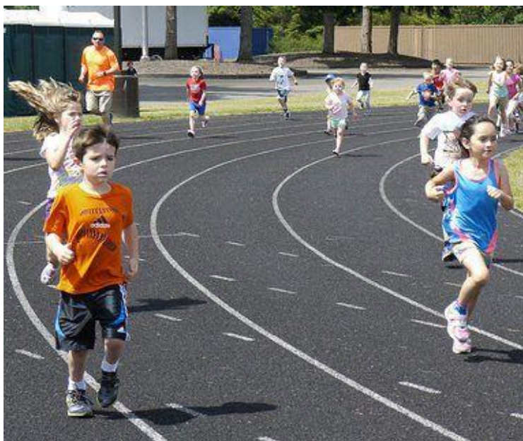
Slika 11. Prikaz mjerenja aerobne izdržljivosti na atletskoj stazi

https://www.google.com/search?q=kids+runing+in+gym+&tbm=isch&ved=2ahUKEwi7rYyknebrAhUCwYUKHbWjDIEQ2-cCegQIABAA&oq=kids+runing+in+gym+&gs_lcp=CgNpbWcQAzoHCCMQ6gIQJzoECCMQJzoFCAAQsQM6AggAOgQIABBDOgcIABCxAXBDQgQIABAEogQIABATogYIABAEBNQp15Y96QBYL6oAWgBcAB4AYAB5AqIAfZCkgEPMC40LjYuMi4wLjluMS4zmAEAoAEBggELZ3dzLXdpei1pbWewAQrAAQE&scient=img&ei=bR1eX_vCCoKClwS1x7KICA&bih=576&biw=1366&hl=hr&hl=#imgsrc=Eqr4a_eM2hfGWM