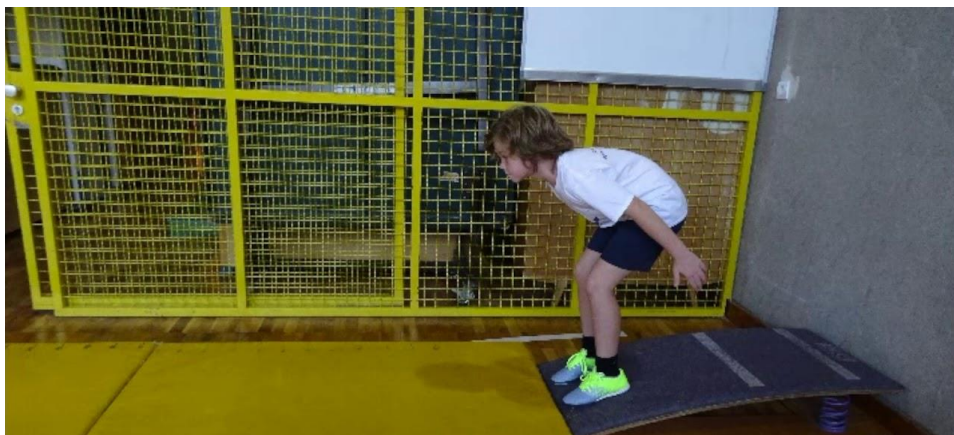
Slika5. Prikaz pravilnog izvođenja skoka u dalj

Za mjerenje eksplozivne snage koristi se test skoka u dalj. Za uspješne rezultate potrebne su dvije spojene strunjače dužine 3,5 metra, metalna metarska traka, ravnalo u obliku slova t te odskočna daska. Ispitanik sunožno skače s kraja odskočne daske pri čemu mu je dozvoljeno zamahivanje ruku. Učenik skače bos, tri puta zaredom, a mjeriteljev zadatak je zabilježiti najdulji trag ispitanika kojeg je napravio u tri pokušaja. Rezultat skoka se upisuje u centimetrima.