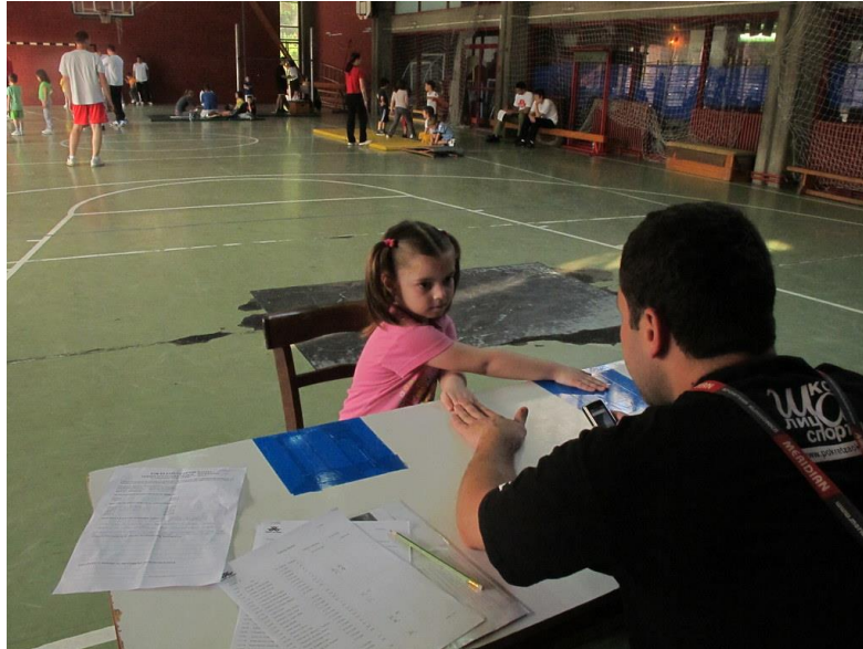
Slika 10. Primjer pravilnog izvođenja tapinga rukom

stavlja križno na jedan od krugova. Na znak, učenik kreće svojom boljom rukom izmjenično dodirivati ploče. Rezultat se mjeri 15 sekundi, a bilježi se broj uspješnih dvostrukih dodira unutar 15 sekundi.