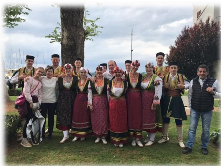
fotografirano 03. 05. 2019.,Pula