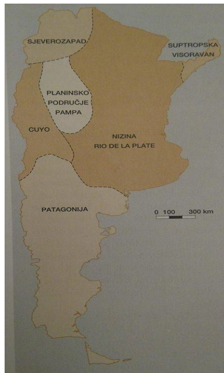
Slika 2. Reljefne cjeline Argentine