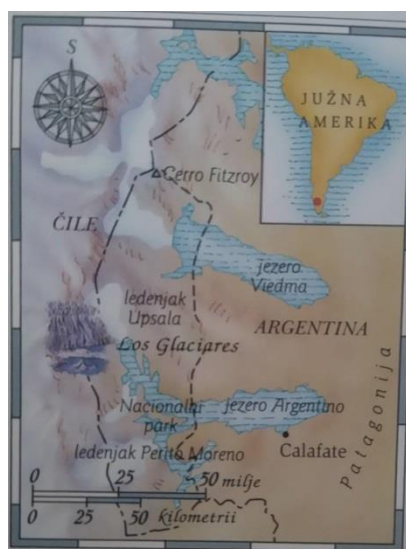
Slika 6. Smještaj na karti